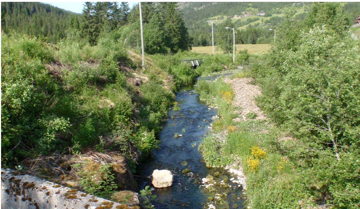
Datert 15.07.13 - "Liten vassføring" vises på bildet. Her vises minstevassføring pluss restvassføring. Bildet illustrerer en normalsituasjon sommerstid.

Grovåi - minstevassføringslipp pluss restfelt.