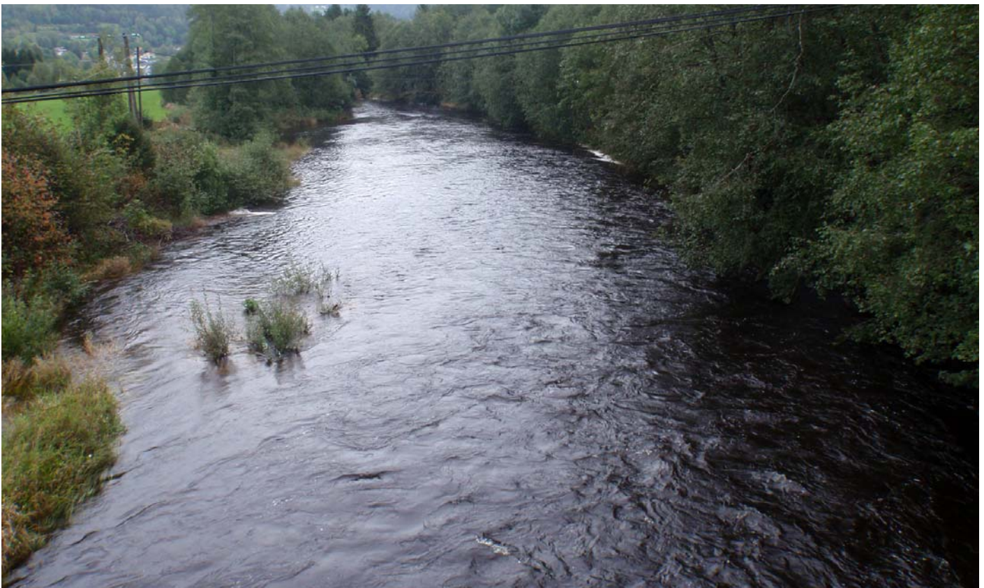
Datert 09.09.14 - "Stor vassføring" i flomsituasjon vises på bildet.