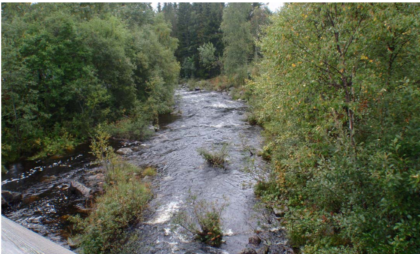
Datert 08.09.14 - "Stor vassføring" ved liten flomsituasjon vises på bildet.