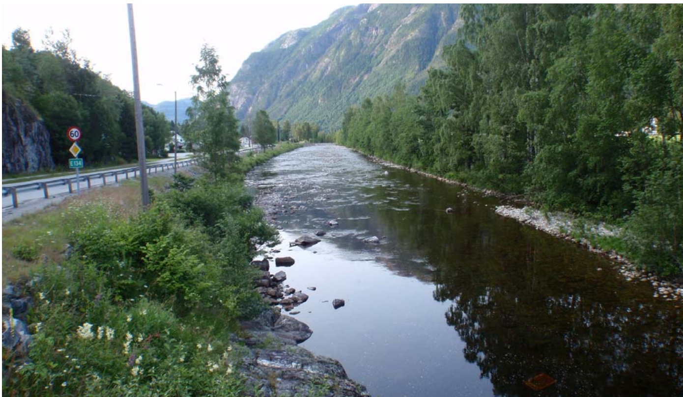
Datert 15.07.13 - "Liten vassføring" vises på bildet. Her vises minstevassføring pluss restvassføring. Bildet illustrerer en normalsituasjon sommerstid.

Flatdøla - minstevassføringslipp pluss restfelt.