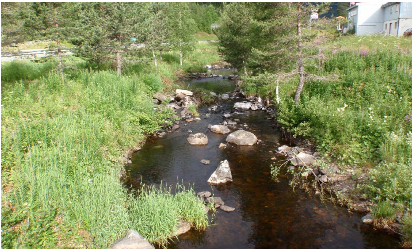
Datert 15.07.13 - "Liten vassføring " ca 100 l/s vises på bildet.

Morgedalsåi - minstevassføringslipp pluss restfelt.