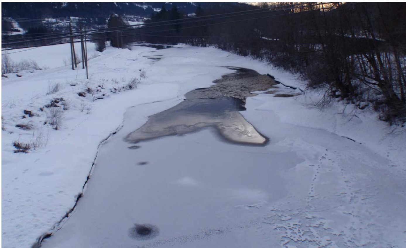
Datert 22.02.16 - Bildet viser normale vinterforhold.

Dalaåi 2 - minstevassføringslipp pluss restfelt.