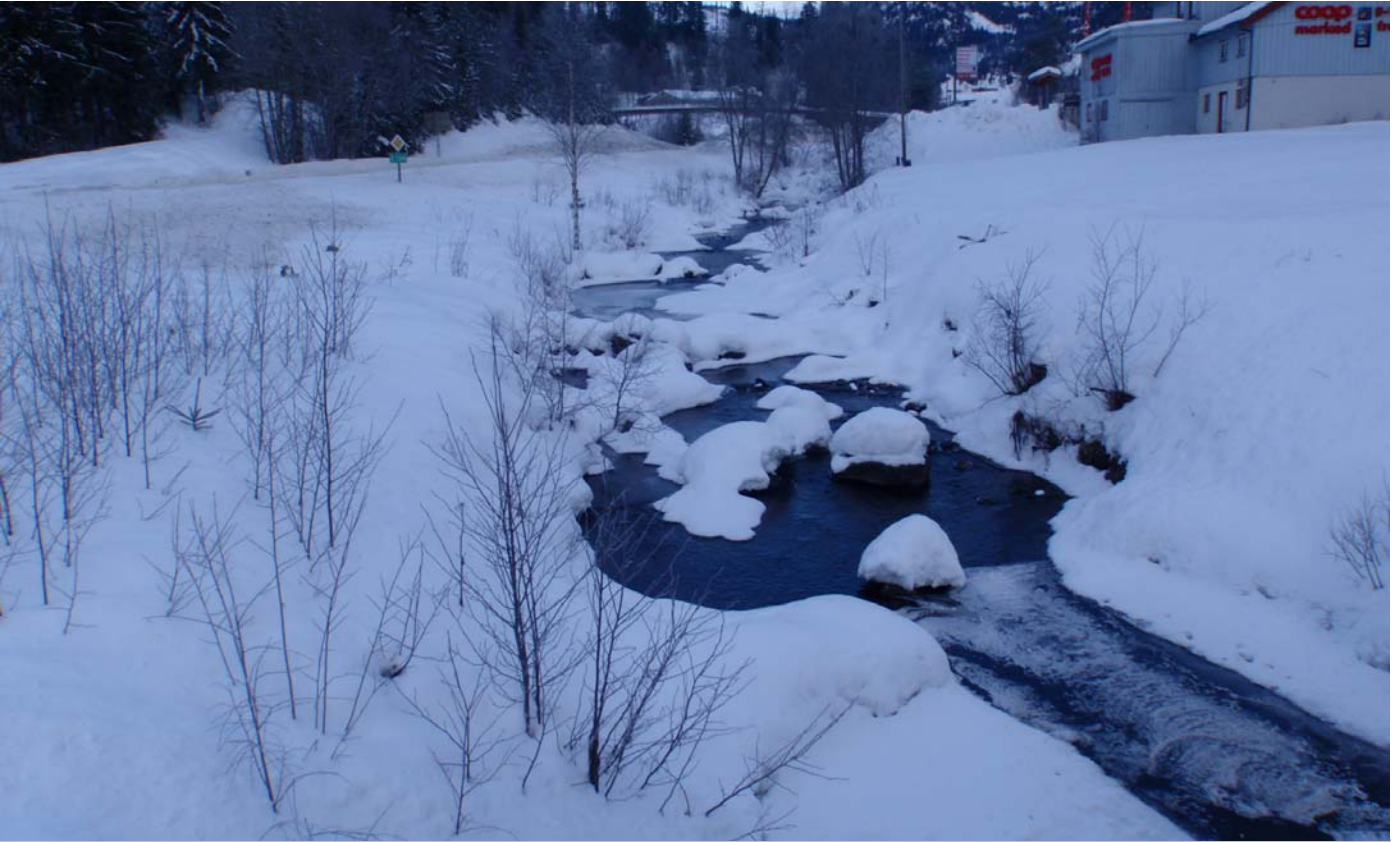
Datert 22.02.16 - Bildet viser normale vinterforhold.

Morgedalsåi - minstevassføringslipp pluss restfelt.