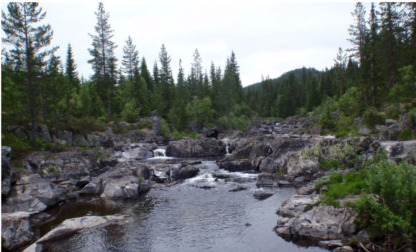
Datert 15.07.13 - "Liten vassføring " ca. 200 l/s vises på bildet en tørr sommerdag.

Dalaåi - minstevassføringslipp pluss restfelt.