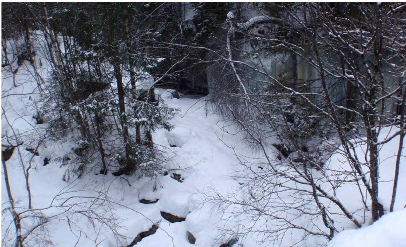
Datert 22.02.16 - Bildet viser normale vinterforhold.