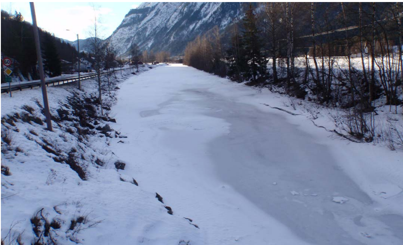
Datert 22.02.16 - Bildet viser normale vinterforhold

Flatdøla - minstevassføringslipp pluss restfelt.