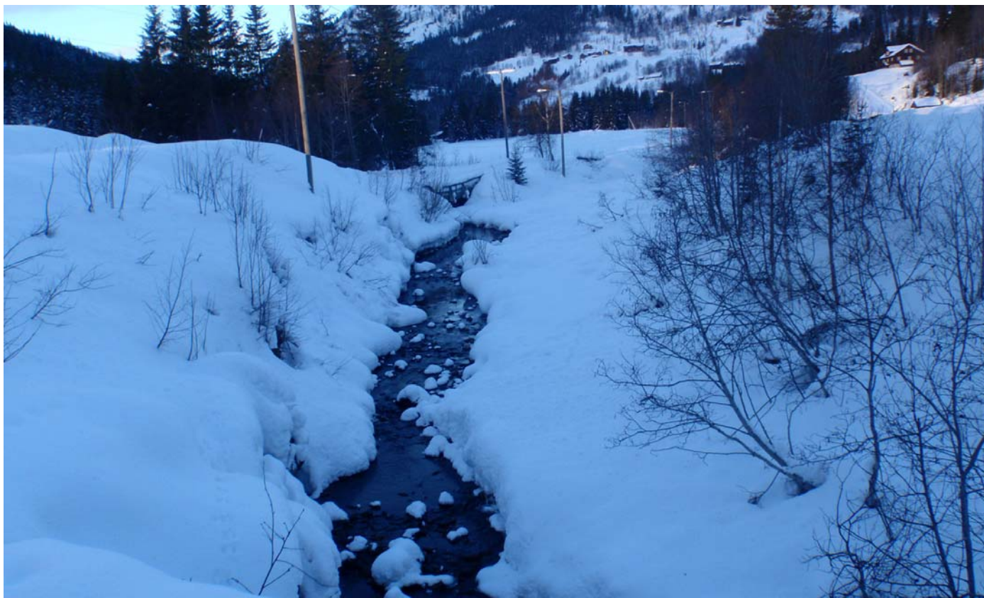
Datert 22.02.16 - Bildet viser normale vinterforhold.

Grovåi - minstevassføringslipp pluss restfelt.