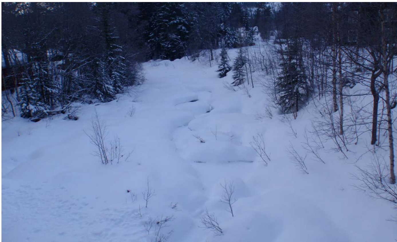
Datert 22.02.16 - Bildet viser normale vinterforhold.

Ofteåi - minstevassføringslipp pluss restfelt.