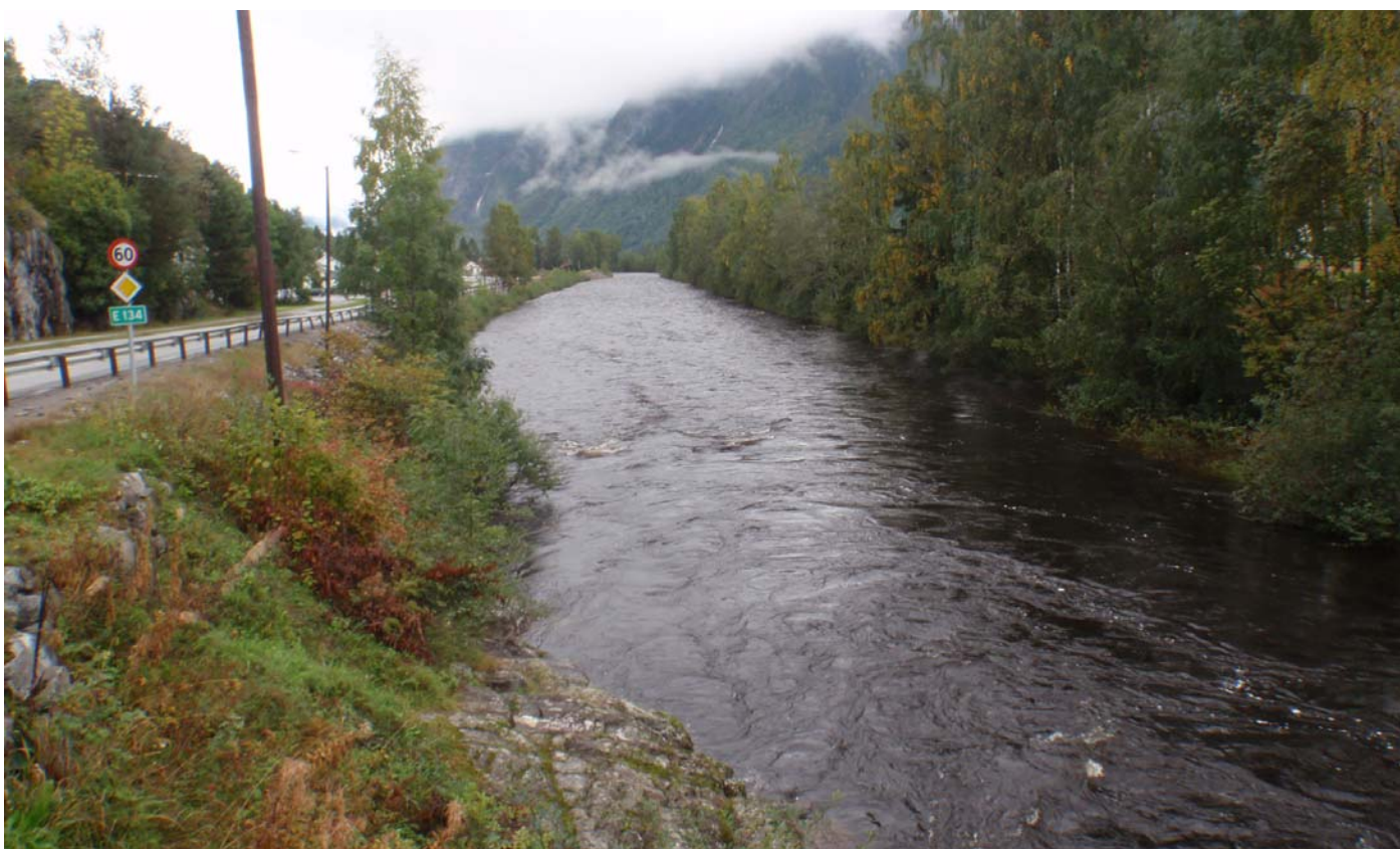
Datert 09.09.14 - "Stor vassføring" vises på bildet.