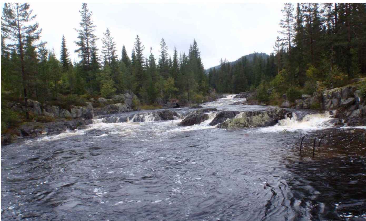
Datert 09.09.14 - "Stor vassføring" i en liten flomsituasjon vises på bildet.