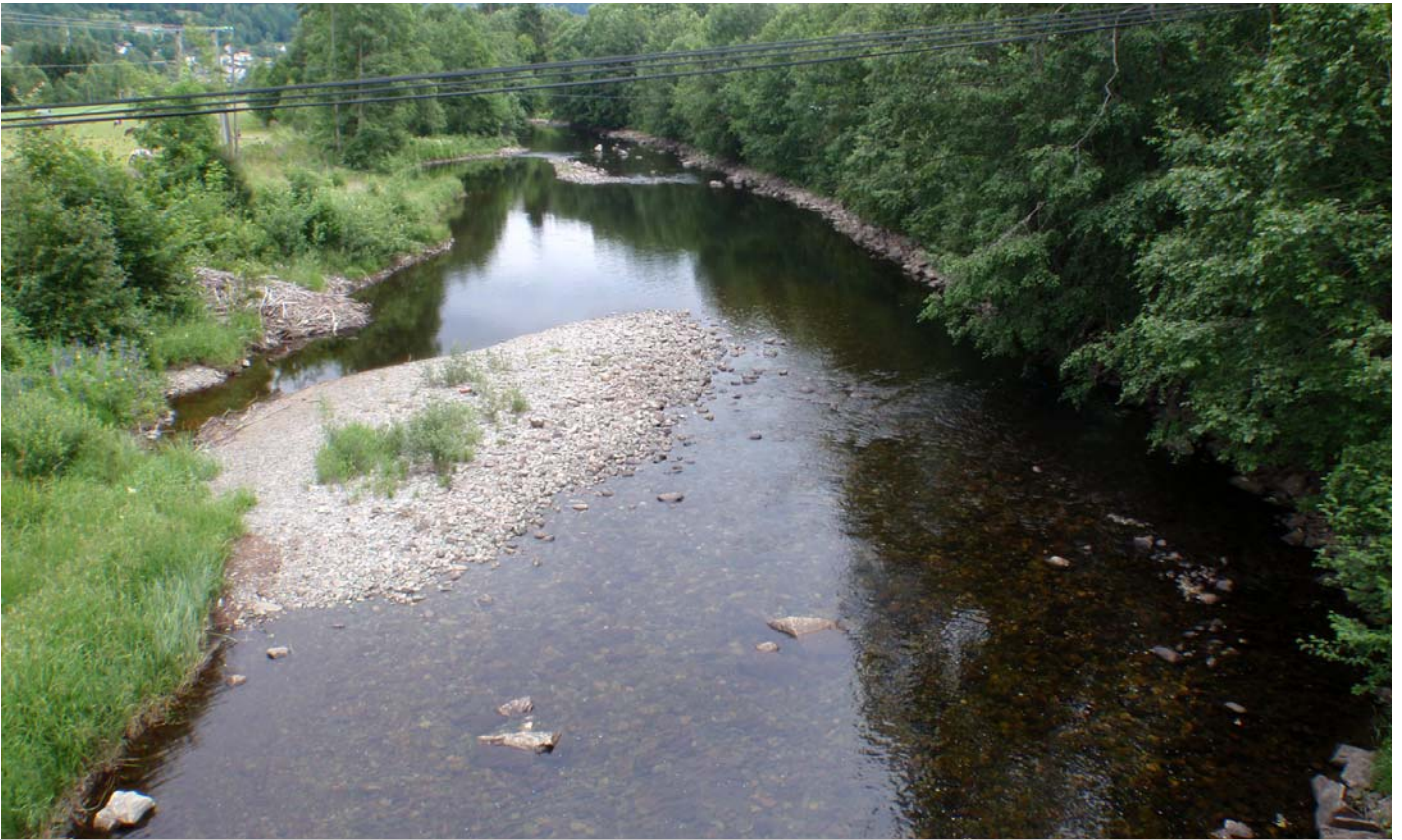
Datert 15.07.13 - "Liten vassføring " ca. 400- 500 l/s vises på bildet en tørr sommerdag.

Dalaåi 2 - minstevassføringslipp pluss restfelt.