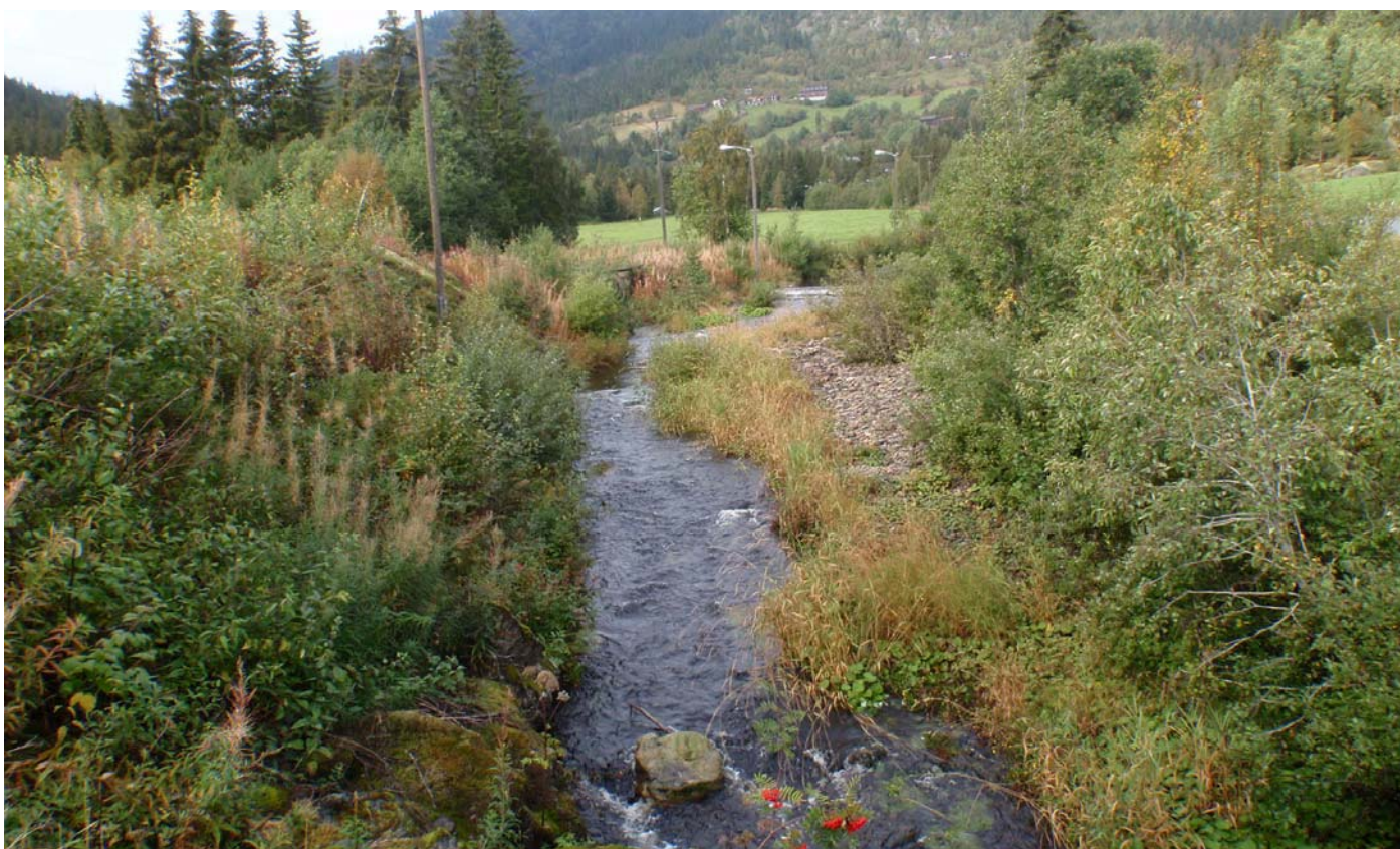
Datert 09.09.14 - "Stor vassføring" 300-400 l/s etter nedbørsperiode.