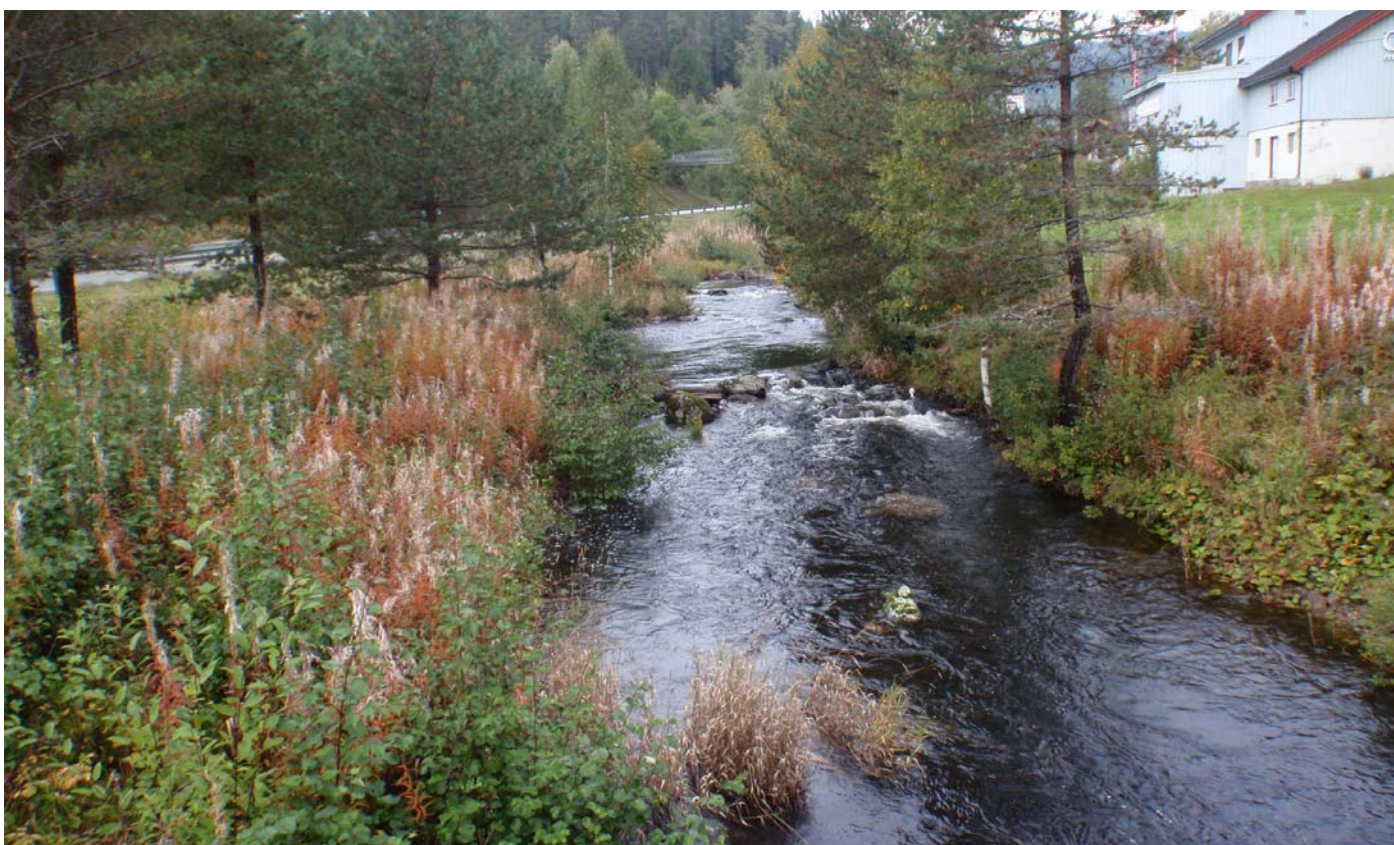
Datert 09.09.14 - "Middels/stor vassføring" vises på bildet.