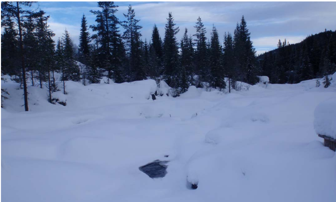
Datert 22.02.16 - Bildet viser normale vinterforhold.

Dalaåi - minstevassføringslipp pluss restfelt.