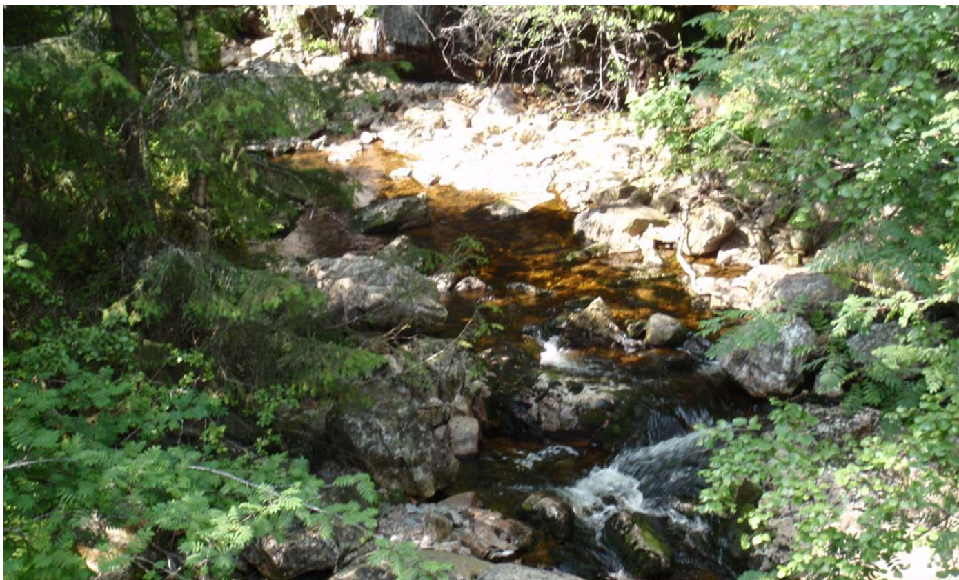
Datert 15.07.13 - "Liten vassføring" vises på bildet. Her vises naturlig tilsig i tørr periode.