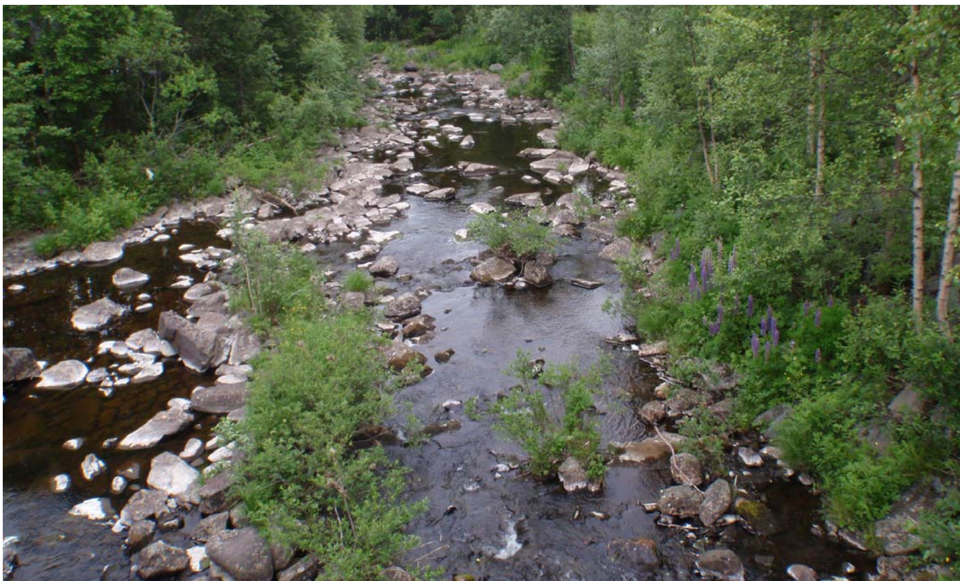
Datert 15.07.13 - "Liten vassføring" ca. 50 l/s vises på bildet.

Ofteåi - minstevassføringslipp pluss restfelt.