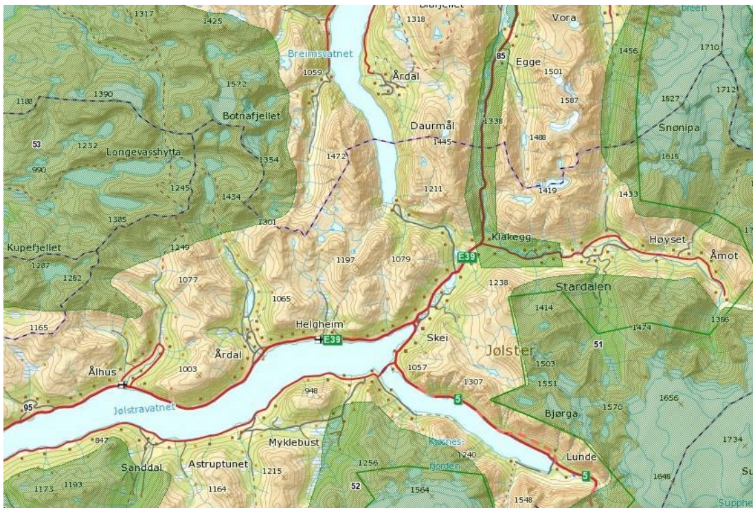
Fylkesatlas: Friluftsområde med nasjonal og regional verdi.

Friluftsområde med nasjonal og regional verdi er markert i denne planen frå år 2000.