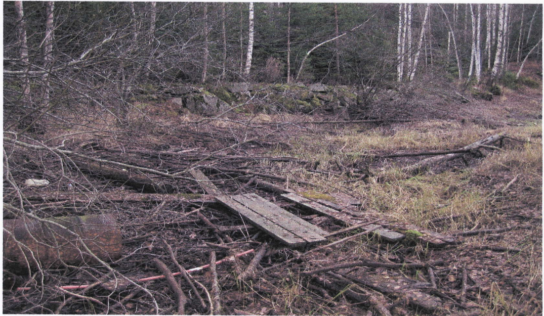
Oppsamlet vrakgods indre del av vika