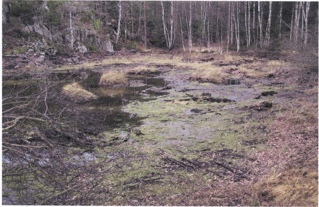
Indre del av vika ved middels vannstand