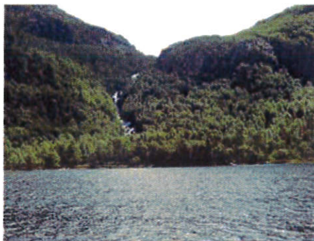
Figur 1 Lågliåna fotografert juni 2014.

Strand Forsand Turlag og STF vil med dette be om at NVE avslår søknaden om Dalen 2 kraftverk og pumpe.