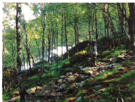
Figur 3 En godt brukt sti går parallelt med Lågliåna.