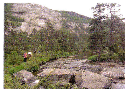
Figur 1 Turstien følger elva opp gjennom Skurvedalen.