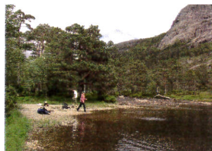
Figur 2 Et stykke nedenfor Songesandstølen utvider elva seg og danner en liten men et svært idyllisk innsjø med gode fiskemuligheter. Konsekvensene av kraftutbyggingen for den vesle innsjøen burde vært beskrevet i søknaden.

Konklusjon: Stavanger Turistforening ber om at NVE avslår søknaden om Songesand kraftverk.