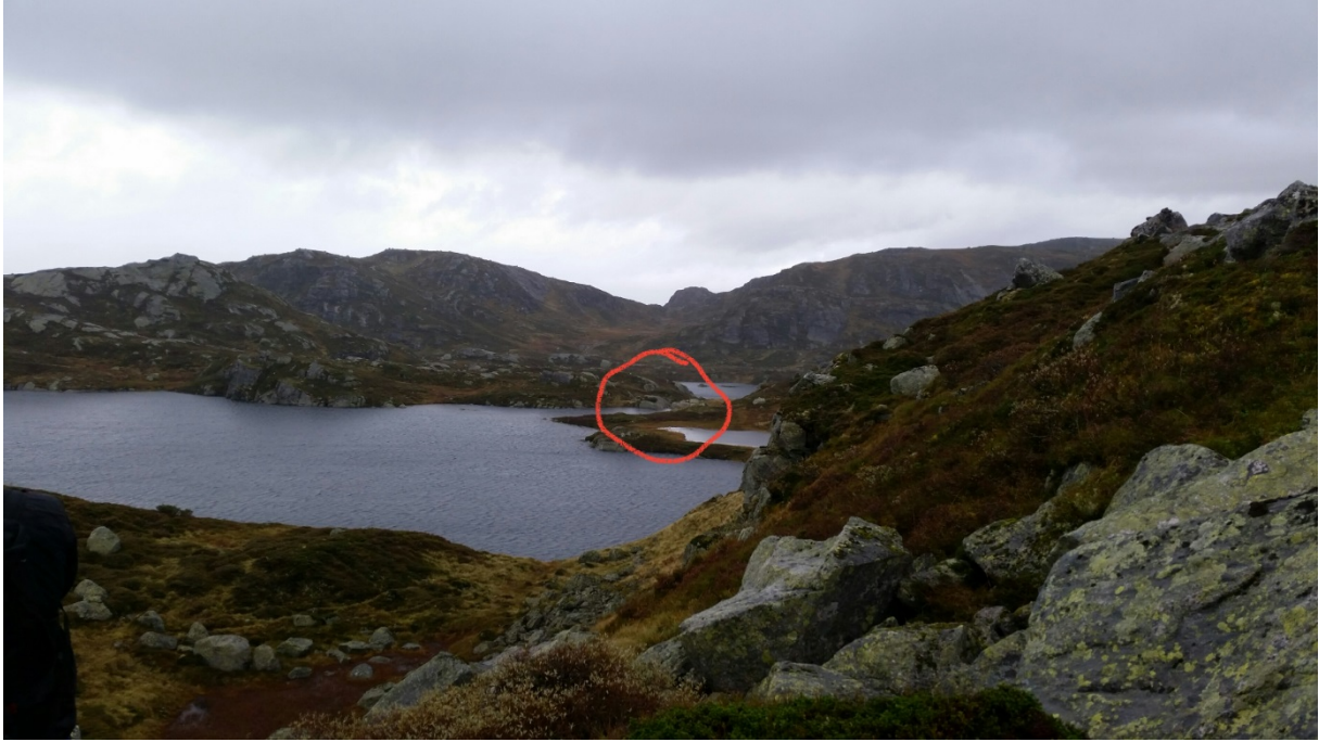
Stad for demning i enden av Vestre Melraktjødn.