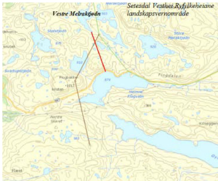
Trekkvei for rein i prosjektområdet (brun strek). Rød strek viser den planlagte overføringa. Frå søknaden.

Mellom Melraktjødnane, og sør for Vestre Melraktjødn, går det eit villreintrekk frå landskapsvernområdet sørvestover til vestsida av Heimre Flogvatn. Herfrå går trekket vidare sørover i retning Hilleknuten. Dette trekket er registrert i Miljødirektoratet sin naturbase, men er ikkje rekna som hensynssone for trekk i Heiplanen. Det er likevel viktig å ta hensyn til potensielle trekkruiter for villreinen.