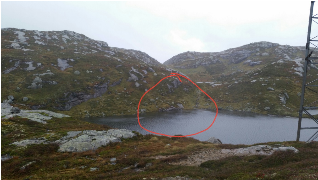
Stad for tunnelinntak, Vestre Melraktjødn.