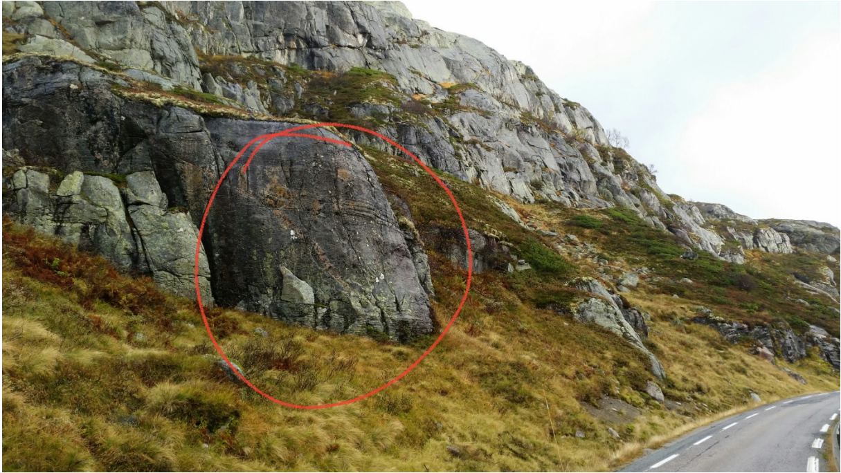
Påhuggstad, Heime Flogvatn.