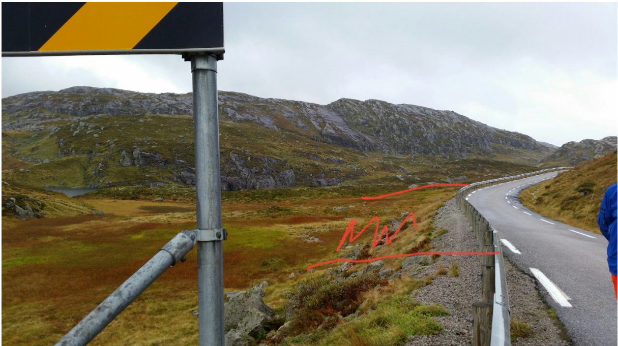
Statskog sitt forslag til stad for bruk av tunnelmasse, som utjamning av vegskråning og bruk som trekkveg.