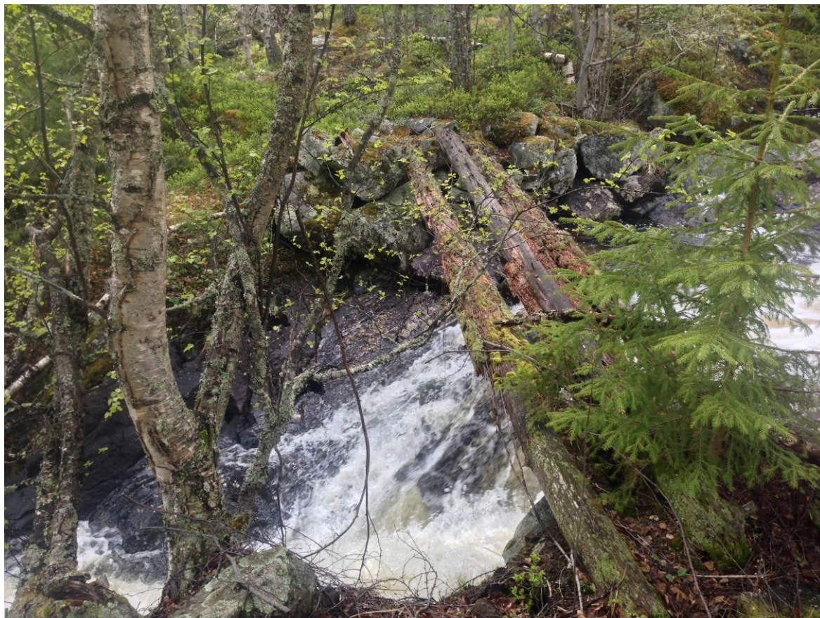
Bilde 2.2 Inntak ca kote 280 moh sett nedenfra