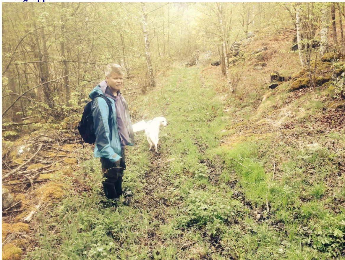
Bilde 1.1 Adkomstvei til kraftstasjon – eksisterende traktorvei