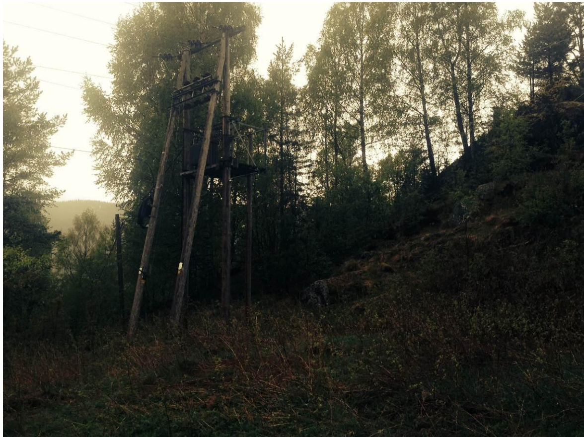
Bilde 6.1 Eksisterende 22 kV nettstasjon