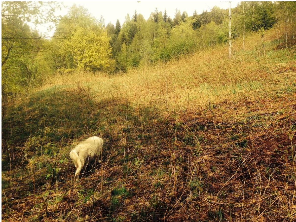
Bilde 5.1 Over det nederste jordet