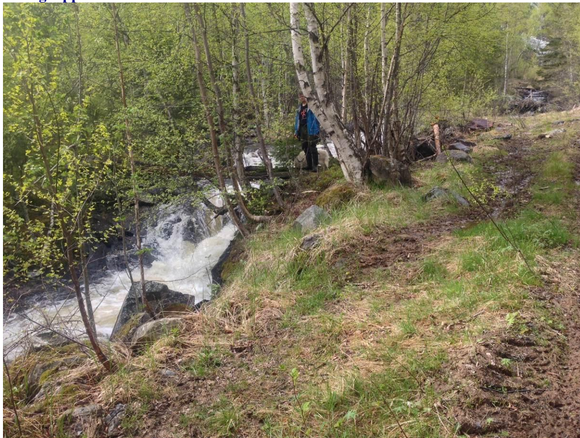
Bilde 2.1 Inntak ca kote 280 moh sett nedenfra