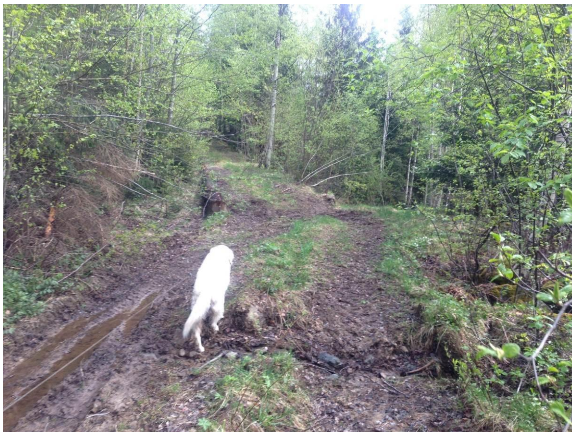
Bilde 1.2 Adkomstvei til dam og inntak – eksisterende traktorvei