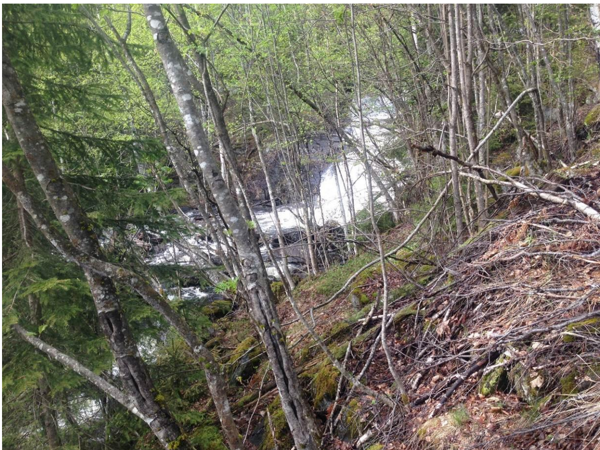
Bilde 3.2 Elva sett fra skogsveien