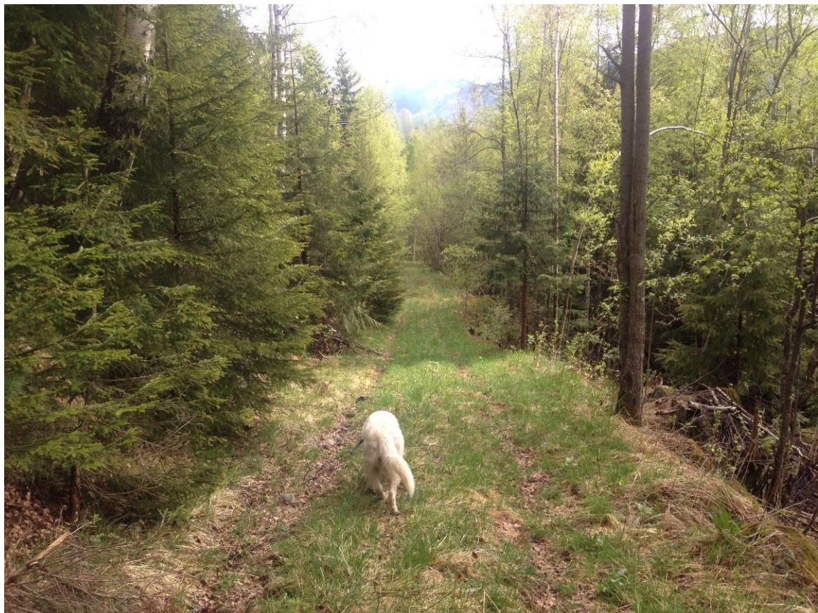
Bilde 5.2 Rørgate langsetter skogsvei