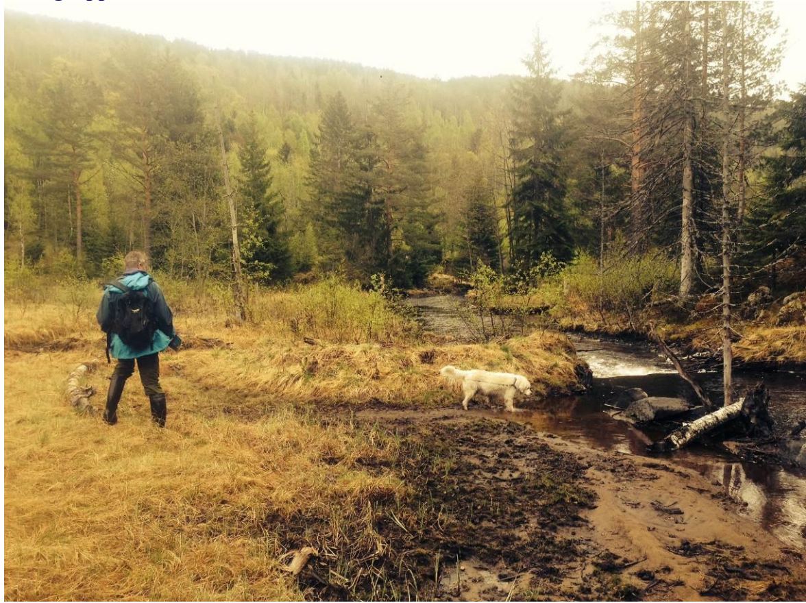
Bilde 4.1 Kraftstasjon plasseres midt på bildet til venstre her