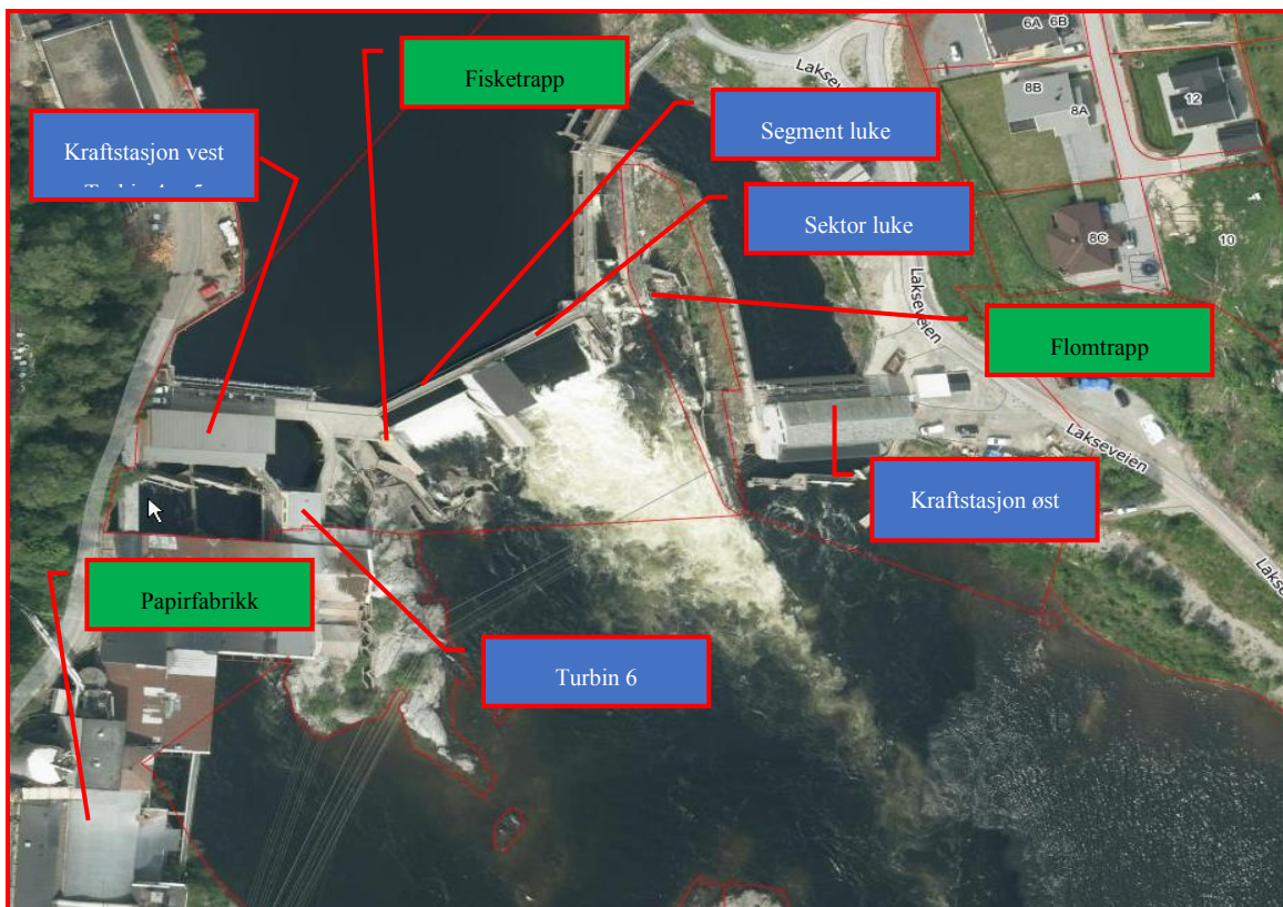
Figur 2. Kart over Hellefoss kraftverk.