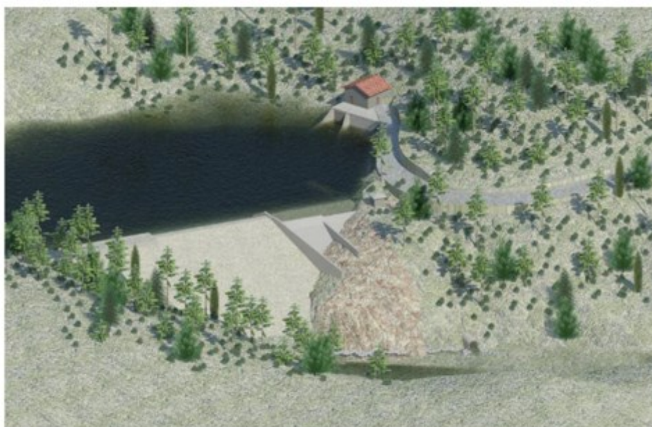
Figur 3: Inntaksdam og inntak ved Merravadet.