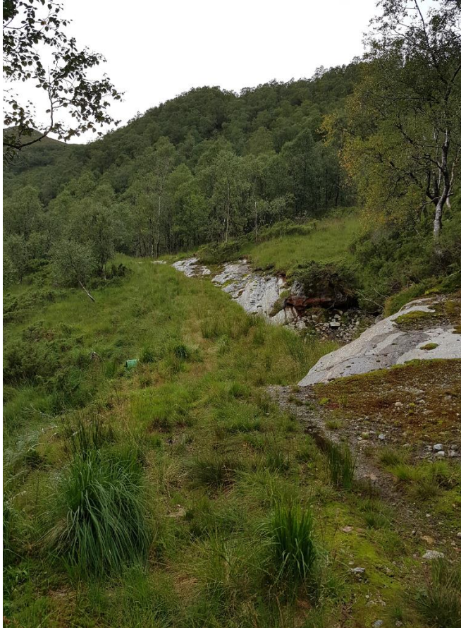
Figur 5: Bildet av traktorveien gjennom Myrdalen.