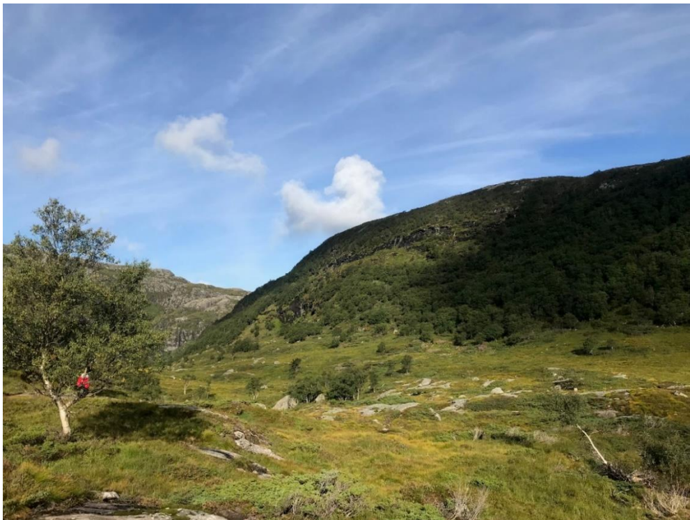
Figur 1: Bilde av område for planlagt adkomstvei.

Med det åpne landskapet og de karakteristiske fjellformasjonene erfarte NVE at Dalsbotnfjellet er et område godt egnet til friluftsliv og rekreasjon. Langs den rødmerkede stien passerte vi to punkter med loggbøker for besøkende, begge med tydelige spor etter gammel seterdrift. Dalsbotnfjellet er et åpent fjellplatå bestående av bart fjell og spredt myr, og toppene gir god utsikt mot alle himmelretninger.