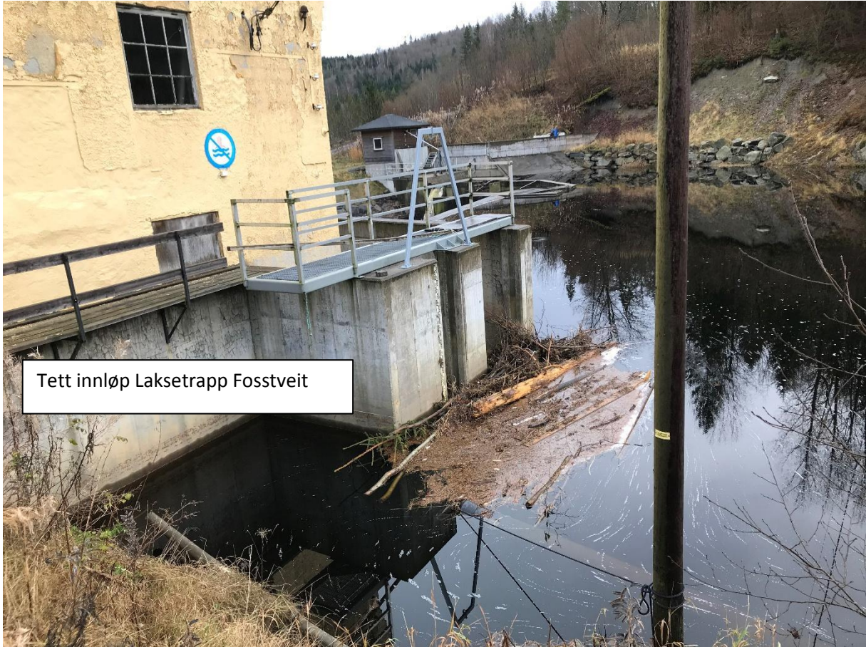
Tett innløp Laksetrapp Fosstveit