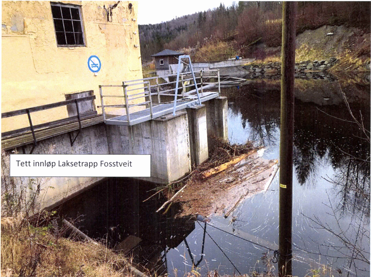
Tett innløp Laksetrapp Fosstveit