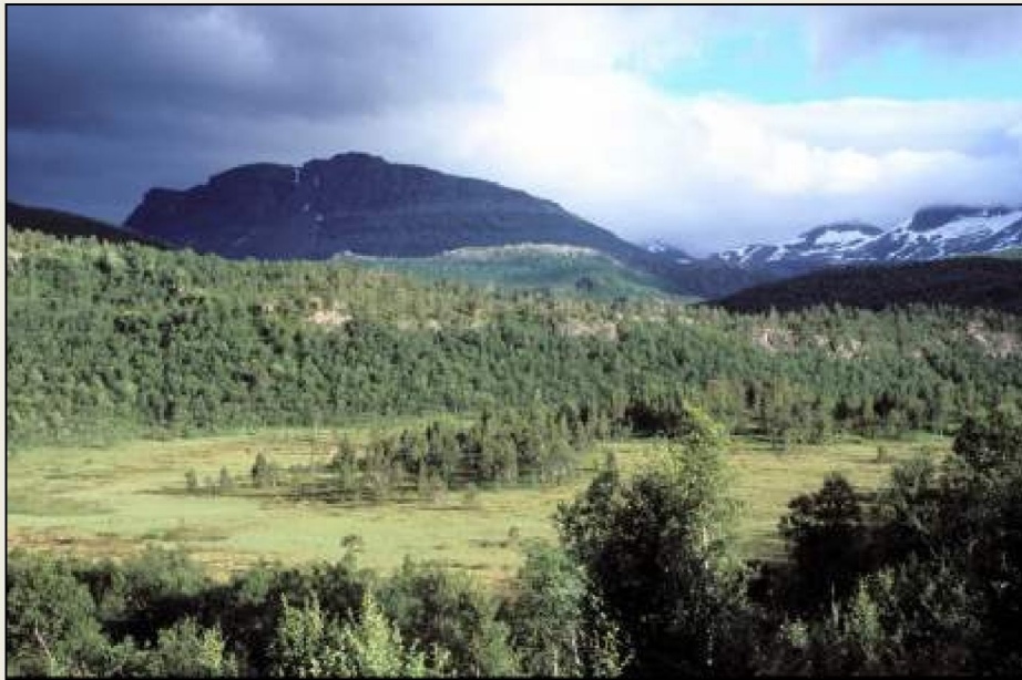
Myrområdene ved Balteskaret er viktige for ender og vadefugl. Lafjelltinden sees i bakgrunnen.

Vernet i verneplan for vassdrag i 1973. (Verneplan I).