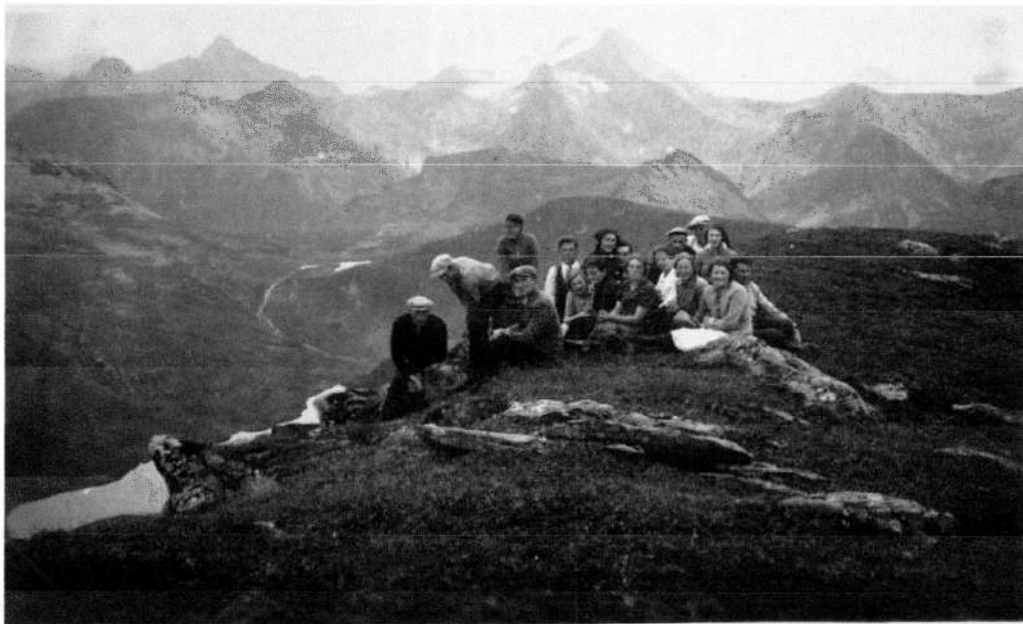
Ungdom frå Vartdal og Remen på Bergehornet. Store Risaskarsvatnet under, Nedre Svartevatnet ca midt i bildet bak. Tryhornet ragar midt bak. Ca 1935-40?