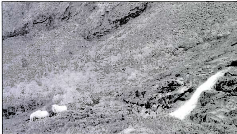
Skal det vere slutt på fossane nedetter Skaret? Oktober 2015

Vi er generelt positive til at Vartdal kraftverk vert satsa på, då anlegget klart treng fornying. Vi er opptekne av at dette skjer på ein måte som ikkje forringar landskap- og naturoppleving, og som ikkje skaper vanskar for folk, fe og vilt.