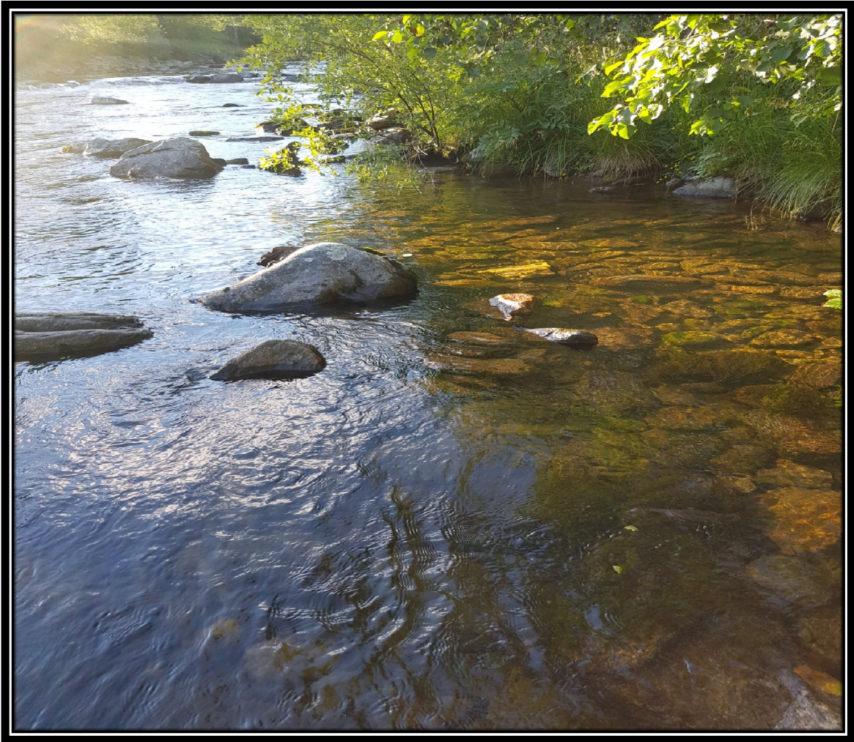
Stasjon 4 den 27.07.16