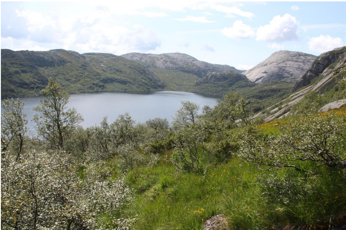
Ytre Skreåvatn er et oligotroft vannmagasin vegetasjonen rundt er preget av åpen eller delvis skogdekket mark med varierende fuktighet, stedvis sumpmark i hellende terreng.

Ytre Skreåvatn (ca.0,46 kvadrat-meter) er et typisk oligotroft vann, kalkfattig og svært klar innsjø. Vannet er påvirket av vassdragsregulering i dag(trolig på VR3- moderat reguleringseffekt). Strandsonen i vannet dekker et lite areal, det er plante-arter som finnes i ekstremt fattig strandmiljø. Vegetasjonstypen som dominerer er «Fattig kortskuddstrand – fattig utforming» (O1a). I beskyttede bukter i de åpne vannmasser, finnes det spredte forekomster av typen «Mose-sjøbunn»- det er mest horn-torvmose som vokser her. Det er ikke noe form for helofytt – ferskvannsump i tilknytning til strandsonen eller flyteblad vegetasjon i de åpne vannmassene. Strandsonen er lite utviklet fattig kortskudd-strand. Ferskvannbunnsystemet er stort sett ferskvann hardbunn med grov grus, stein og fast fjell. Strandsonen er utsatt for stor bølgepåvirkning (særlig i forhold til vannets størrelse), vegetasjonen preges av å være bølgepåvirket og dominert av arter som er tilpasset dette miljøet. På substrater dominert av grov grus – fjell er det plantearter som vokser på stein som danner vegetasjonen. I stor grad er dette «epilittisk lav-vegetasjon» med en-sjiktet samfunn bestående av få arter lær- navle- eller skorpe-lav.