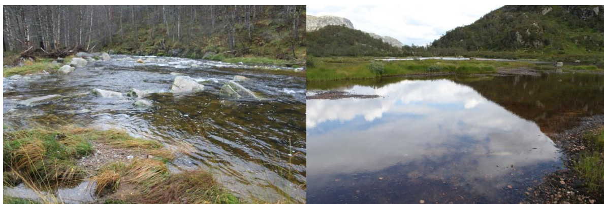
Figur 3. Bilder som viser ulike deler av naturtype-forekomsten som er gitt verdi som yngleområde for fossekall, fattig sump, funksjonsområde for arter knyttet til kulturmark.

Skreå vassdraget er trolig godt kartlagt for de artsgruppene som er aktuelle her. Det er trolig ikke behov for oppfølgende kartlegging for å få oversikt over tilstanden for de ulike artene og forekomstene.