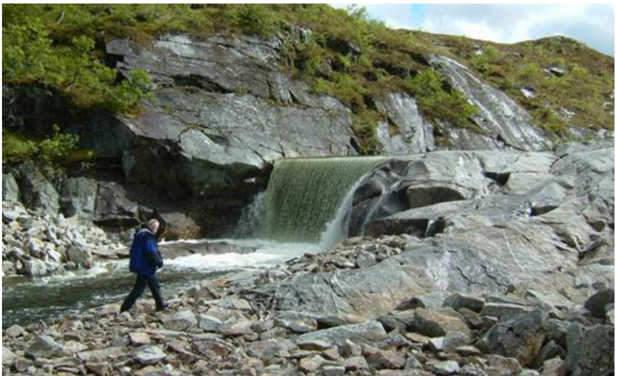
Figur 4. Dam Nervatnet som etter planen skal fjernes.