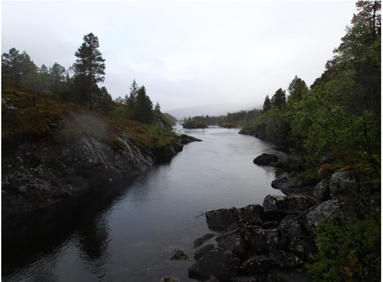
Figur 3 Damsted ved Storsteinan. Eksisterende demning i Nervatnet ses øverst på bildet.