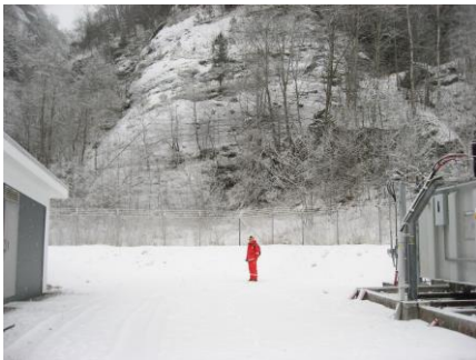
Figur 1. Foreslått plassering 30 MVA trafo

Ny 30 MVA, 132/22 kV transformator anskaffes og installeres. Plassering ny trafocelle foreslås mellom eksisterende 10 MVA trafo og kontrollhus.