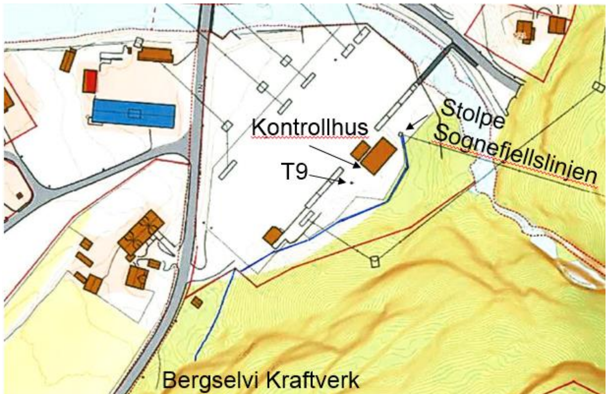
Figur 3 Kartutsnitt som viser Fortun stasjon med plassering av T9 inkludert 22 kV kabel (blå linje) fra Bergselvi kraftverk som ikke er en del av denne søknaden.