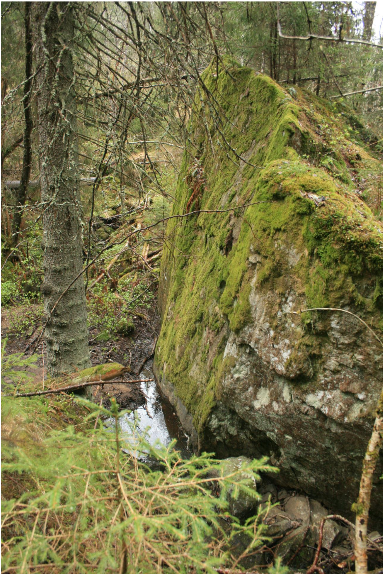
Foto 32. Bekken snor seg forbi kampestein mellom Stampetjernet og Lundertjernet (Erath, mai 2017).