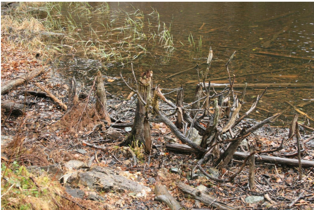
Foto 11. Tørrlagt sone etter senking av overløp. Gamle stubber stikker opp (Erath, mai 2017).