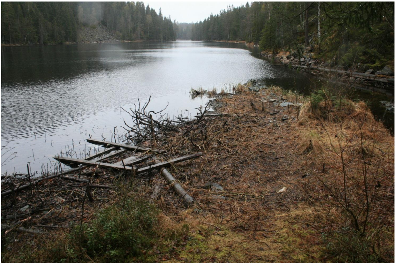
Foto 9. Tørrlagt sone etter senking av overløp (Erath, mai 2017).