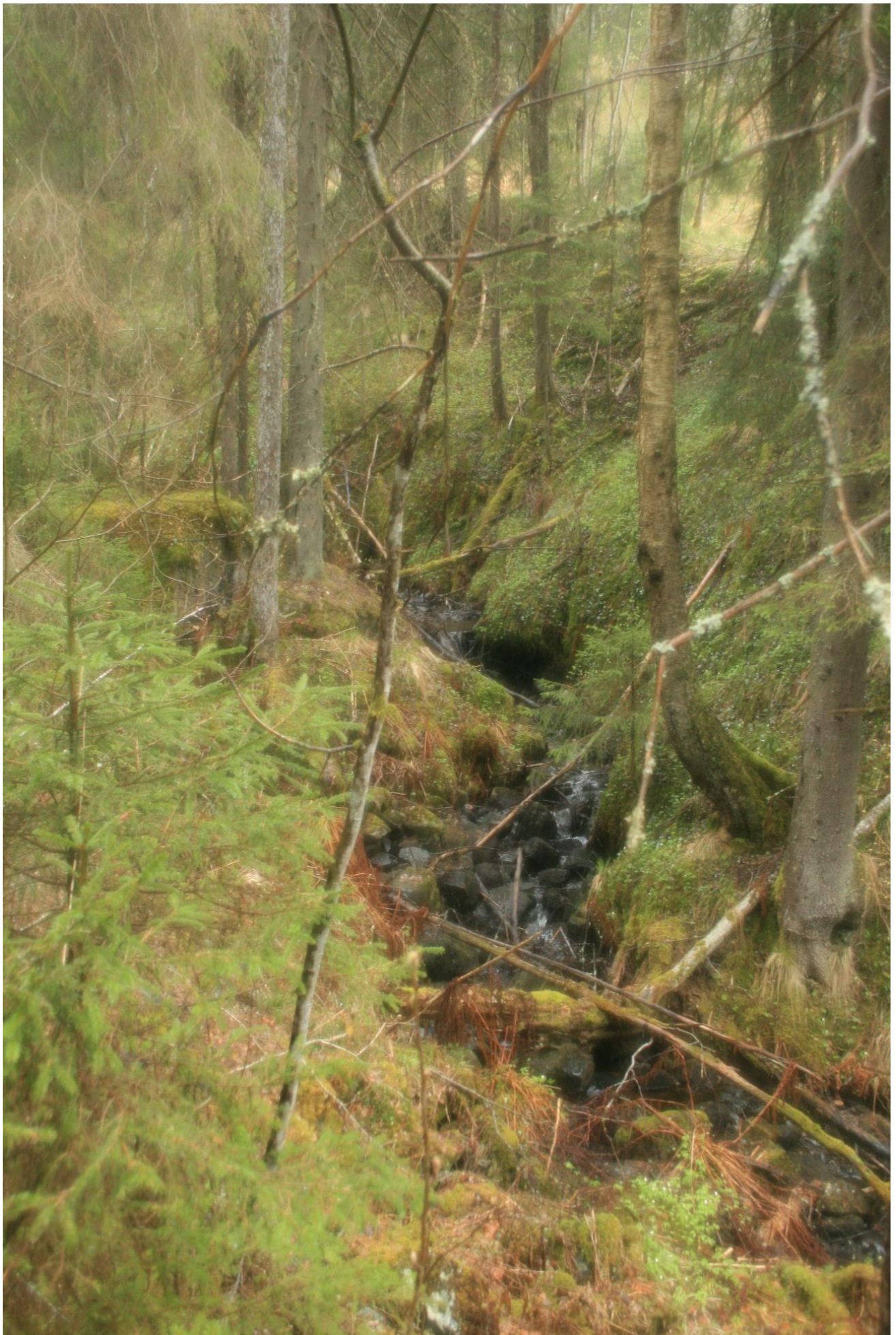
Foto 33. Bekk mellom Lundertjern og Stampetjern (Erath, mai 2017).