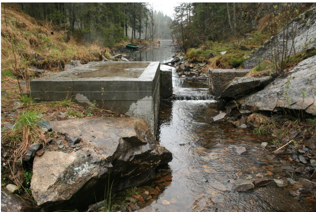
Foto 21. Like nedstrøms dammen mot det som antas å være en kunstig kanal inn mot Lundertjernet. Inntaksledning antas å ligge i forbindelse med denne kanalen (Erath, mai 2017).