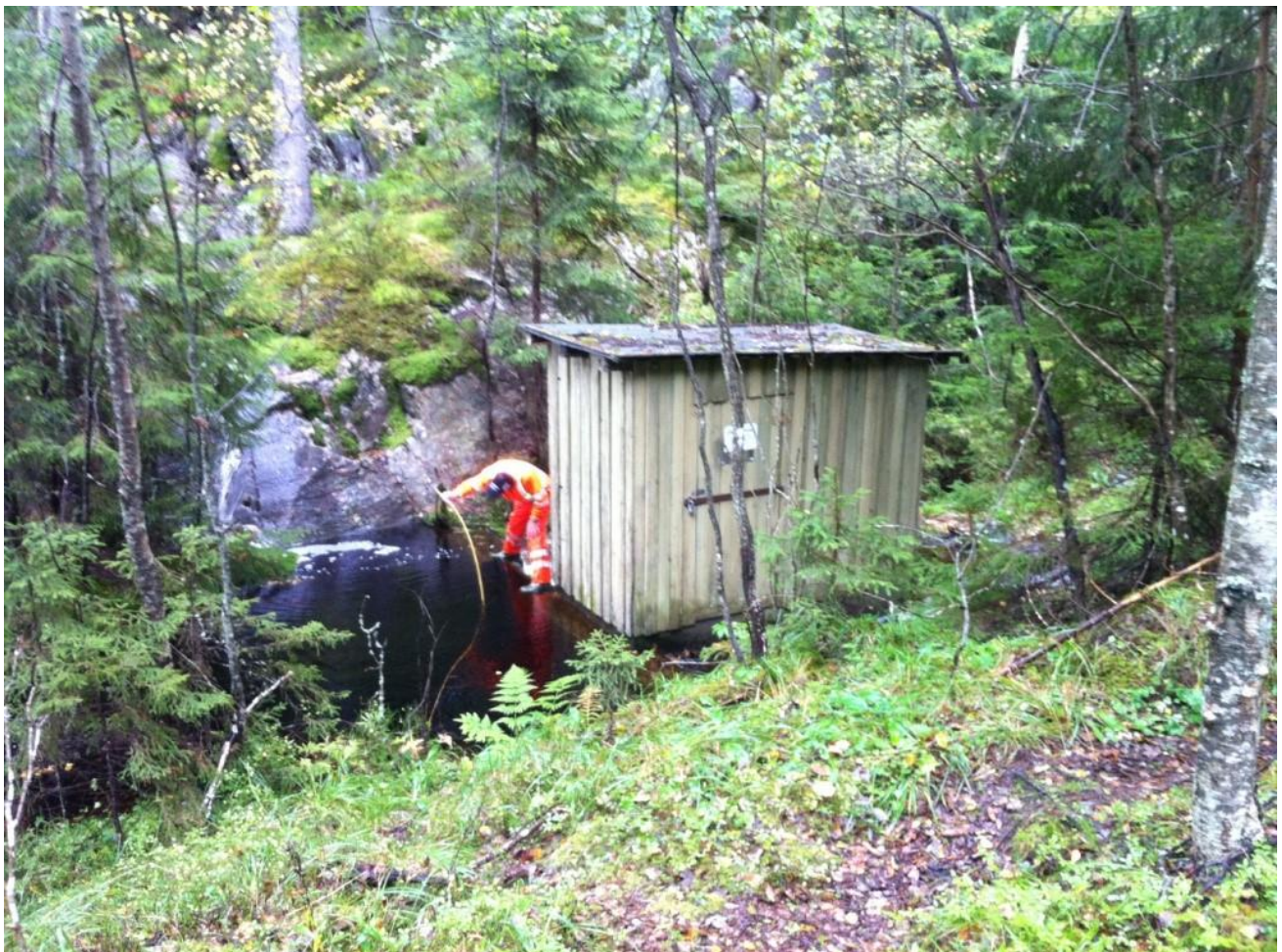
Foto 23. Situasjonen ved dammen i 2011 før senking av vannstand og gjenstøping av kum (Vassbygg).