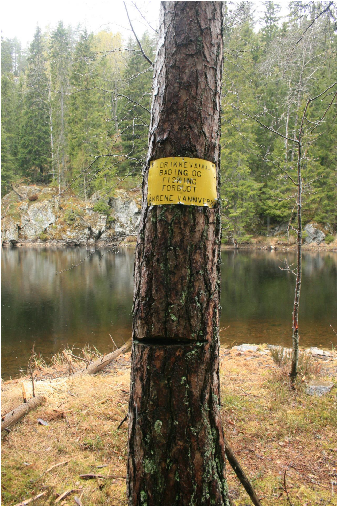
Foto 15. Utdatert drikkevannsskilt informerer fortsatt om restriksjoner ved vannets østside (Erath, mai 2017).