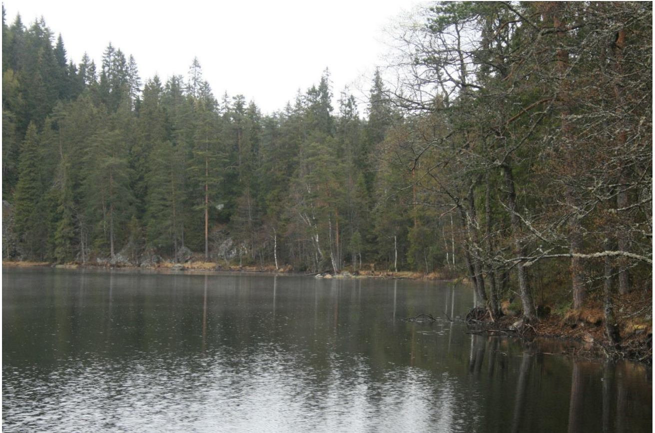
Foto 5. Hvit bu i nordende med ukjent funksjon (Erath, mai 2017).