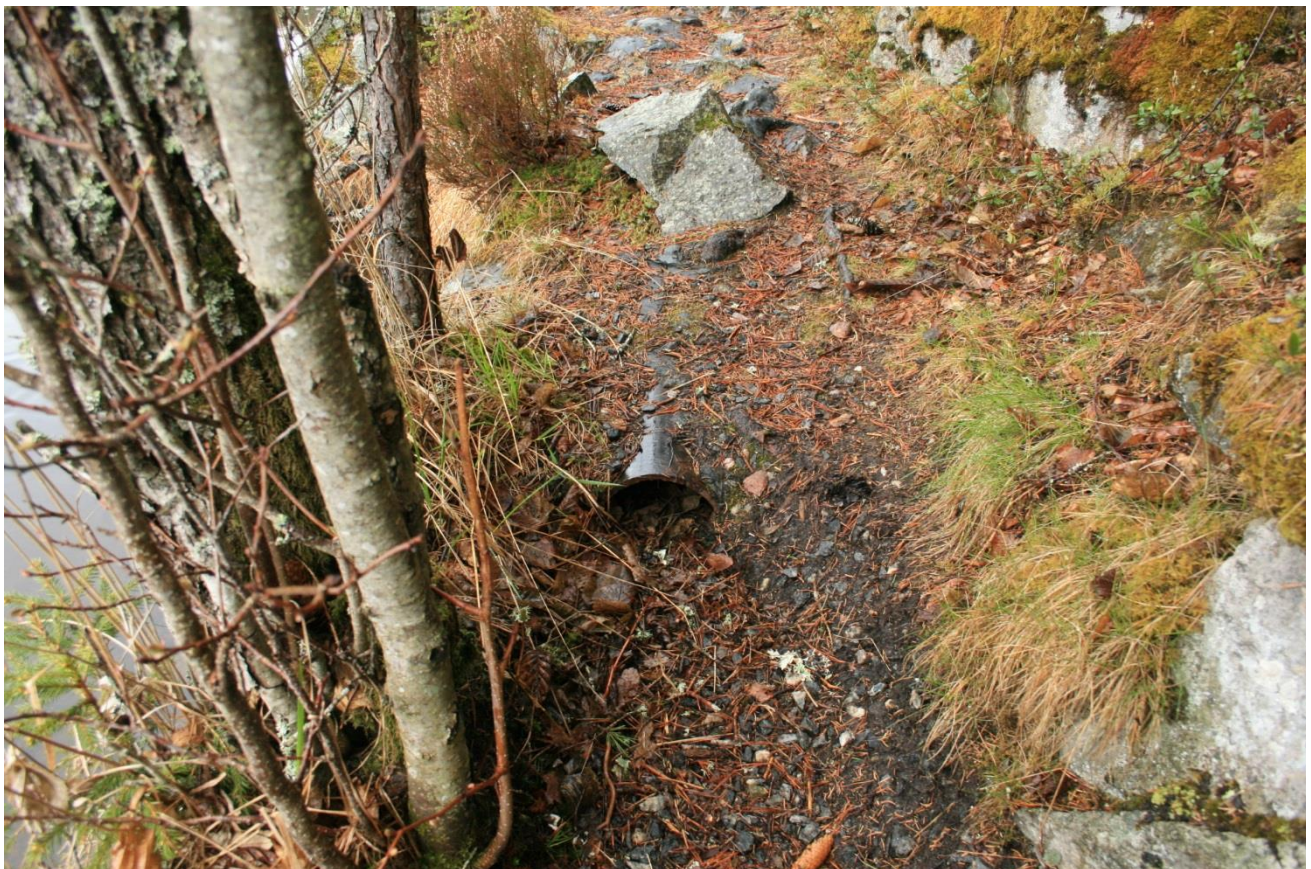
Foto 35. Rør ved Stampetjerns østside. Antas å stamme fra anlegg i Lundertjern. Mye av røranlegget langs Stampetjernet er allerede fjernet (Erath, mai 2017).