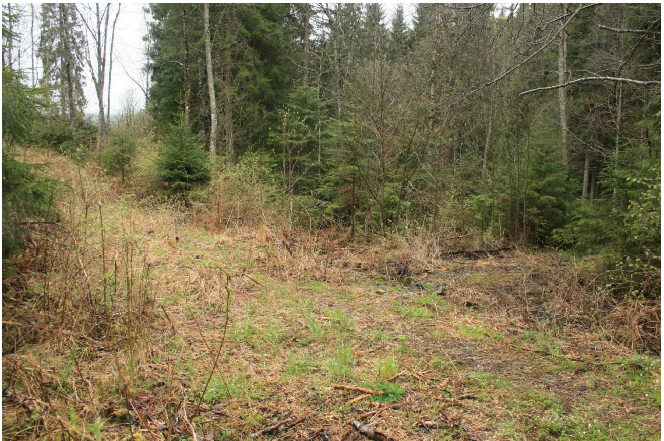
Foto 41. Traktorveikryss sett med Lundertjernet i ryggen. Mot Stampetjern til høyre. Fra venstre antas veien å kunne benyttes som anleggsvei (Erath, mai 2017).