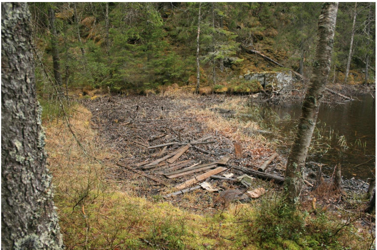
Foto 10. Tørrlagt sone etter senking av overløp (Erath, mai 2017).