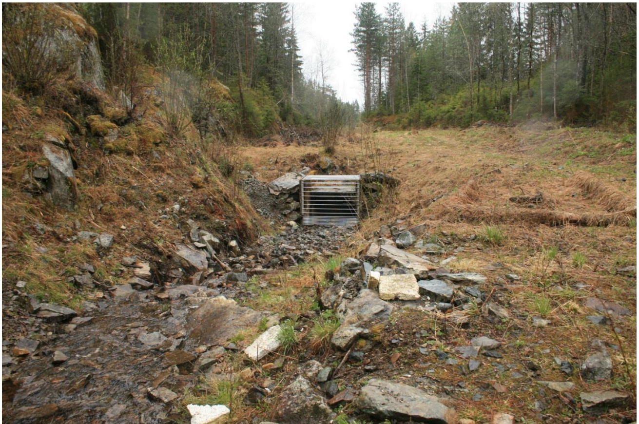
Foto 28. Området mellom dam og kulvert fremstår som mindre estetisk grunnet avskoging, rensking av bekkefar, fyllmasser, sliten dam, kulvert og gjenstøpt ventilhus. Bål- og sitteplass er allikevel etablert i området (skimtes under vissne vegetasjon). Fungerende drikkevannsledning fra ... til ... krysser over kulvert, like nedstrøms dammen. (Erath, mai 2017).