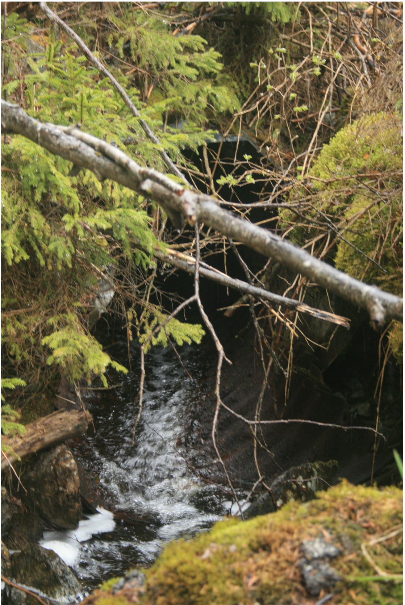
Foto 31. Utløp av samme rørkulvert, like nedstrøms dam (Erath, mai 2017).