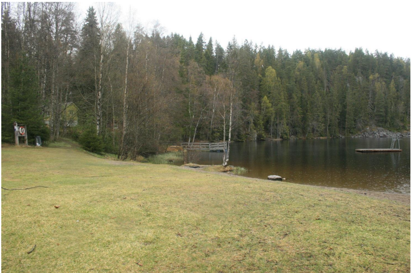
Foto 38. Badeplass ved utfartsparkering Stampetjern (Erath, mai 2017).