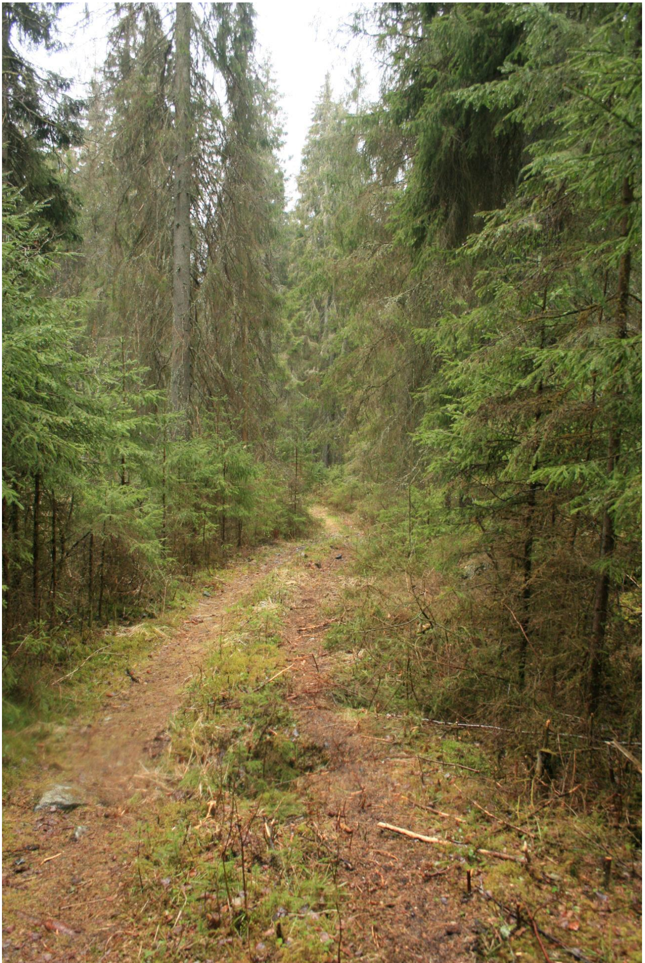
Foto 40. Turvei mellom Stampetjernet og Lundertjernet (Erath, mai 2017).