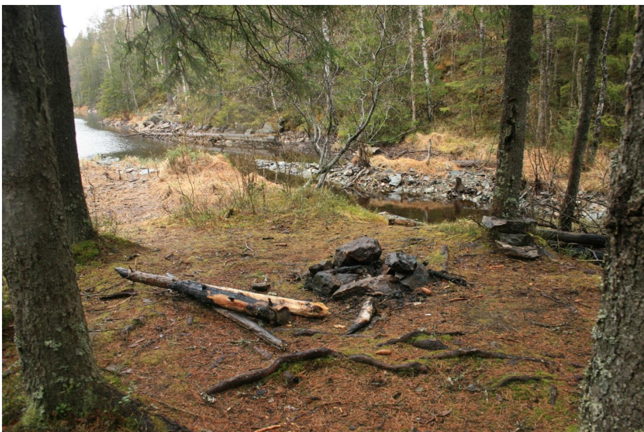
Foto 12. Bål plass i sørenden. Utløp, trolig kanalisert, i bakgrunnen (Erath, mai 2017).