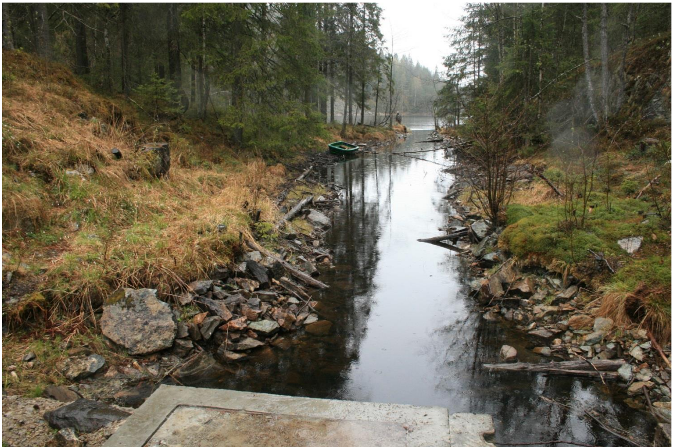
Foto 24. Fra utløp av Lundertjernet mot tjernet. Antatt kanalisering (Erath, mai 2017).