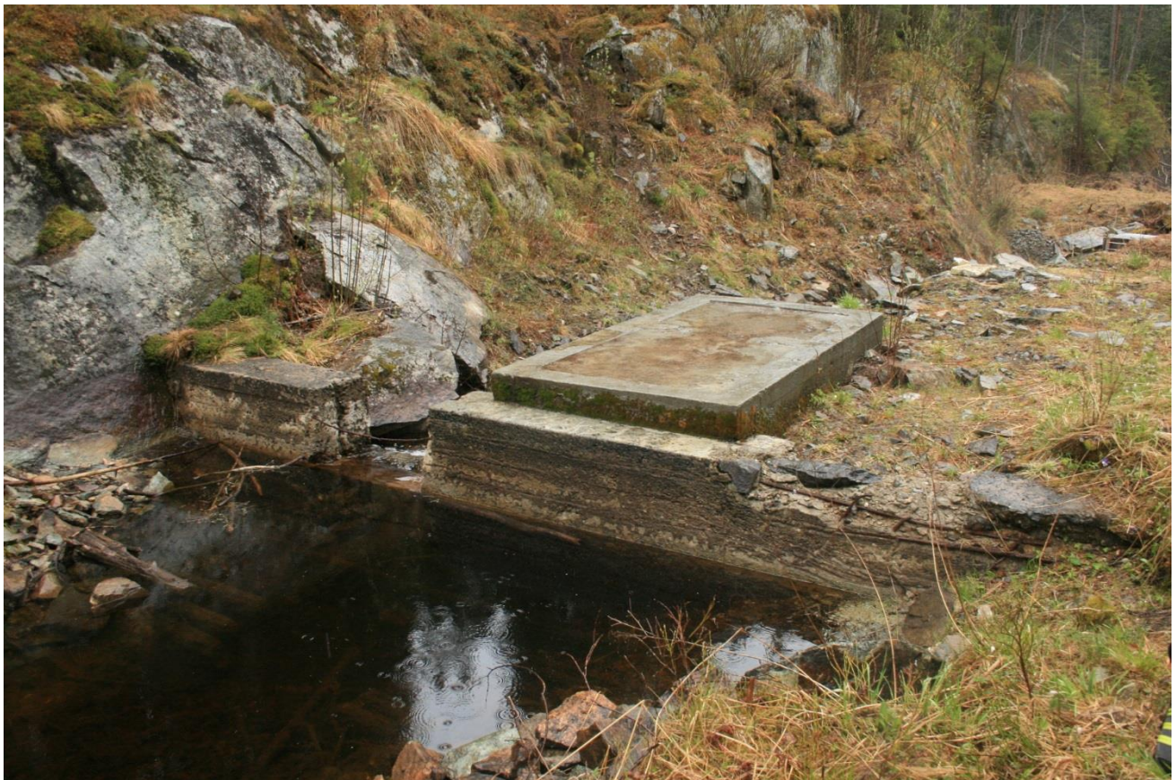
Foto 22. Gjenstøpt ventilikum. Senket damoverløp (Erath, mai 2017).