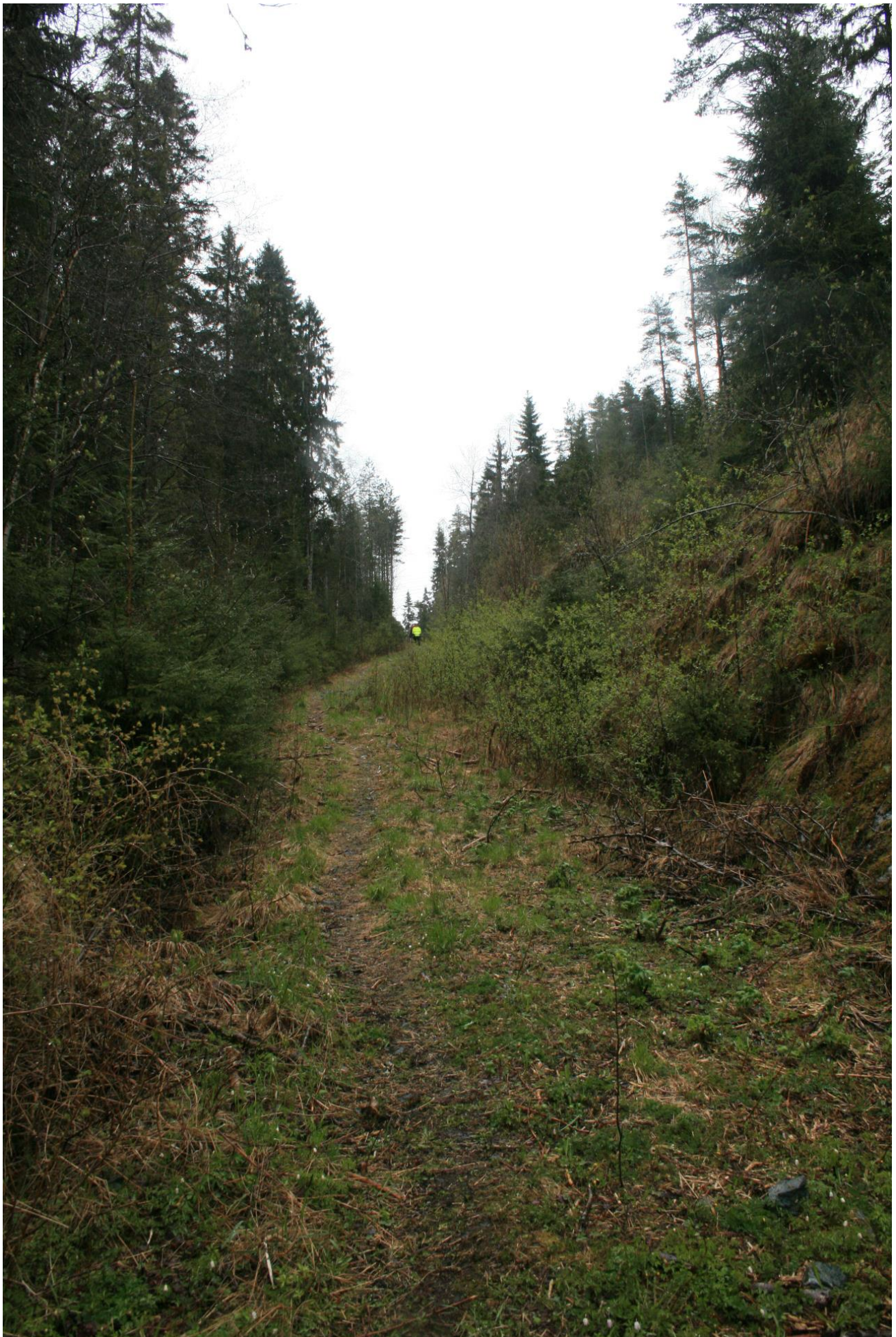
Foto 42. Traktorvei mot Lundertjernet. Antas å kunne benyttes som anleggsvei (Erath, mai 2017).