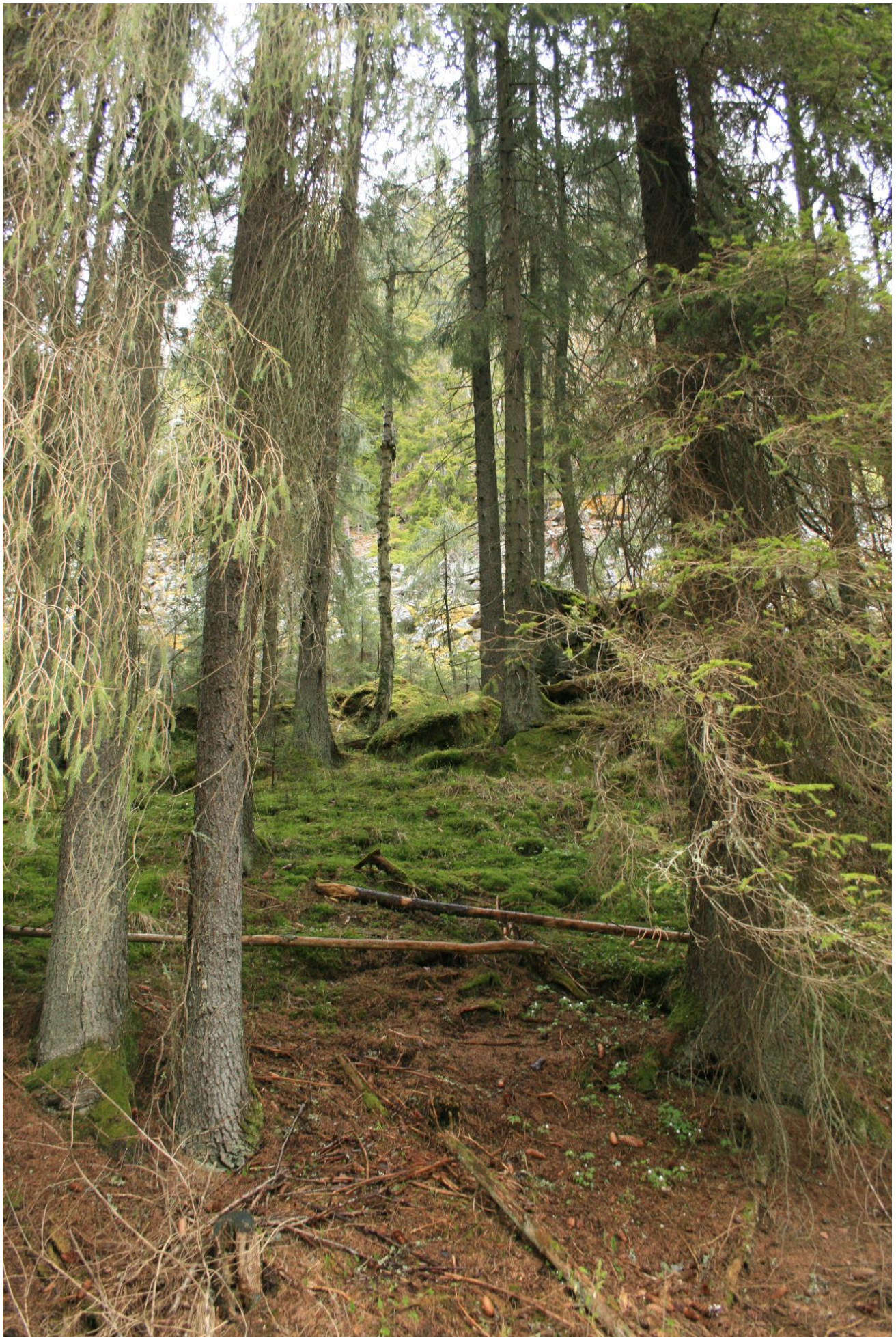
Foto 43. Bratte sider opp mot Lundertjern og mot bygdeborg på Farshatten, som ligger på vestsiden av Lundertjern (Erath, mai 2017).