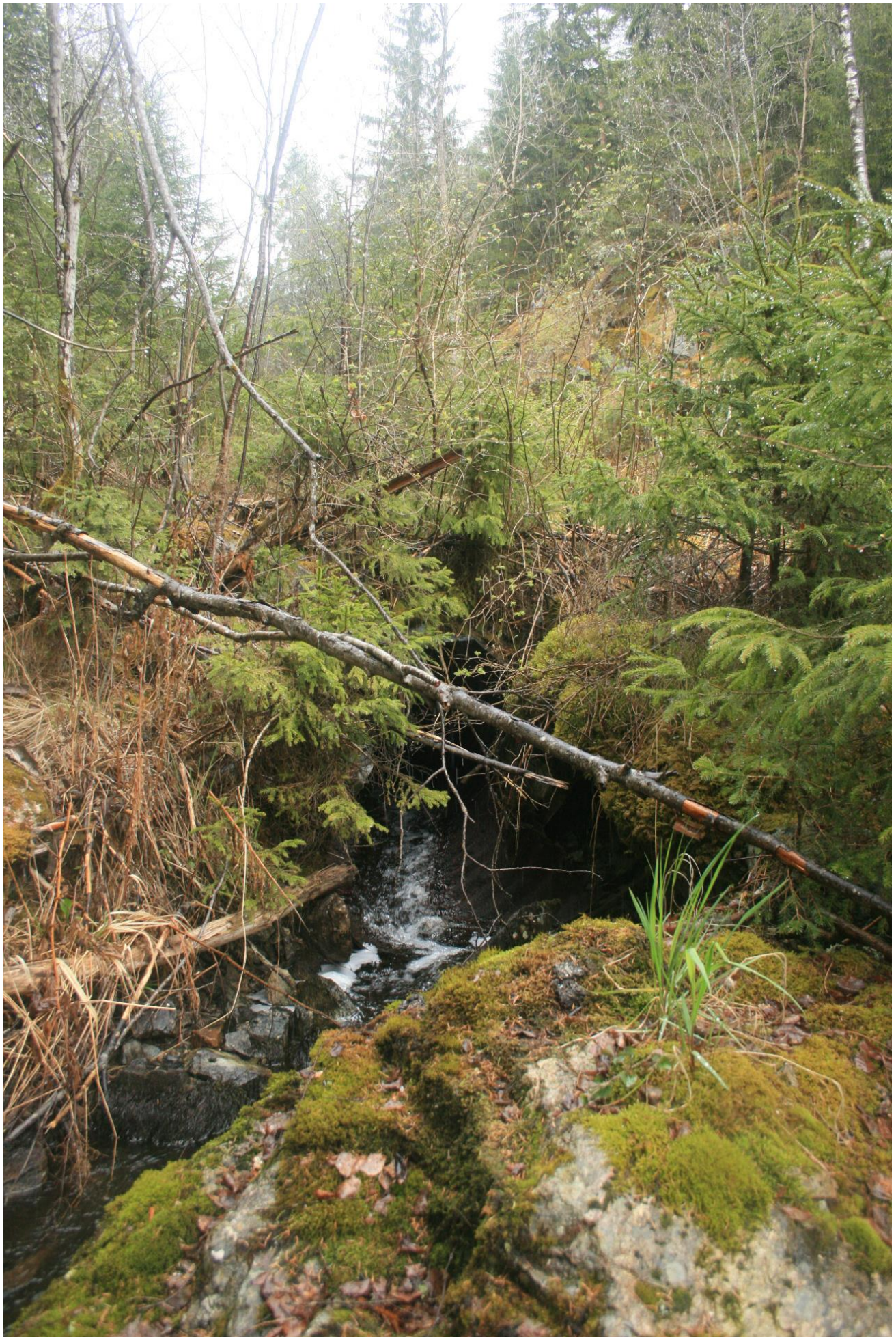
Foto 30. Utløp av rørkulvert nedstrøms dam. Rør skimtes i sentrum av bildet (Erath, mai 2017).