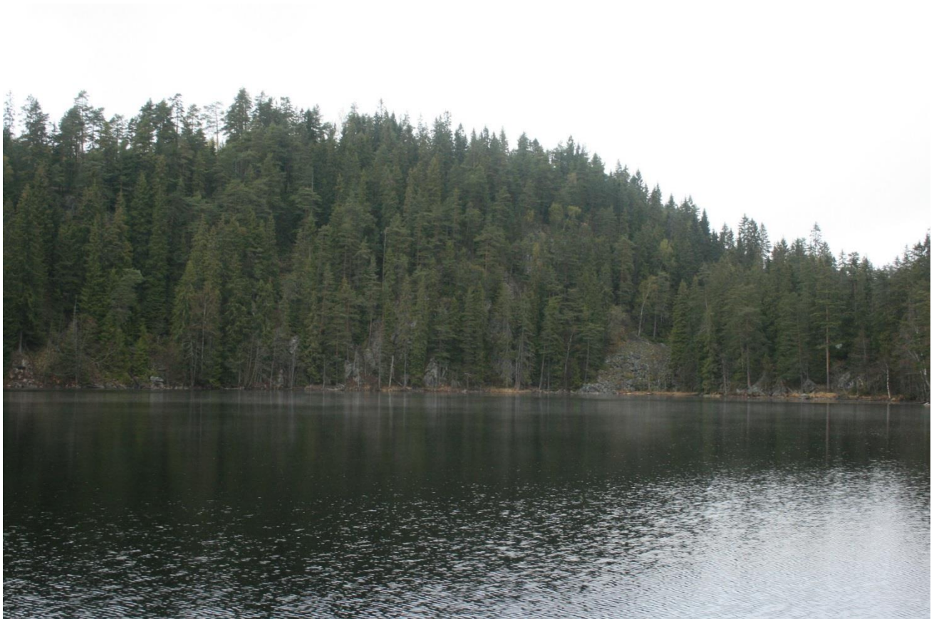
Foto 4. Nordende. Det har ligget en pumpe i området. Den har pumpet vann mot Lunderåsdammen. Pumpen ble fjernet i xxxx, men det er ukjent om rørene er blitt liggende (Erath, mai 2017).