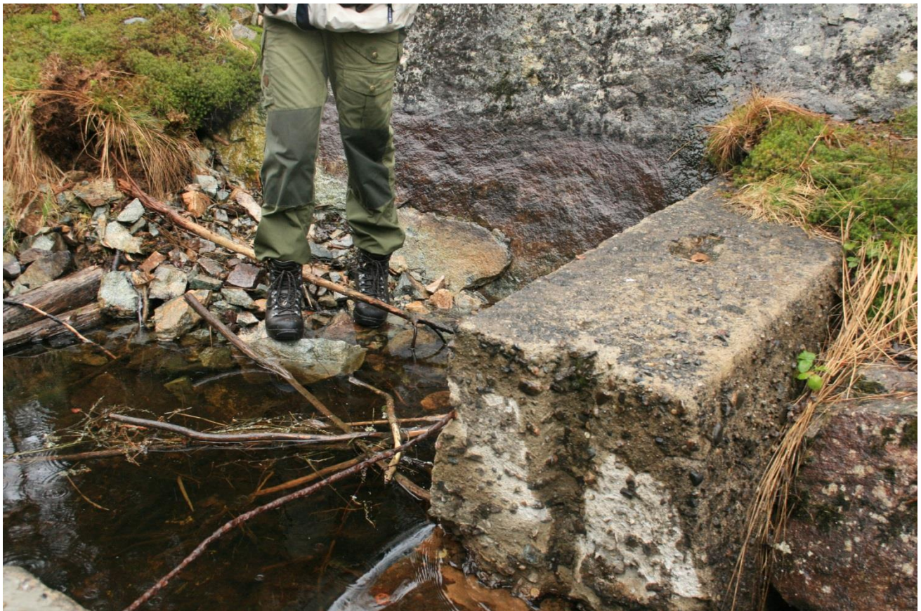
Foto 26. Vannstandsmerker på berget viser at vannstanden allerede er senket ca. halv en meter. Fjerning av dammen vil senke den ytterligere (Erath, mai 2017).