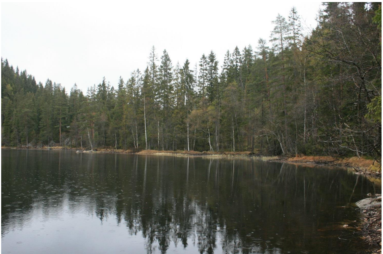
Foto 8. Nordøstende. Hvit bu med ukjent funksjon (Erath, mai 2017).