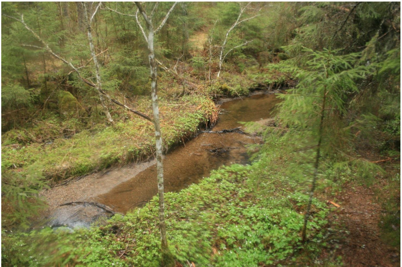
Foto 34. Bekk mellom Lundertjern og Stampetjern (Erath, mai 2017).