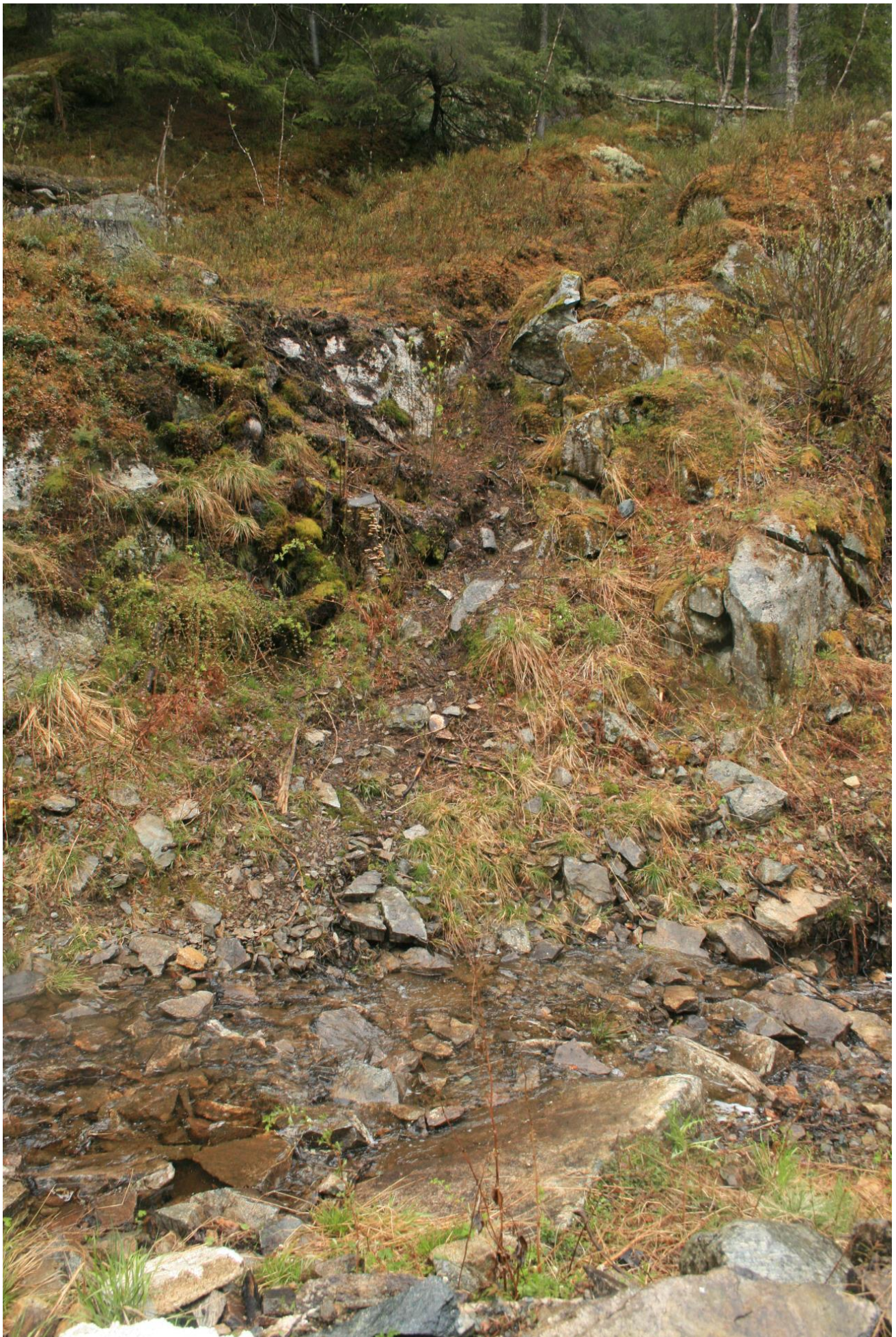
Foto 27. Sti langs vannets østside starter ved å krysse utløpet (Erath, mai 2017).