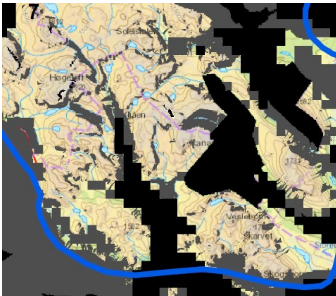
Figur 1. Analyseområda i Hemsedal kommune etter harde og mjuke eksklusjonar.

konflikt med kommunen sin utbyggingspolitikk siste 20-30 år der nettopp «Nordfjella» skal vere urørt, som ein «kompensasjon» ifht den tyngre reiselivsutbygging omkring Hemsedal Skiheisen/ Fjellandsbyen, sør for RV52.