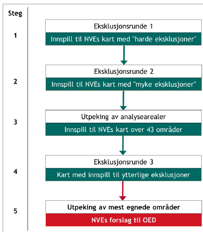
Figur 1: "Nasjonal ramme" i 5 steg. Miljødirektoratets bidrag i grønt. NVE har et helt selvstendig ansvar for siste ledd. Arbeidet med kunnskapsgrunnlaget kommer i tillegg til oppgavene i figuren.

Arbeidet med utpeking av egnede områder har skjedd gjennom fem steg (jfr. Figur 1) Det startet med eksklusjon av områder som ble vurdert som "ikke egnet" (steg 1+2). Deretter ble det det pekt ut 43 analyseområder i steg 3 ut fra en grov vurdering av produksjonspotensial, kraftnett og de nevnte eksklusjonene (2).