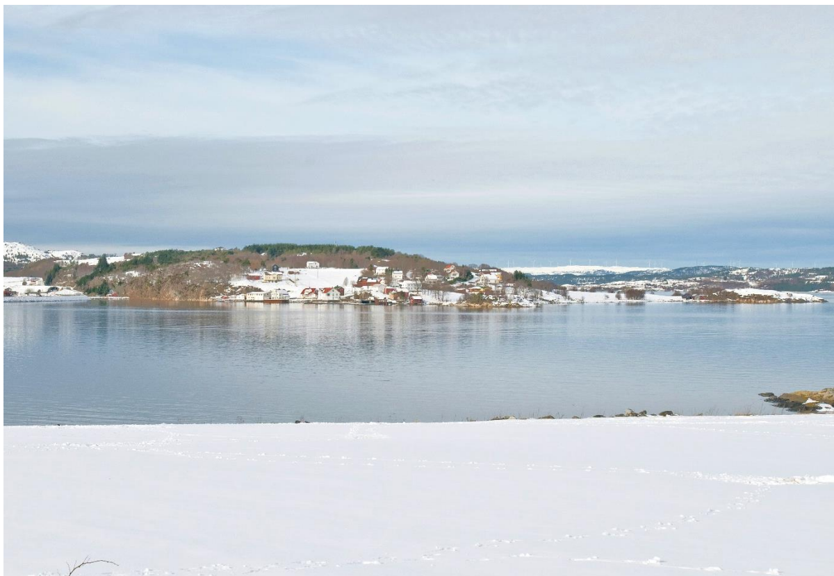
Figur 2: Hitra vindpark sett på 20 km avstand, og fotooptak med normalbrennvidde. Turbinene er bare fjerne elementer i bakgrunnen, og ikke lette å se selv med klarvær og god sikt.

Det er en stor fare ved å bruke for vide grensesett for visuell påvirkning, og det er at man risikerer å overbetone relativt beskjedne fjernvirkninger på bekostning av de mye viktigere nærvirkningene. Dette er fallgruver som har særlig betydning for vurdering av visuelle virkninger på naboskap. På et synlighetskart kan fjernvirkningene virke dramatiske når man bruker en felles fargesignatur for hele influensområdet, ettersom påvirket areal på kartet øker som en direkte funksjon av økt avstand fra vindkraftverket.