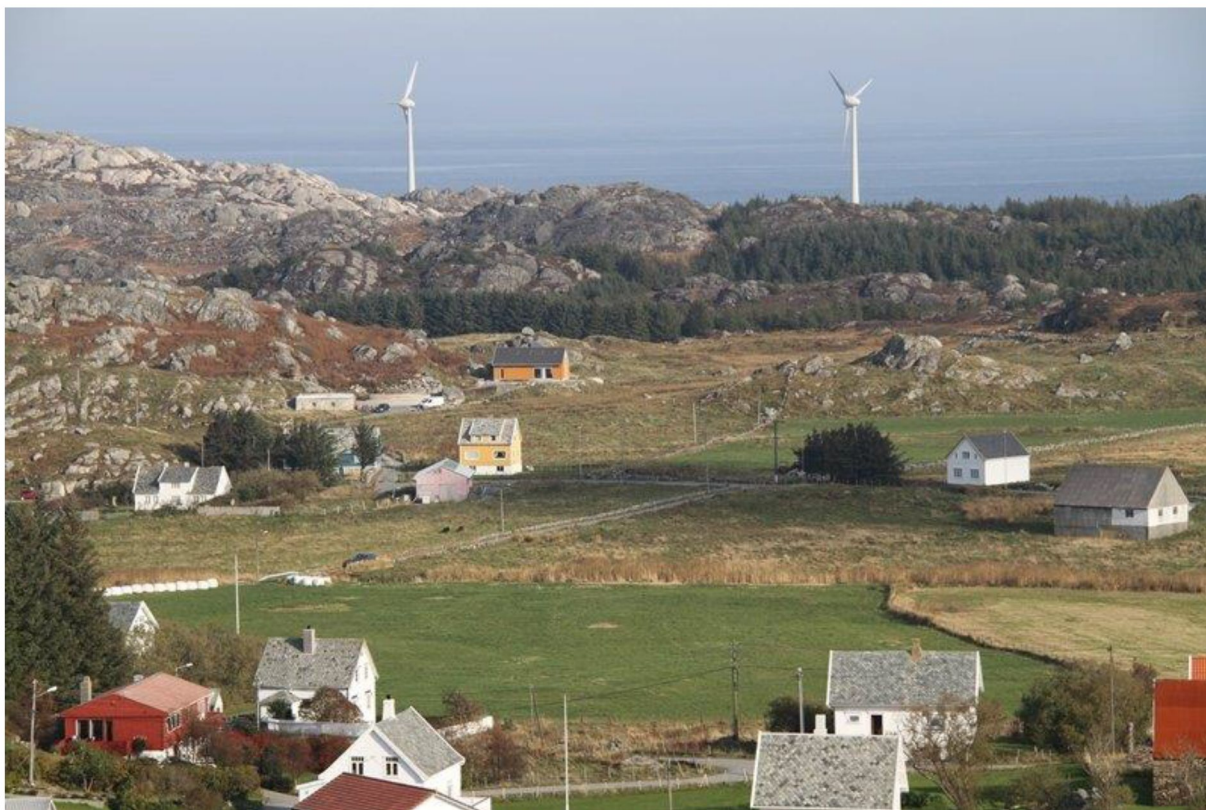
Figur 1: Utsira vindpark har bare to 600 kW turbiner, men preger likevel øya betydelig

Ettersom man dimensjonerer anleggene slik at de ikke danner vindskygge for hverandre – en tommelfingerregel tilsier en minimumsavstand rundt 6 -7 ganger rotordiameteren - vil arealinngrepet ha betydelig utstrekning. For en nær betrakter kan slike anlegg fylle mesteparten eller hele vidden på synsfeltet (3 turbiner på en rekke og med rotordiameter på eksempelvis 90 meter vil dekke et synlig felt i sideretningen på over en kilometer). Mennesket har et normalt sideveis synsfelt på nesten 180 grader, men innenfor dette synsfeltet er det bare det sentrale cirka 120 grader brede binokulære synsfeltet der man har dybdesyn og evne til å oppfatte detaljer. Derimot er det perifere synsfeltet spesielt egnet til å oppfatte bevegelse, slik at en turbin med sine roterende blader tilhører også det perifere oppmerksomhetsfeltet. Det skal altså ikke mange synlige turbiner til for å skape en blikkfangeeffekt over en bred synssektor.