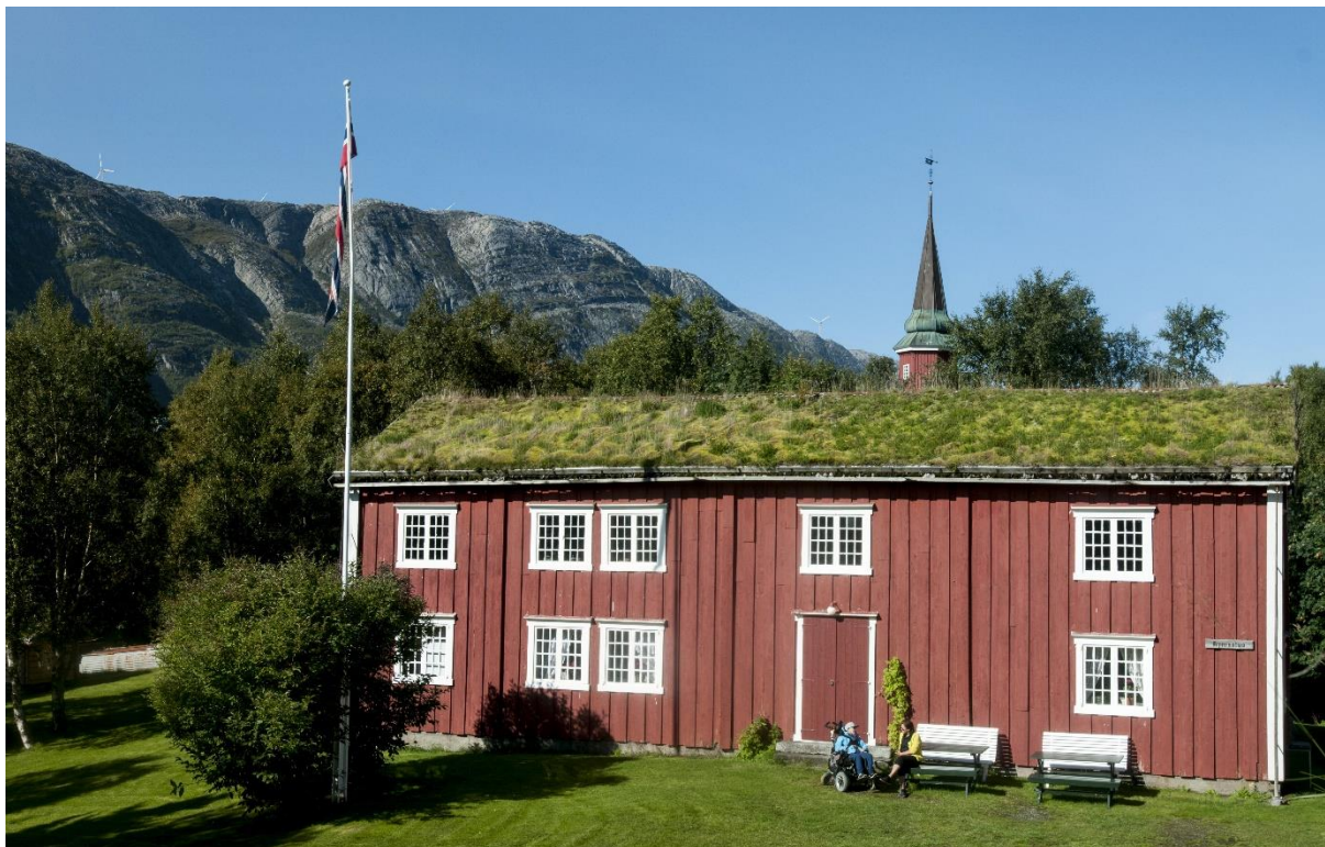
Figur 4: Øyfjellet vindpark sett fra Vefsn Bygdetun (fotomontasje). En turbin og et par små vingesveip er synlige.

avstanden fra byen til de nærmeste turbinene mange steder er mindre enn 2 kilometer. Vindparken er planlagt på et løftet fjellplatå høyt over bebyggelsen, og de fremste turbinene er trukket tilbake fra platåkanten. Se Figur 4 og Figur 5.