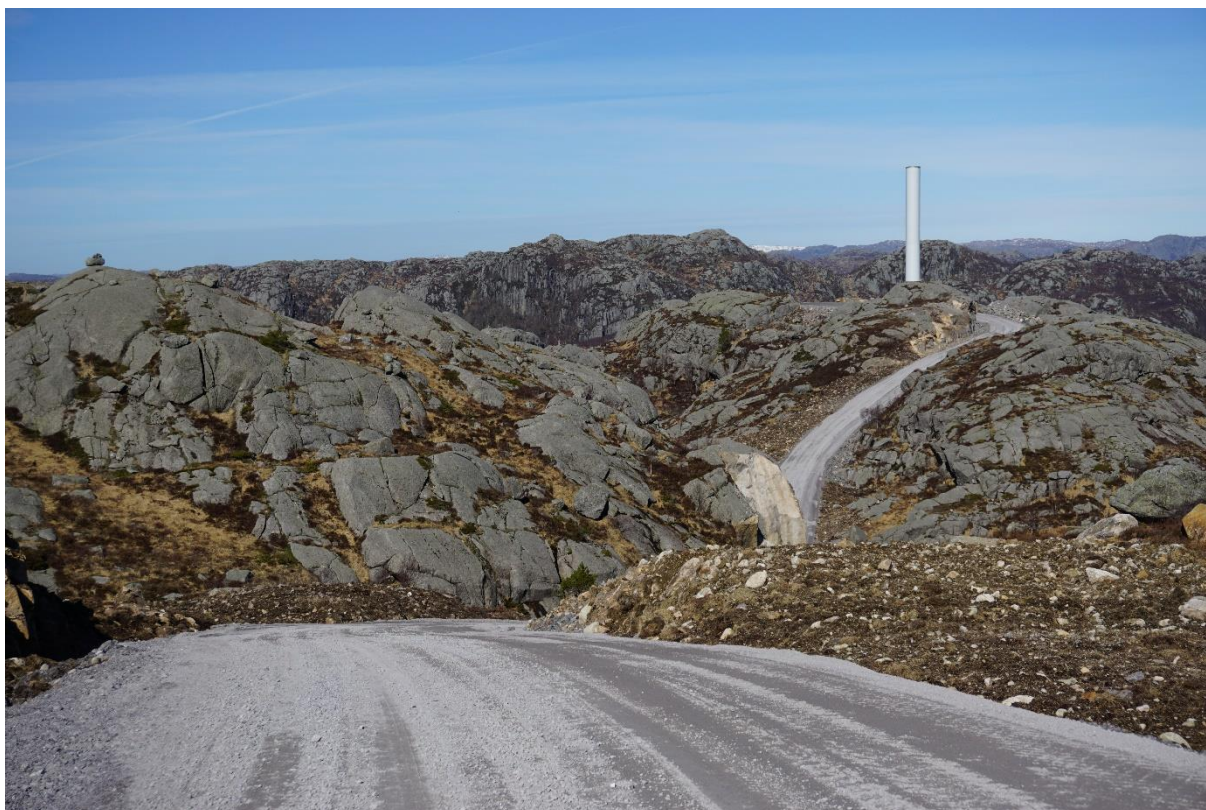
Figur 7: Tellenes vindpark under bygging. Den kuperte topografien gjør at man bare ser over korte avstander.

Noen landskap er så kuperte at man i nære områder knapt kan se turbiner. Det behøver ikke en gang være snakk om store høydeforskjeller så lenge de nære områdene gir innsynsskjerming. Tellenes vindpark på sørvestlandet er et eksempel på en vindpark hvor terrengformene gir en ekstrem grad av visuelle skjerming, men også på Ytre Vikna bidrar topografien for en stor del til at dette vindkraftverket gir beskjedne visuelle effekter på naboskapet.