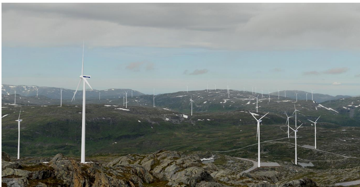
Figur 5: Deler av Øyfjellet vindpark sett fra fjellplatået (fotomontasje). Det er en skog av turbiner her, men ikke mye av dette er synlig fra bebyggelse.