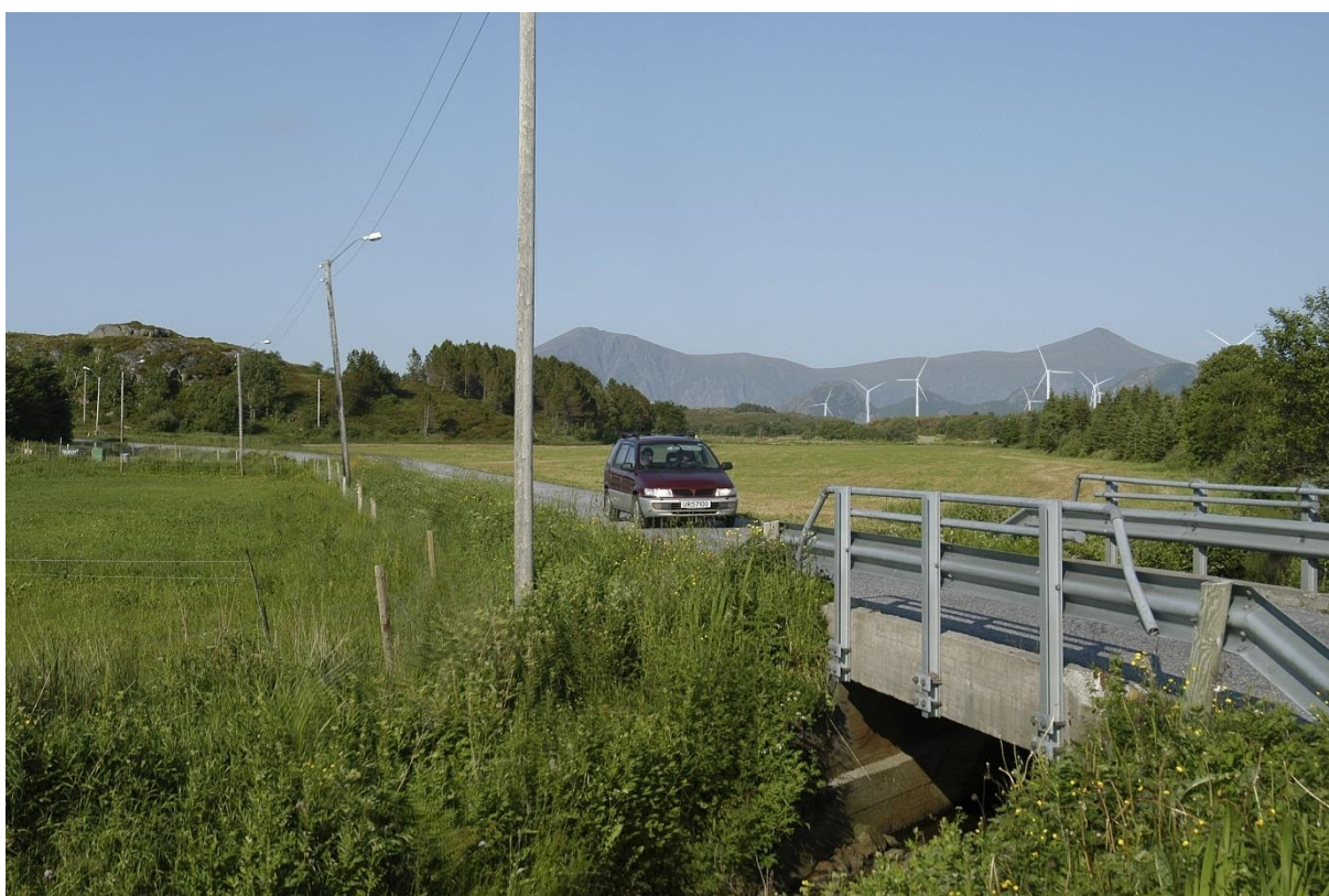
Figur 6: Fotomontasje av Fræna vindpark. Lokal topografi og vegetasjon bidrar til å skjerme innsyn mot mange turbiner på en gang, og turbinene er trukket tilbake fra strandsone-landskapet.

virksomheter større enn der vindparken så å si ligger i «baklandet». Typisk gjelder dette i et strandflatelandskap, der det naturlige utsynet er mot fjordarmer, skjærgård og åpen sjø, mens «baksiden» gjerne er en bakvegg av åser og fjell. Et eksempel fra konsesjonsbehandling av to norske vindkraftverk som lå like ved siden av hverandre kan illustrere dette: Mens Fræna vindpark var planlagt på landarealene bak den ytre kyststripen, men likevel tett på de steder der folk bor, var Havsul III offshore vindkraftverk plassert på de landnære grunnene ute i sjøen. Begge søknadene ble avslått, men det var i media og den lokale opinionen likevel betydelig mer støy rundt Havgul III enn Fræna. Den store forskjellen mellom de to prosjektene var at Havgul III fylte store deler av horisonten med turbiner utover det nære havområdet som var og er lokalbefolkningens hovedutsynsretning, mens turbinene i Fræna-prosjektet var plassert i større eller mindre grad i landet bak bebyggelsen, og dessuten dro nytte av at landformer og vegetasjon skjermet større og mindre deler av anlegget slik at det visuelt sett ikke ble så massivt.