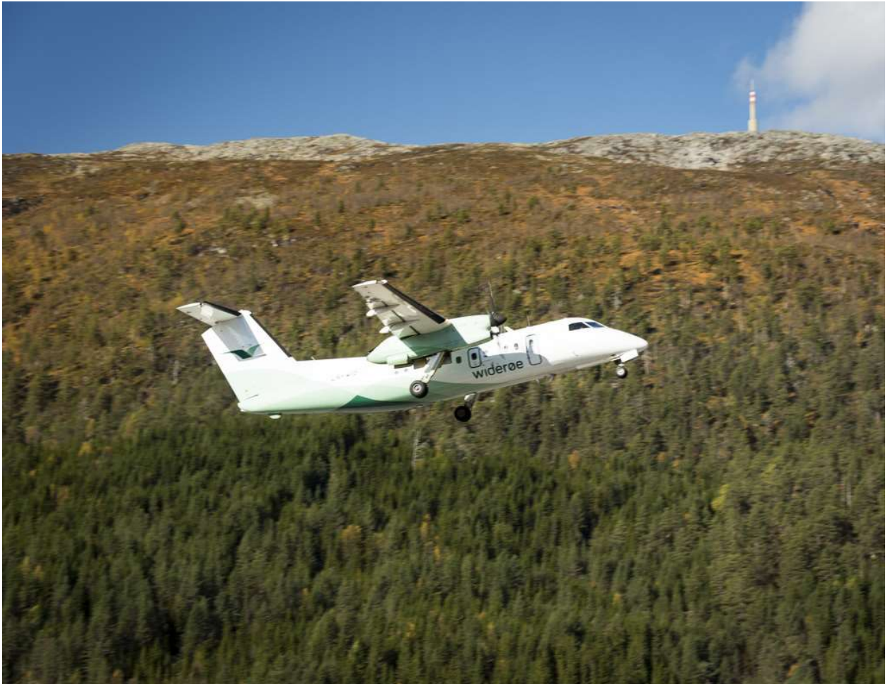
Figur 1. Utflyging ved Sogndal lufthavn.

gjøre egne analyser og operative vurderinger for hvert enkelt vindkraftprosjekt som lokaliseres i nærheten av flyplasser/landingsplasser.