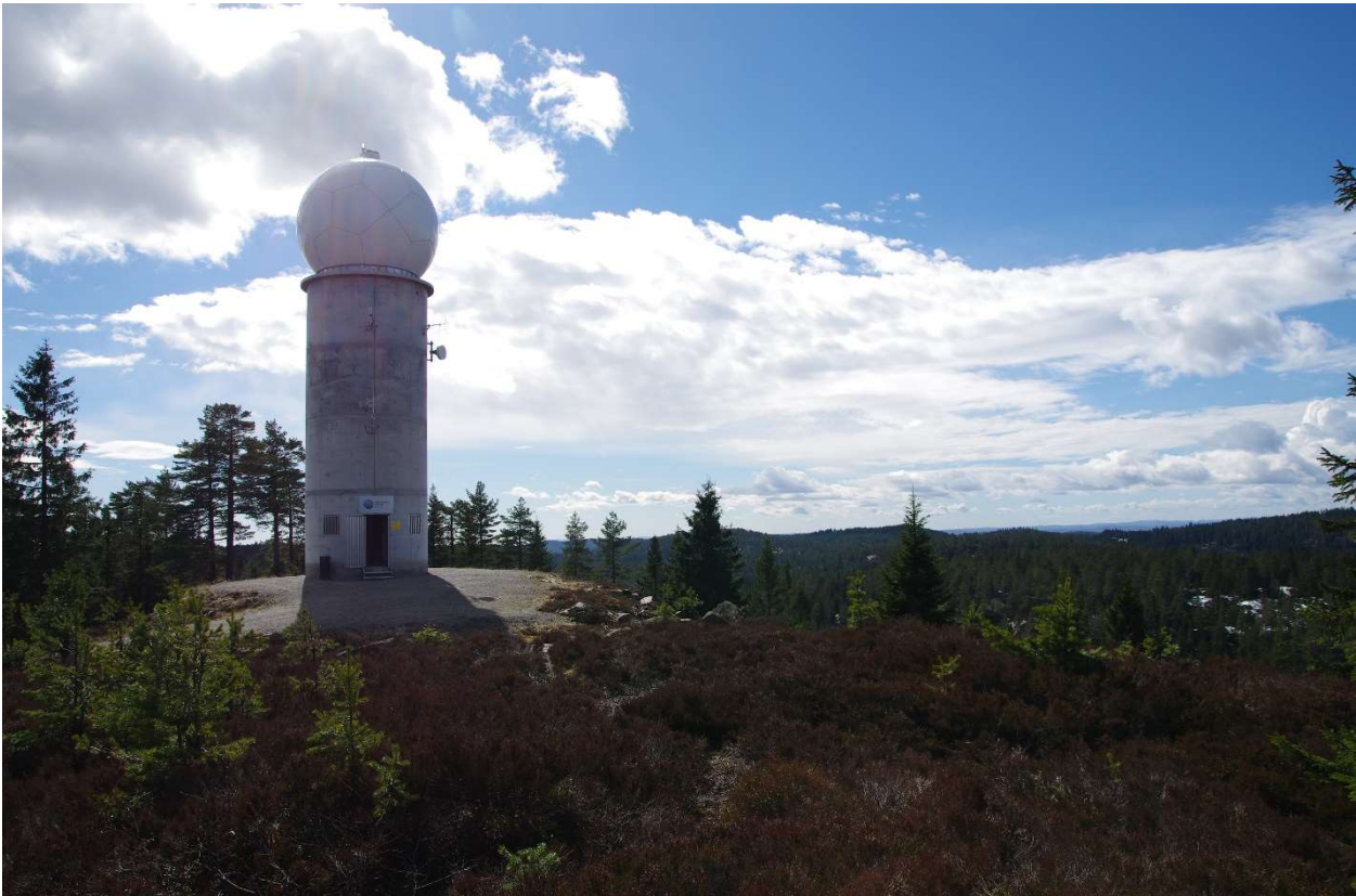
Figur 2. Værradaren på Hurum.

Vindkraftverk kan medføre virkninger på værradardataene, dersom vindturbinene lokaliseres slik at de forstyrrer radarsignalet. Signalforstyrrelser vil i ulik grad forringe kvaliteten på værobservasjonene og værtjenestene. Konsekvensene av dette vil variere med hensyn til formålet for, og mottaker av værtjenesten. I enkelte tilfeller kan det få konsekvenser også innenfor sikring av liv og verdier, for eksempel for flyværtjenesten hvor pålitelig værinformasjon er essensiell.