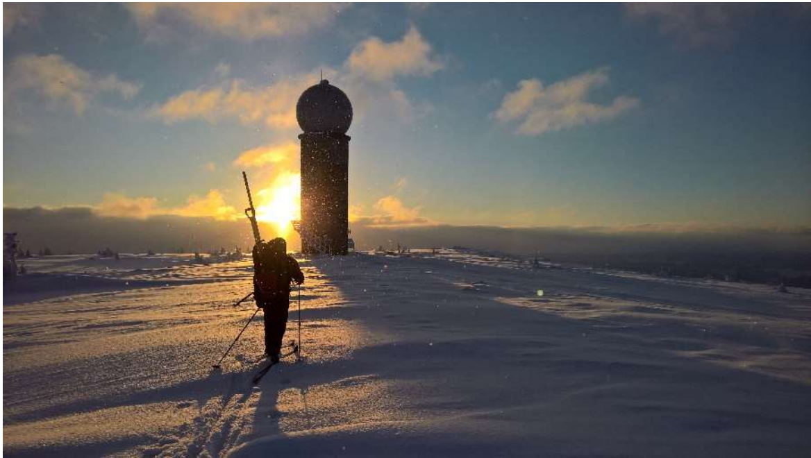
Figur 3. Værradaren på Hafjell.

Behovet for ny kunnskap er i stor grad knyttet til usikkerheter om betydningen av påvirkning fra vindturbiner for radarer, og det er til dels mangel på konsensus i fagmiljøet. Flere studier har blitt gjennomført for temaet, som har ført til en bedre forståelse hvordan virkningene kan bli redusert. Det vil kreve ekstra studier å redusere disse usikkerhetene.