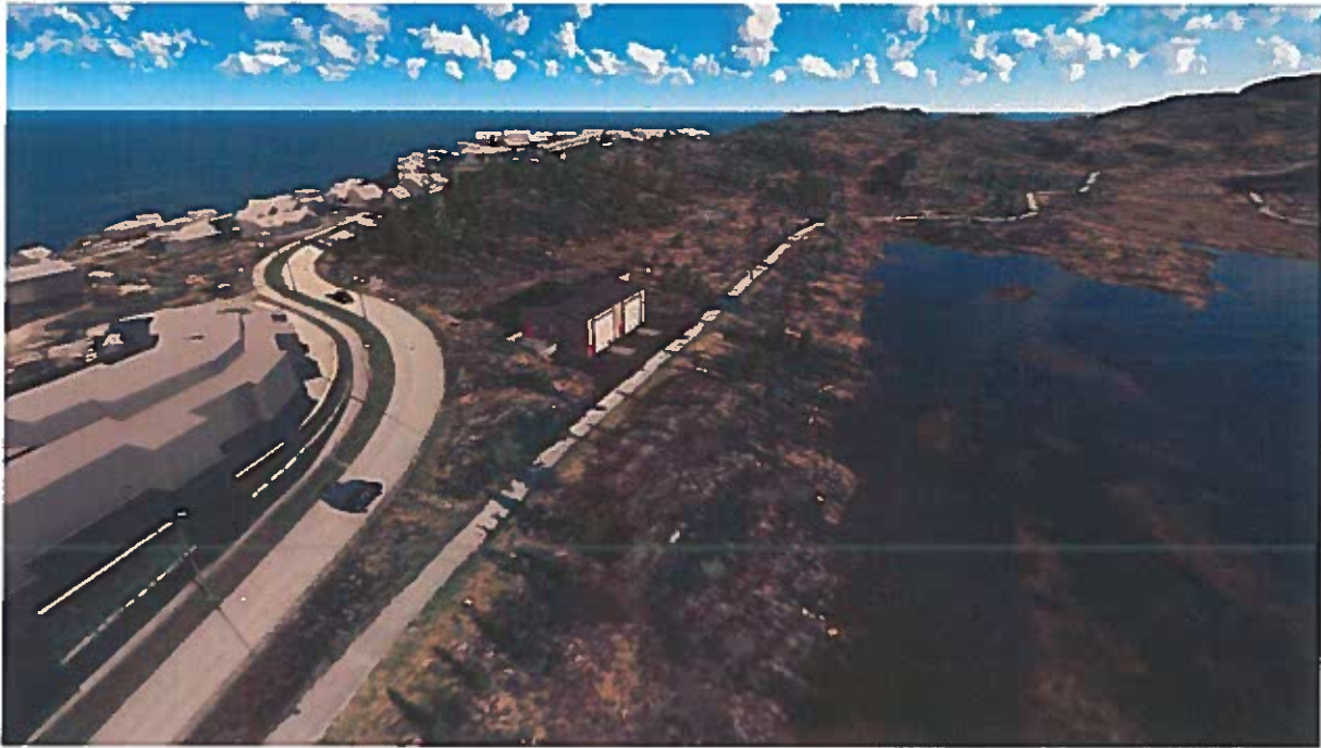
Figur 5. Samme plassering som på figur 4, men her sett i fugleperspektiv.