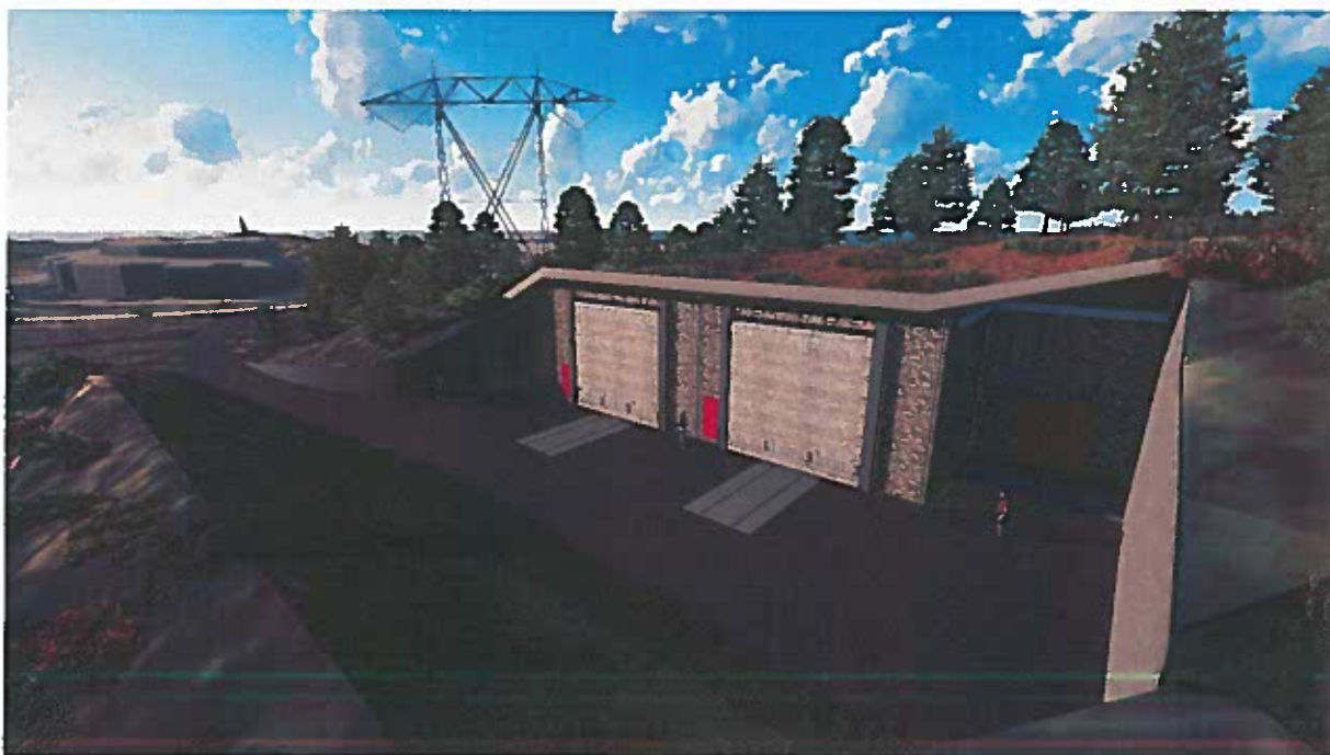
Figur 2. Samme plassering og utforming som på figur 1, men sett fra en annen side.