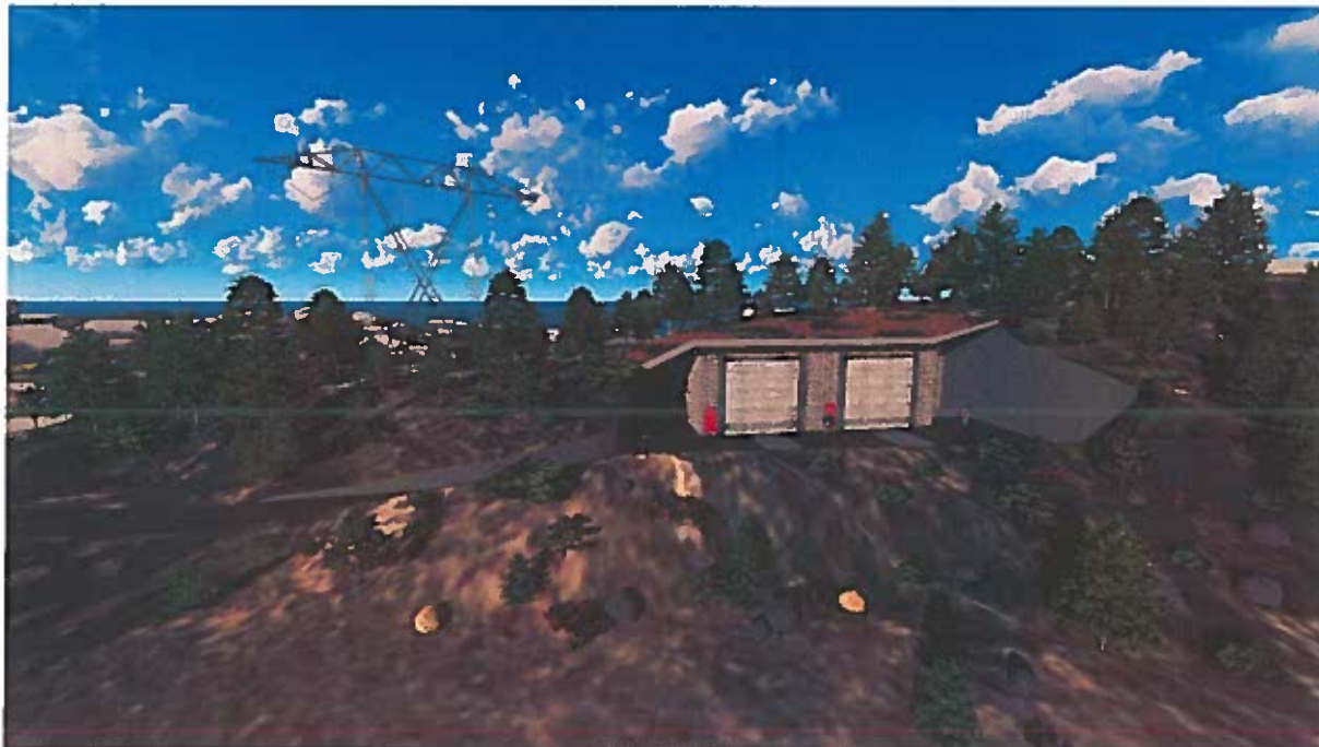
Figur 1. Tegning som viser mulig innplassering av transformatorstasjonen i terreng på BKK Netts prefererte lokasjon.