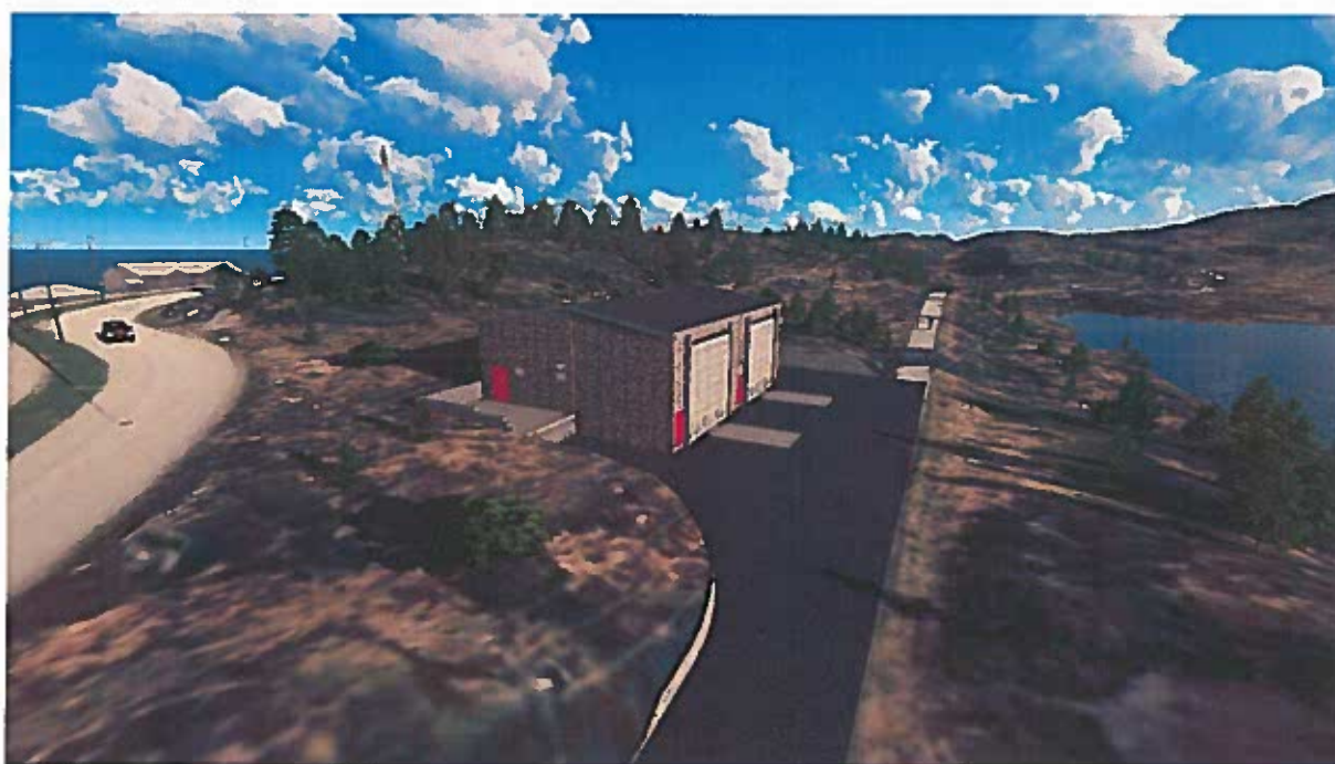
Figur 4. Transformatorstasjonen innplassert på areal benevnt o_BE2.