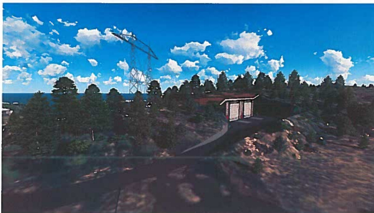
Figur 3. Samme plassering og utforming som på figur 1 og 2, men sett fra større avstand.