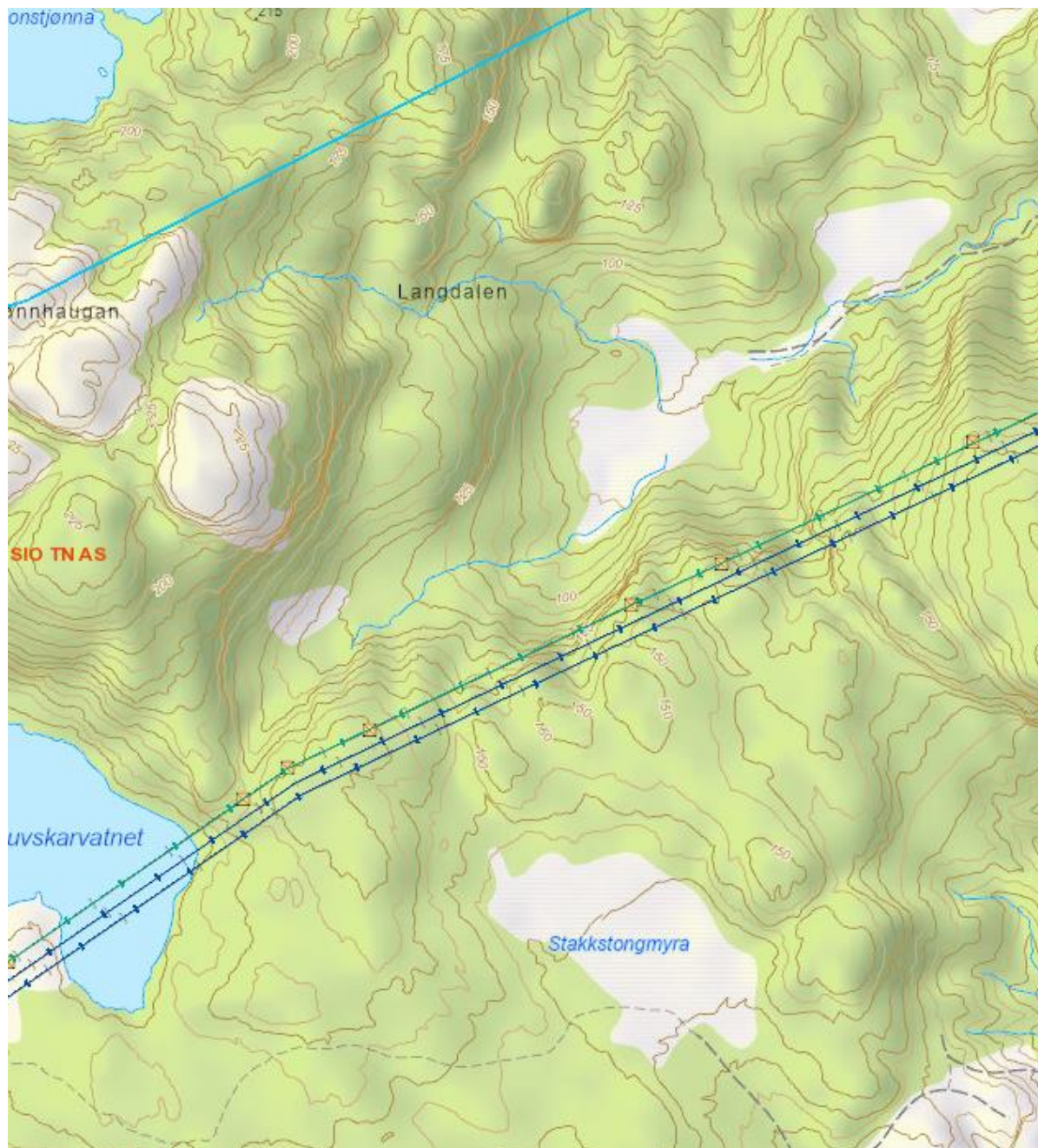
Kartet viser et område mellom kommunegrensen til Overhalla og Daltrøa

Stedsnavn gir også gode indikasjoner på hva slags naturtyper, arter eller fareområder man kan finne. Et eksempel er kartet under. Navnet Stakkstongmyra indikerer at denne myra er en slåttemyr. Stakkstong betyr trolig selve stakken der graset fra slåtten ble stablet.