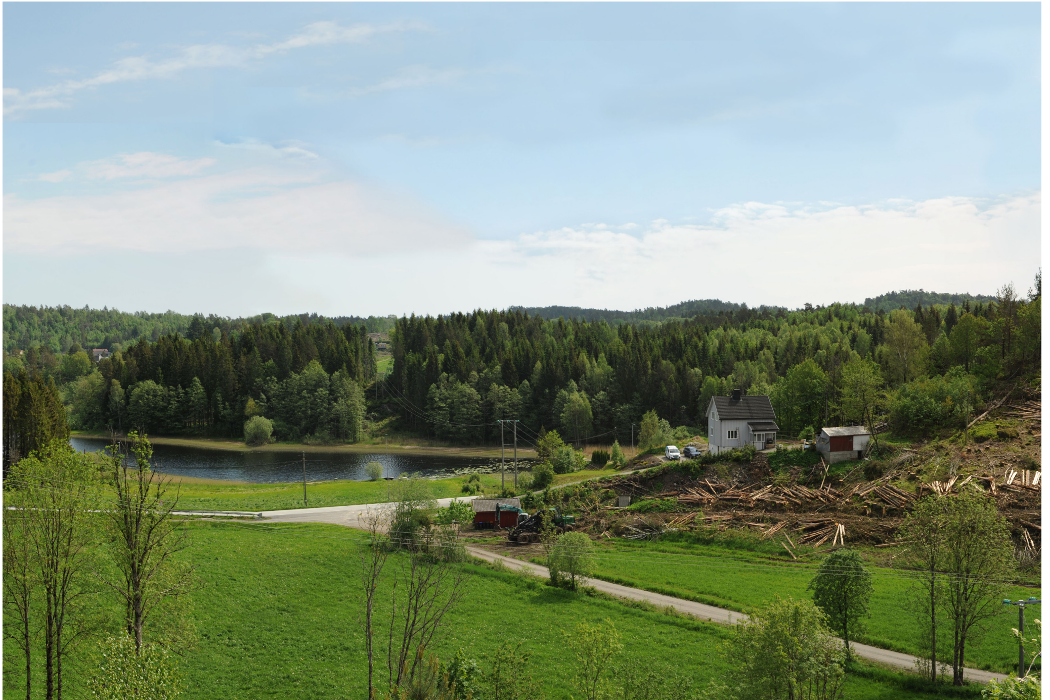
Brennvidde: 50 mm Dagens situasjon