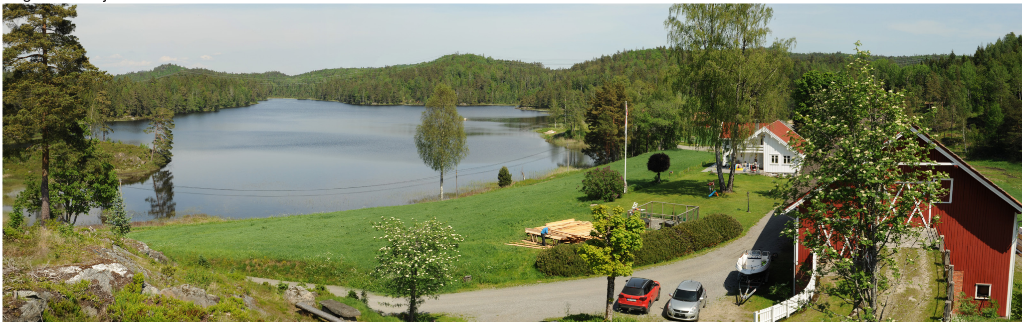
Ny situasjon med løsning 2 alt. 2.1 og 2.2

Panoramaet er satt sammen av 3 bilder med brennvidde: 50 mm