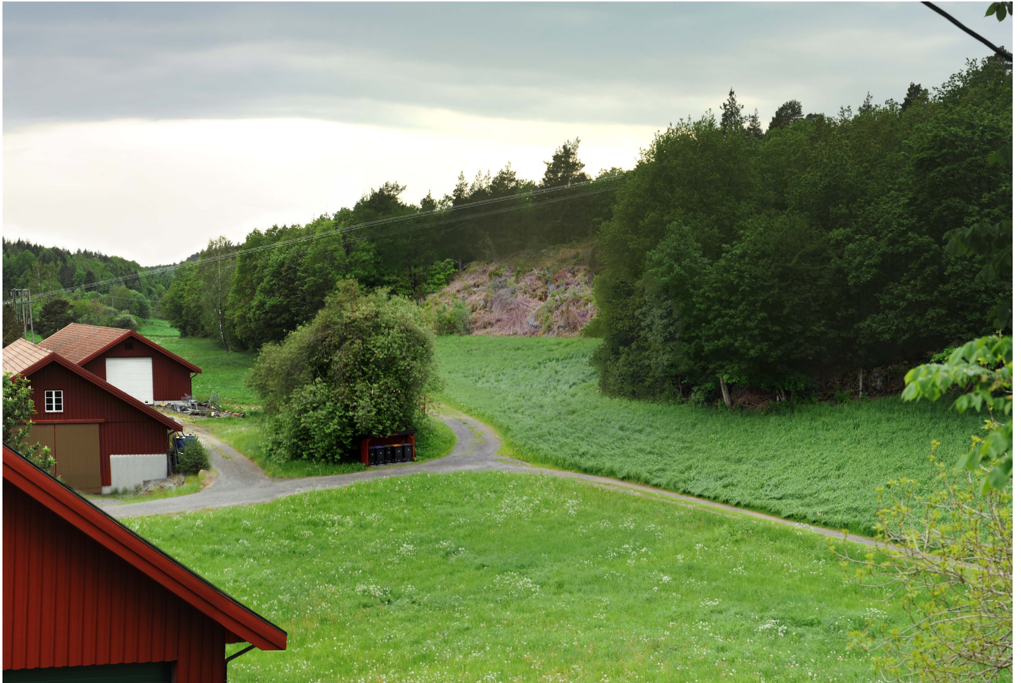
Brennvidde: 50 mm Dagens situasjon