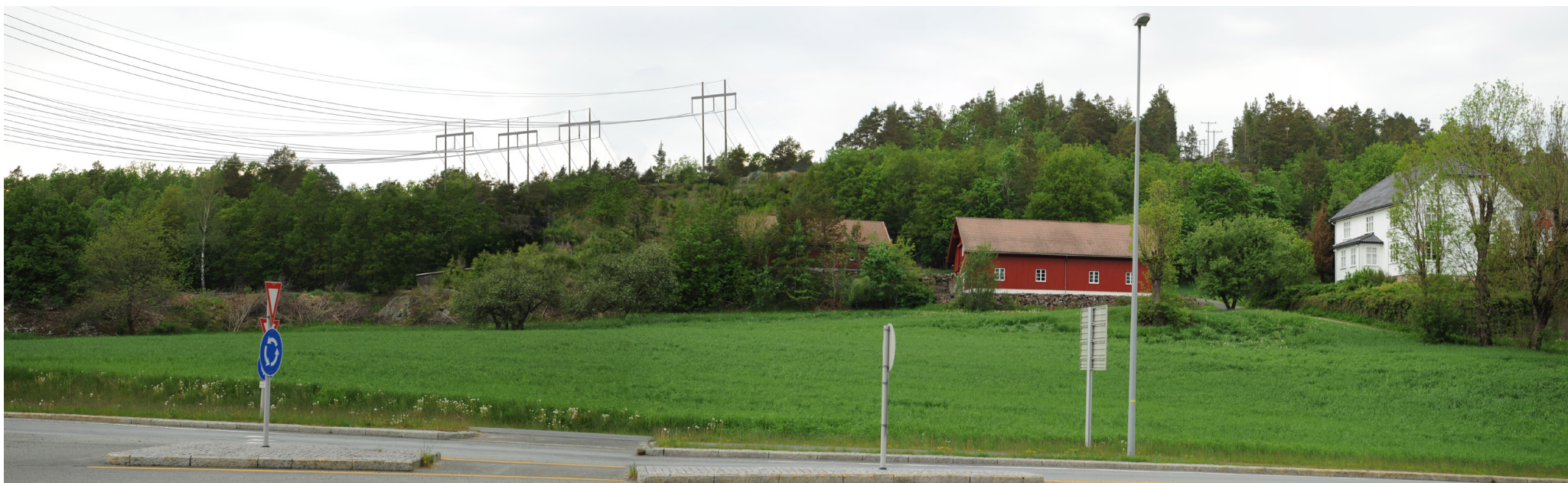
Ny situasjon med løsning 2 alt. 2.1 og 2.2

Panoramaet er satt sammen av 2 bilder med brennvidde: 52 mm