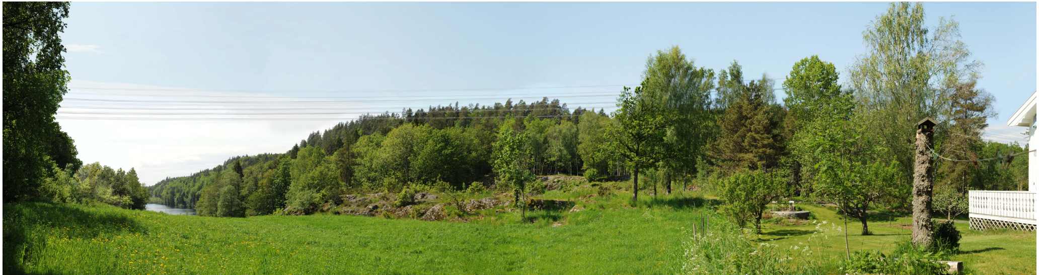
Ny situasjon med løsning 2 alt. 2.1 og 2.2