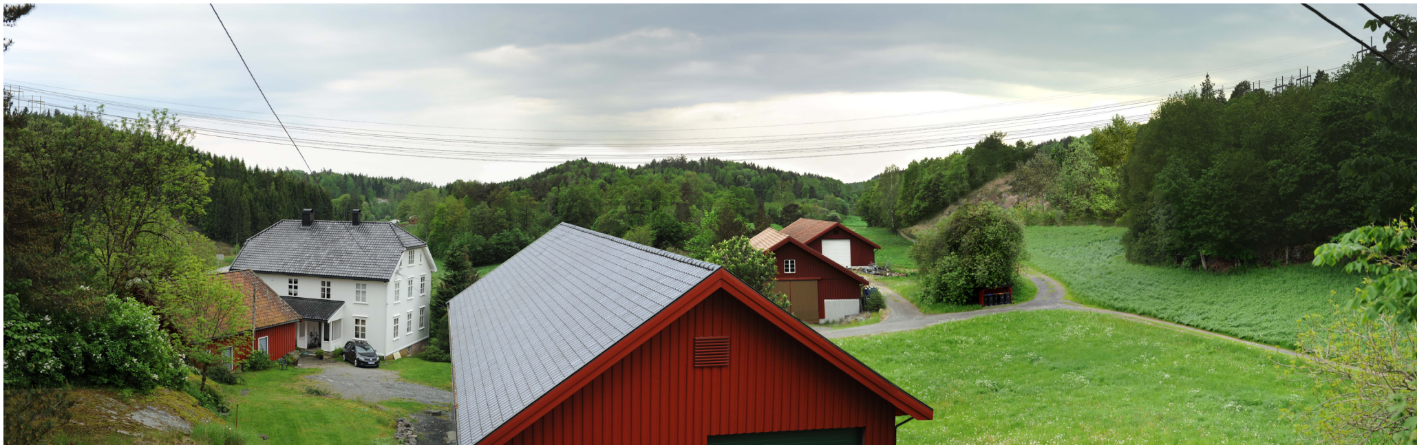
Ny situasjon med løsning 2 alt. 2.1 og 2.2

Panoramaet er satt sammen av 3 bilder med brennvidde: 50 mm