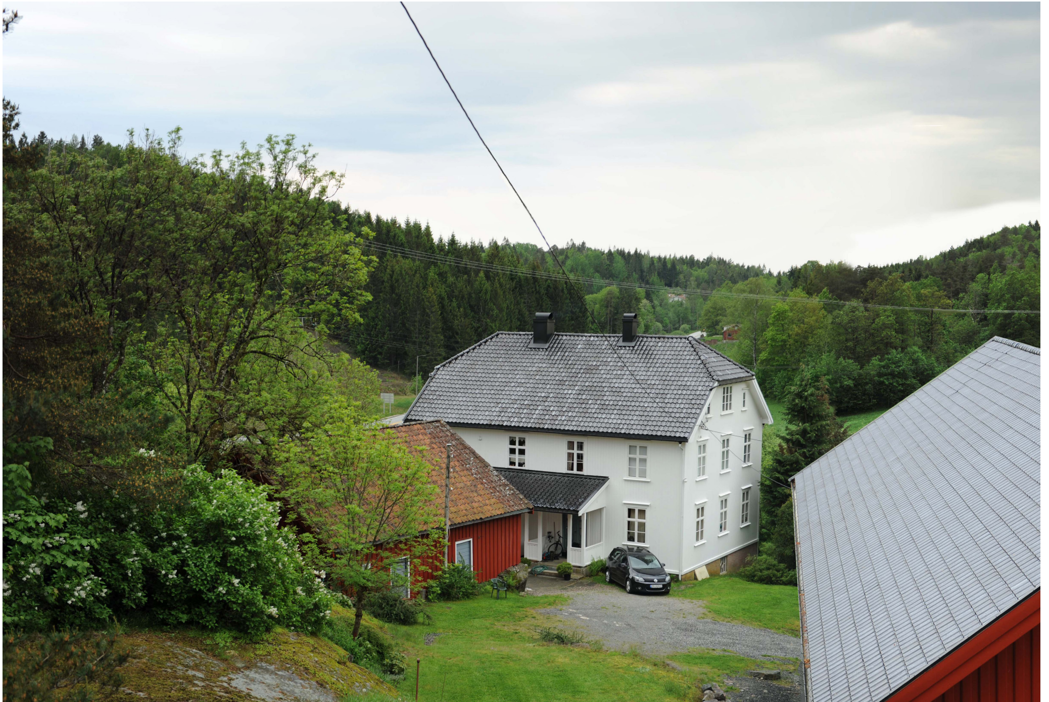
Brennvidde: 50 mm Dagens situasjon