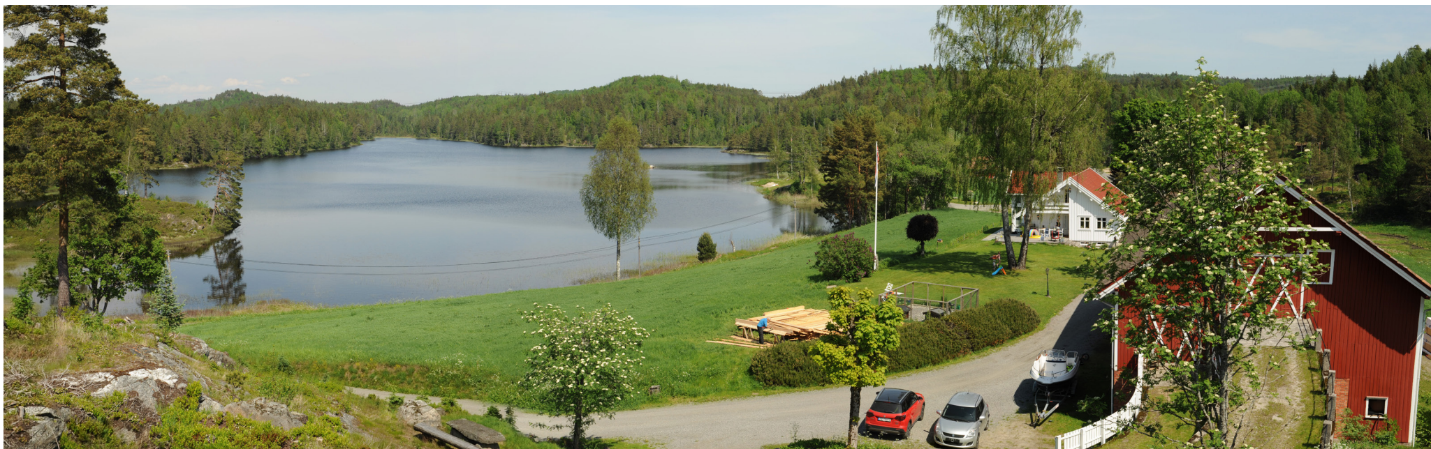
Ny situasjon med løsning 2 alt. 2.1.1-2.1 og 2.2.1-2.2