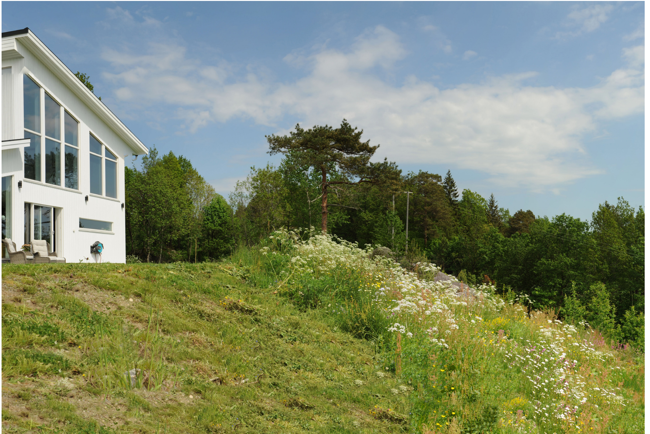
Brennvidde: 50 mm Dagens situasjon