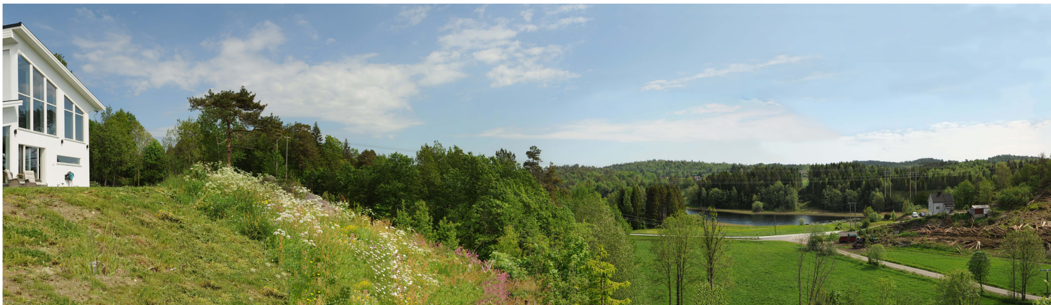
Ny situasjon med løsning 3 alt. 3.1 og 3.2

Panoramaet er satt sammen av 4 bilder med brennvidde: 50 mm