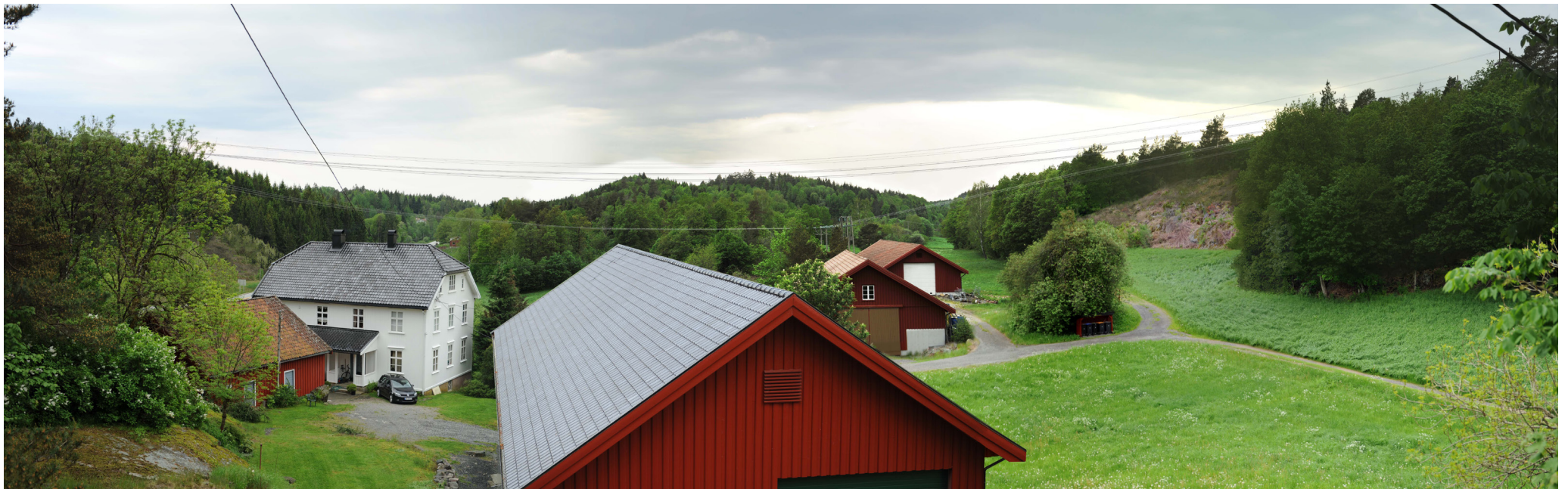
Ny situasjon med løsning 1 alt. 1.1 og 1.2

Panoramaet er satt sammen av 3 bilder med brennvidde: 50 mm