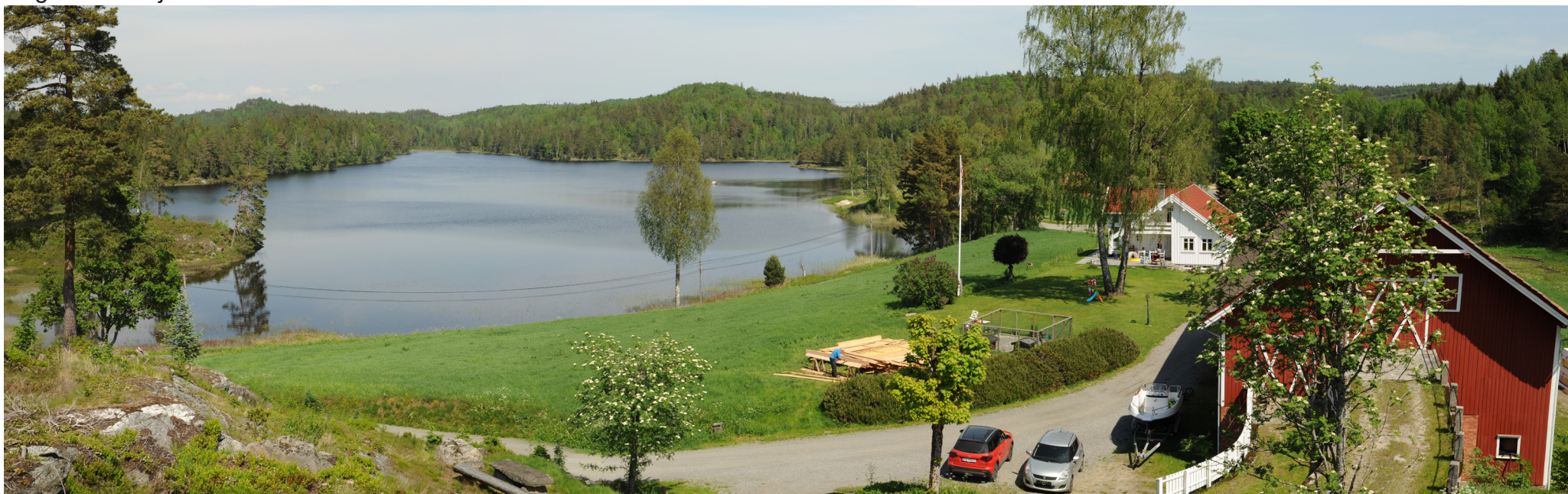
Ny situasjon med løsning 2 alt. 2.1.1-2.1 og 2.2.1-2.2

Panoramaet er satt sammen av 3 bilder med brennvidde: 50 mm