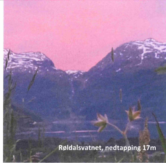
Røldalsvatnet, nedtapping 17m