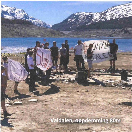
Valdalen, oppdemming 80m