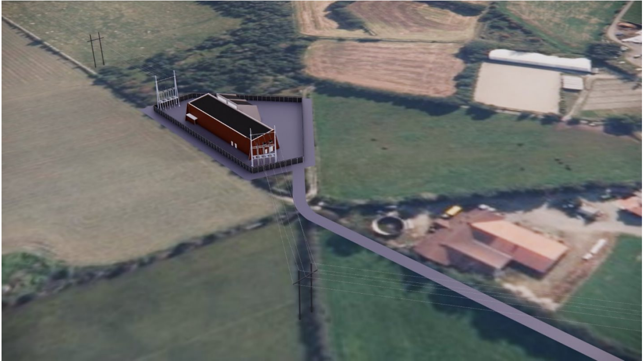
Figur 3 Tjøtta transformatorstasjon, sett fra vest