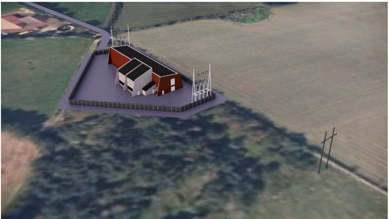
Figur 4 Tjøtta transformatorstasjon, sett fra øst