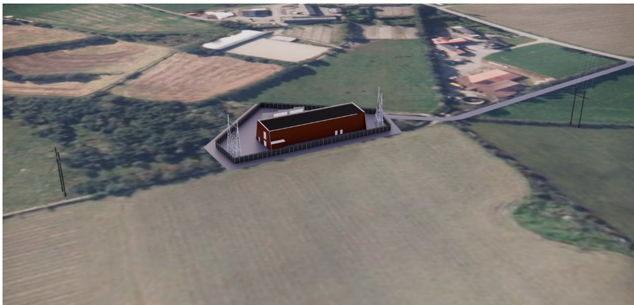
Figur 1 Tjøtta transformatorstasjon, sett fra nord