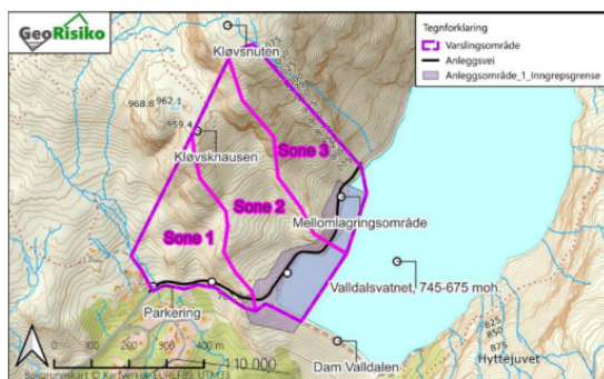
Figur 2.1-1: Kartutsnitt som viser topografiske forhold i varslingsområdet, samt vår inndeling av varslingssoner.