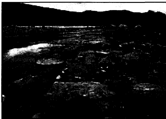
Figur 2. Vannstanden i Eikredammen varierer mye (vanligvis mellom kote 566 og 562) innenfor korte tidsintervaller. Bilde viser Eikredammen slik den fremstår som nedtappet.

Spesielt på ettersommeren kan man oppleve at vannstanden i Eikredammen tappes ned til et minimum (se fig. 2). Denne nedtappingen fører til at Eikredammen fremstår som svært lite estetisk noe som igjen fører til at opplevelsen av området i sin helhet blir nedsatt.