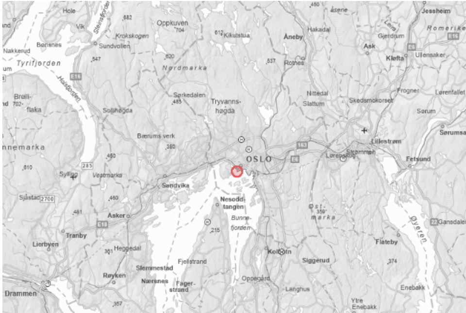
Figur 1: Oversiktskart over Filipstadkaia i Oslo kommune. Kilde: NVE Atlas.