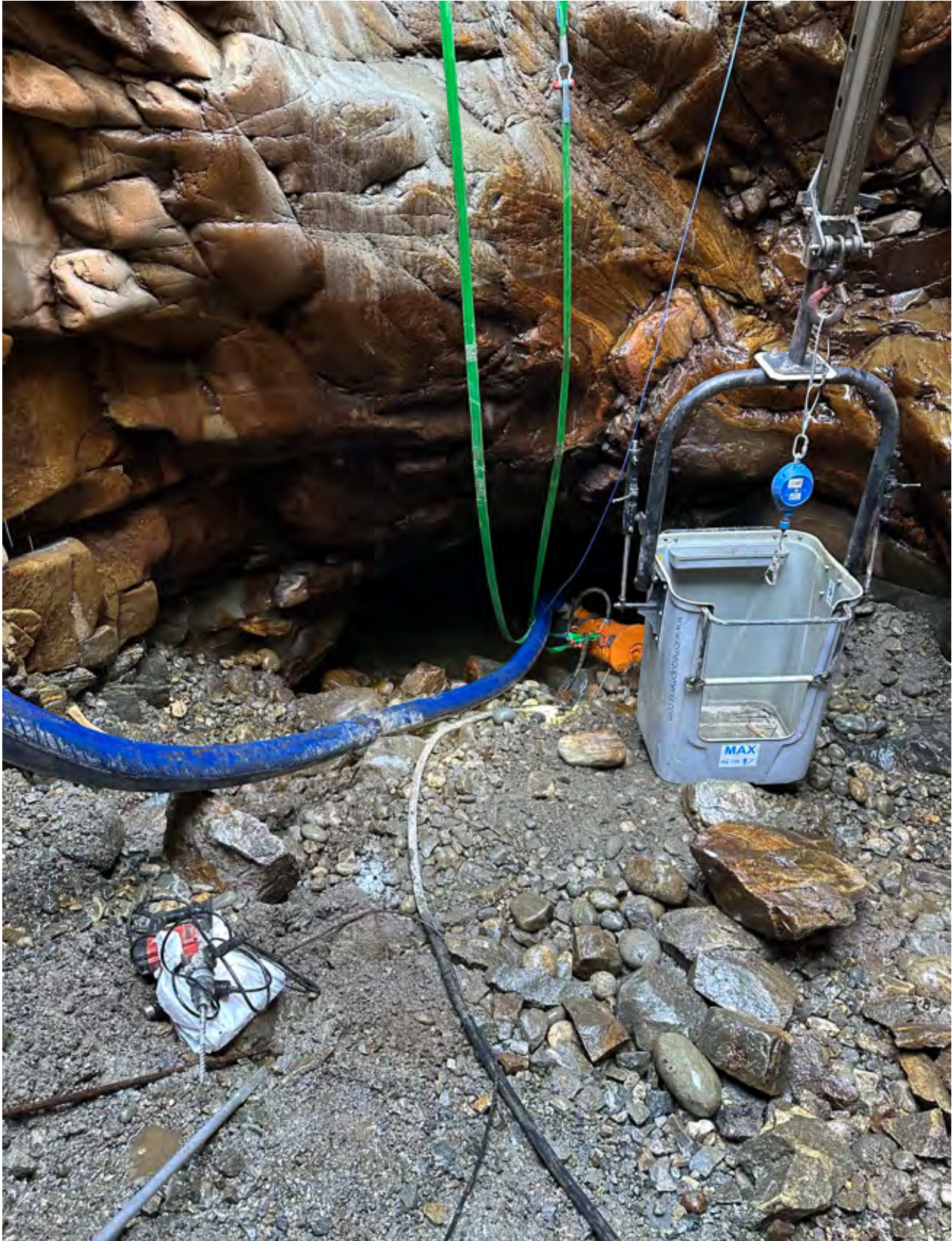
Foto: Etter oppstart fjerning av masser.