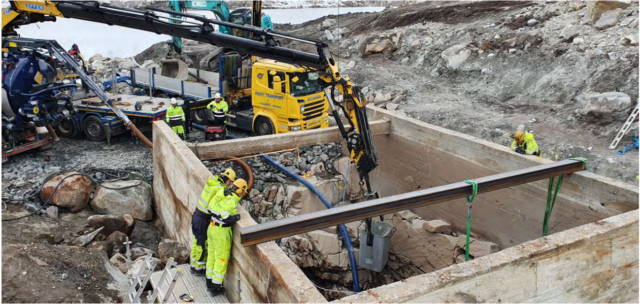
Foto: Uttak av masser med kran, slamsuger samtidig som det pumpes vann ut av tunnelen.

Vedlegg tegning tunnel Tverrvatn/Årsdalsvatn – Stordalsvatn, BKK tegn nr 8606