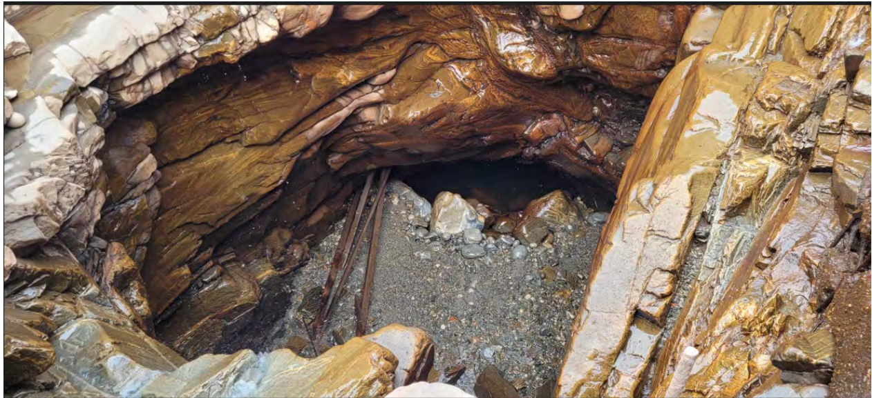
Foto: Utløp fra tunnel i Stordalsvatn før oppstart med fjerning av masser.