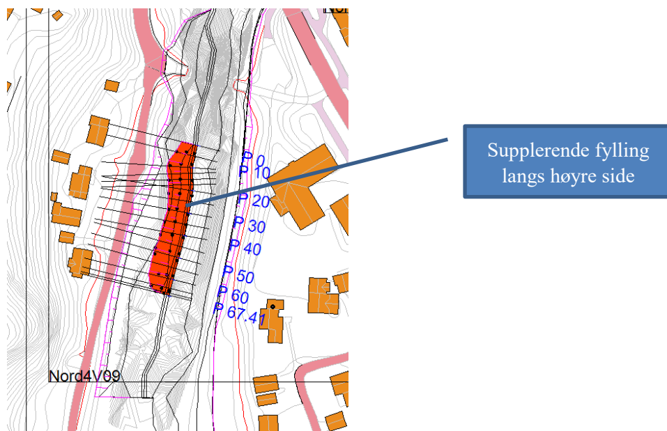
Figur 1: Lokalisering av supplerende tiltak

Pga. for dårlig stabilitet mot Frønesvegen var det behov for et supplerende sikringstiltak langs høyre elveside av Norddalselva, over en strekning på ca. 68 m. Se figur 1 for lokalisering av tiltaket.