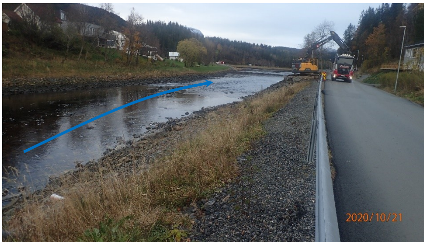
Figur 5: Ferdig tiltak. Gravemaskin fjerner anleggsveien