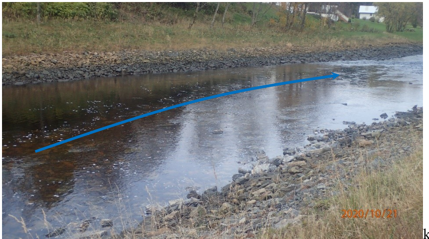
Figur 4: Ferdig tiltak