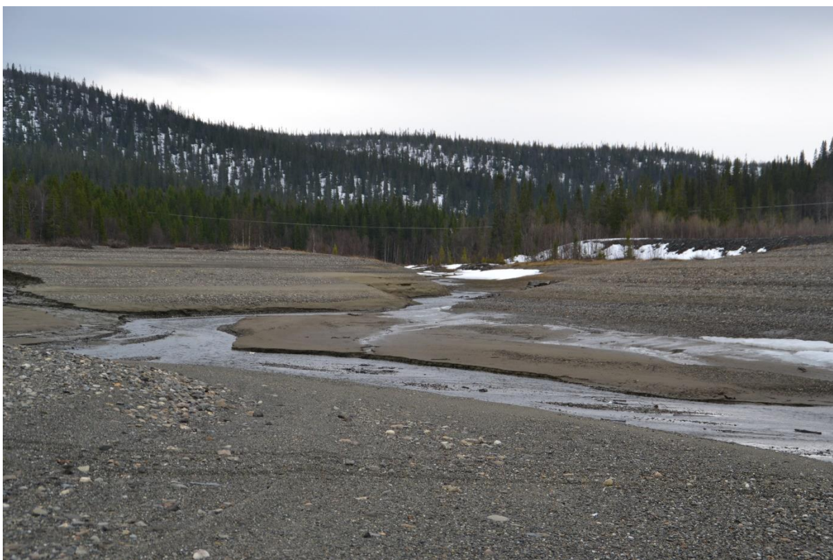
Situasjonen 11.05.2018, sett mot utløpsdammen fra området ved tunnelinntaket. Tilløpsvann fra sidene renner mot sjøen. Det vil være minst 0,5 km fra utløpsdammen til et mulig inntak for pumping av minstevannføring fra magasinet slik topografien er mot utløpet. Vannstand 410,21, LRV + 121 cm.