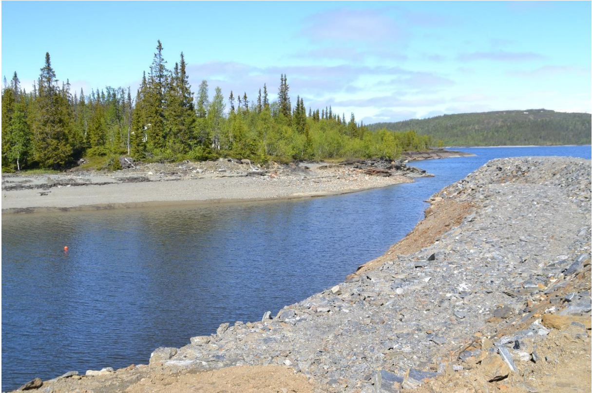
Innløpet til båthavna ved parkeringsplassen 28.06.2015.