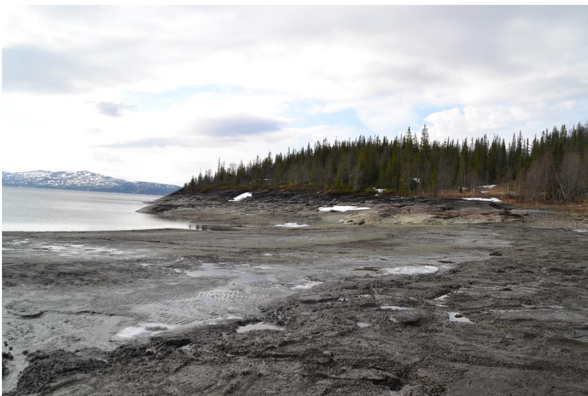
Massene i reguleringssonen har beveget seg utover mot dypere områder. Det opprinnelige grunne strandområdet med sand og grus er totalt endret, 16.05.2018.