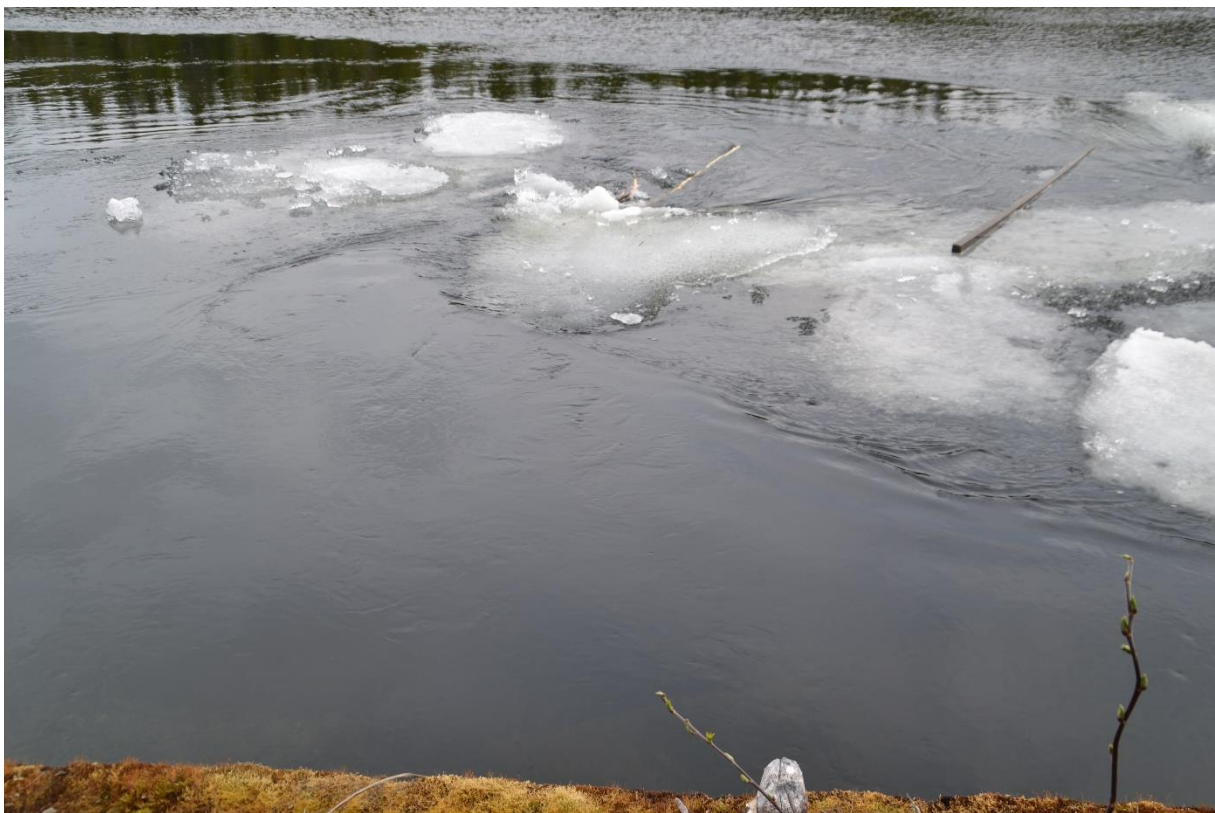
Her er det ingen form for sikkerhet mot inntaksvirvelen foran tunnelåpningen.