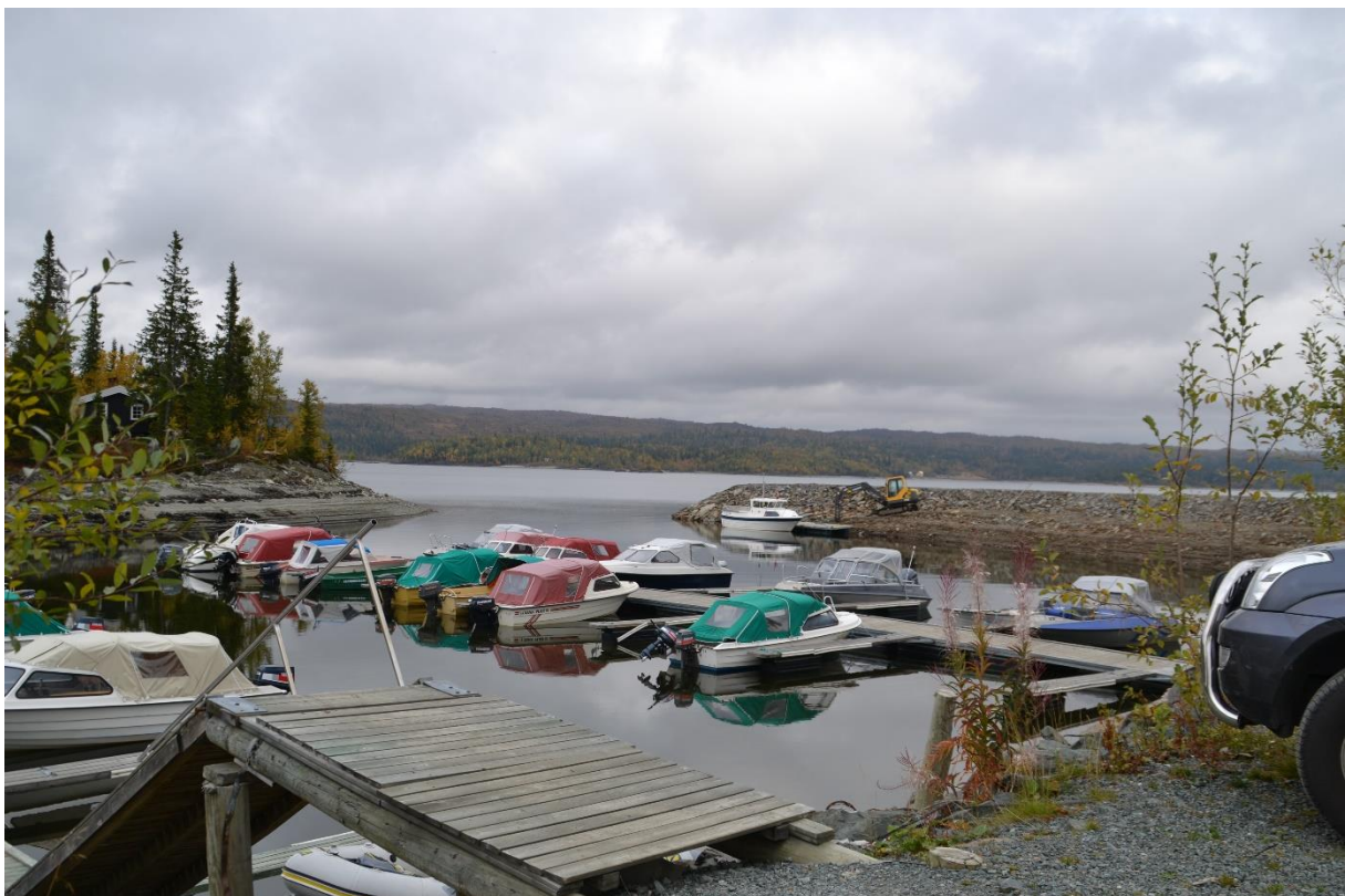
Havneanlegget i bruk sent i august.