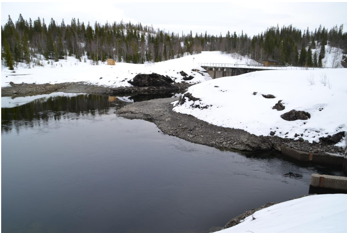
Inntaket i forgrunnen sett fra motsatt side 19.04.2019. Utløpsdammen med luker i bakgrunnen.