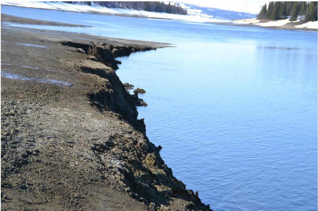
Ved rask senkning får man lett direkte utglidning av masser. Bilde av 11.05.2011.