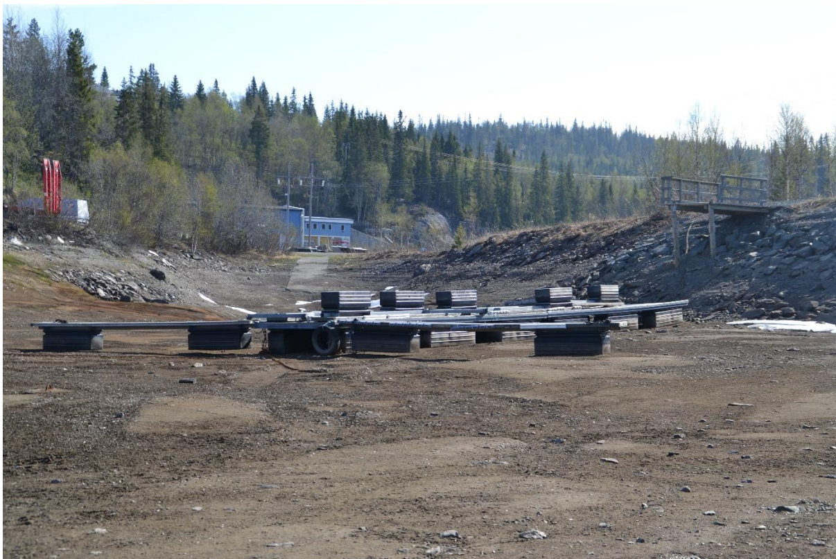
22.05.2018. Vannstand 411,39 = LRV + 2,39