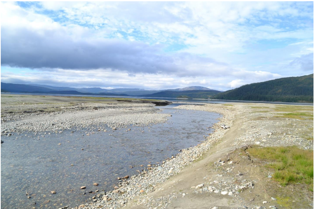
Området etter lav vannstand over lenge tid, 20.08.2018. Vannstand rundt 255,00 eller HRV – 2,50.