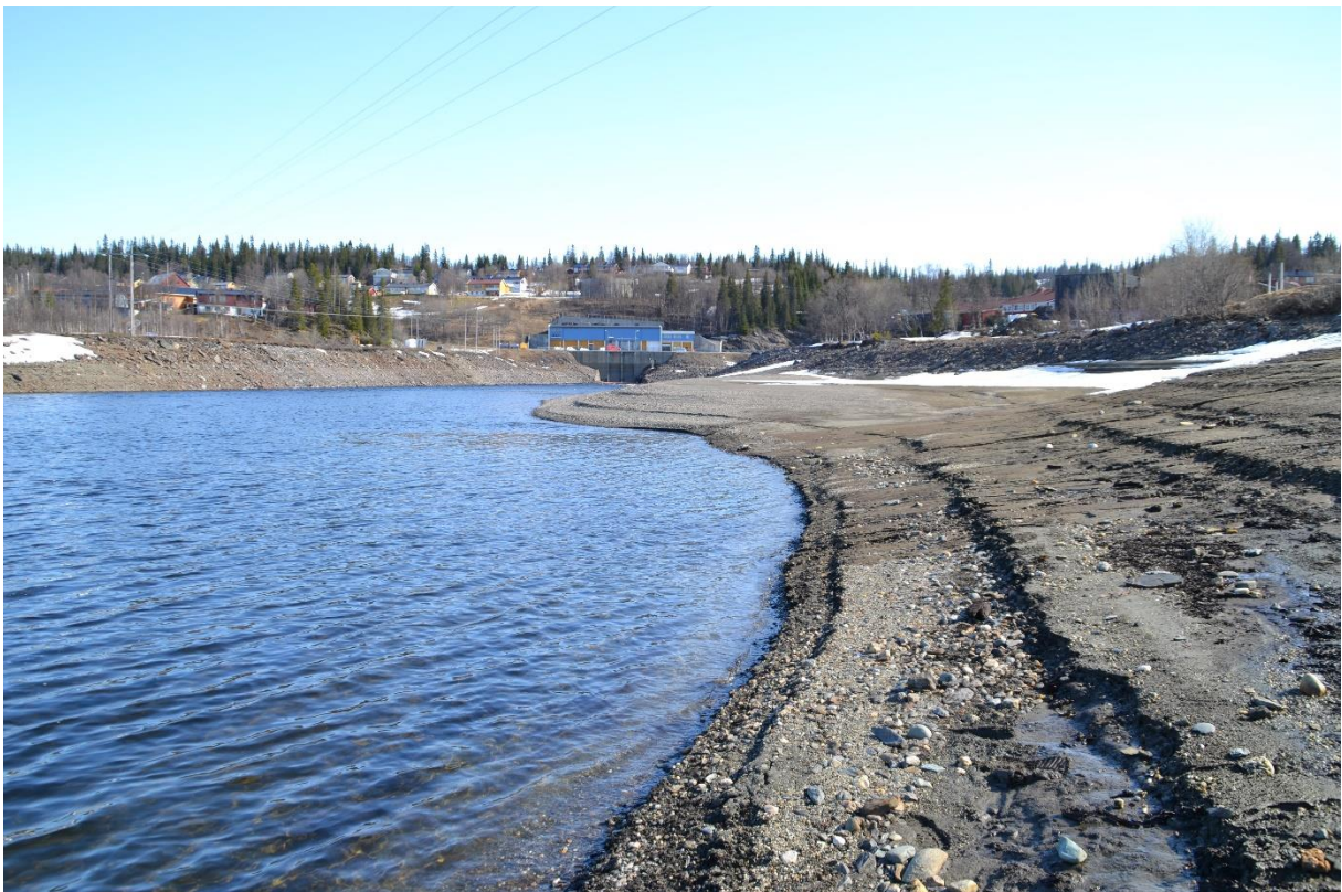
I hele senkingssonen får man noe utglidning av masse som skyldes bølgepåvirkning. Bilde av 11.05.2011.