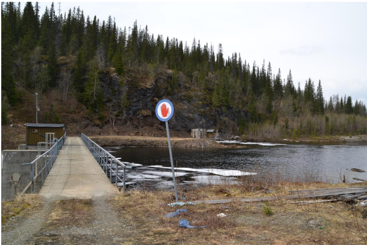
Adkomsten til dam og tunnelinntak ved utløpet fra Vekteren. Bilde tatt 22.05.2018

Utløpsdammen og inntaket for tunnelen til Røyrvikfoss kraftverk, er ikke spesielt avstengt eller avskjermet på noen måte i forhold til ferdsel. Inntaket er derfor forholdsvis enkelt tilgjengelig for publikum. Det meste av tiden er det mye strømmende vann her knyttet til tappingen til Røyrvikfoss kraftverk. Spesielt i en periode på våren/forsommeren går det også mye vann gjennom lukene i dammen og ut i det tørrlagte elveleiet. Opplysnings- og sikkerhetstiltakene her i forhold til publikum bør opprioriteres. Beliggenheten av anlegget ikke langt fra Røyrvik sentrum i et område som nyttes en del i fritidsammenheng, tilsier at dette med informasjons- og sikkerhetstiltak overfor allmennheten er viktig. Spesielt synes selve tunnelinntaket til kraftverket å være dårlig avskjermet. Det er viktig at alle som benytter området blir klar over at det er viktig å ta tilstrekkelige sikkerhetshensyn i forhold til ferdsel og opphold ved slike anlegg.