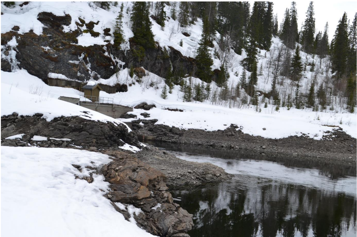
Forholdene avbildet 19.04.2019 ved noe lavere vannstand.