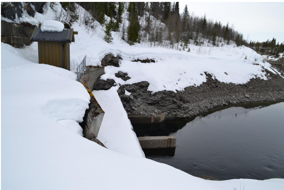
Tunnelinntaket ved lav vannstand og begrenset tappng den 19.04.2019.