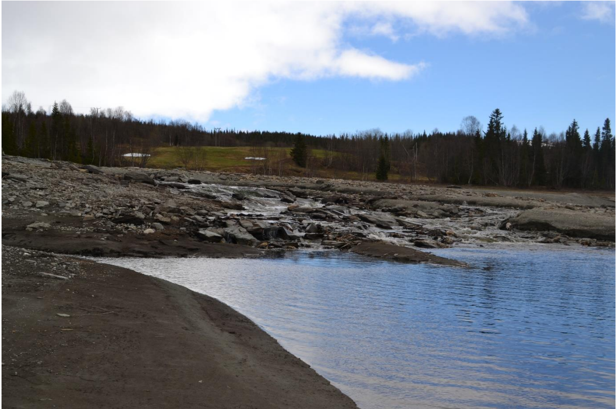
Slåttvika 25.05.2016. Det er slutt på bruken av stranden her til badeplass.