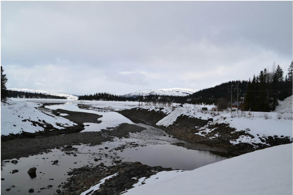
Bilde 6 år senere den 29.04.2018. Vannstand 409,70 eller 70 cm over LRV.