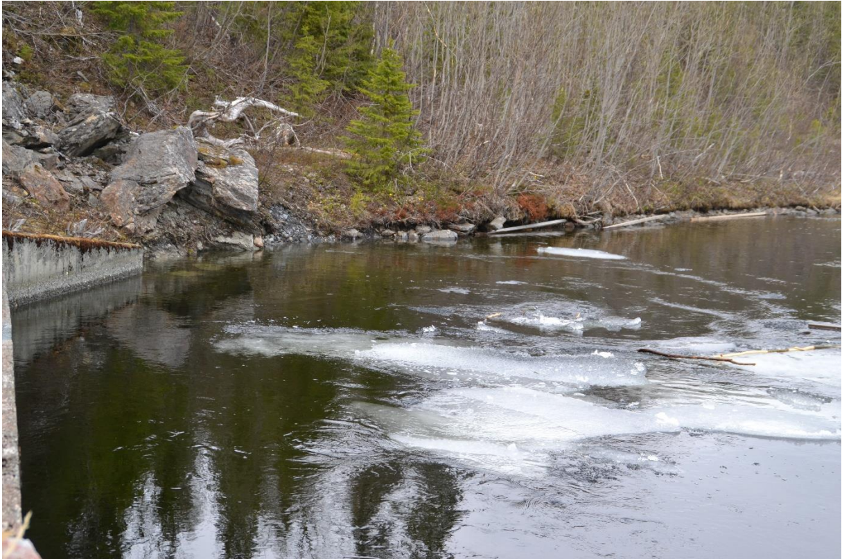
Situasjonen sett fra motsatt side 22.05.2018.