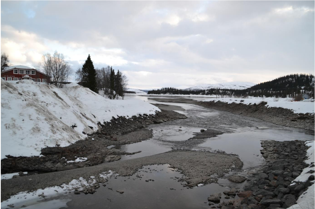
Tilsvarende situasjonsbilde tatt 14 dager tidligere den 28.04.2012. Vannstanden er noen cm høyere.