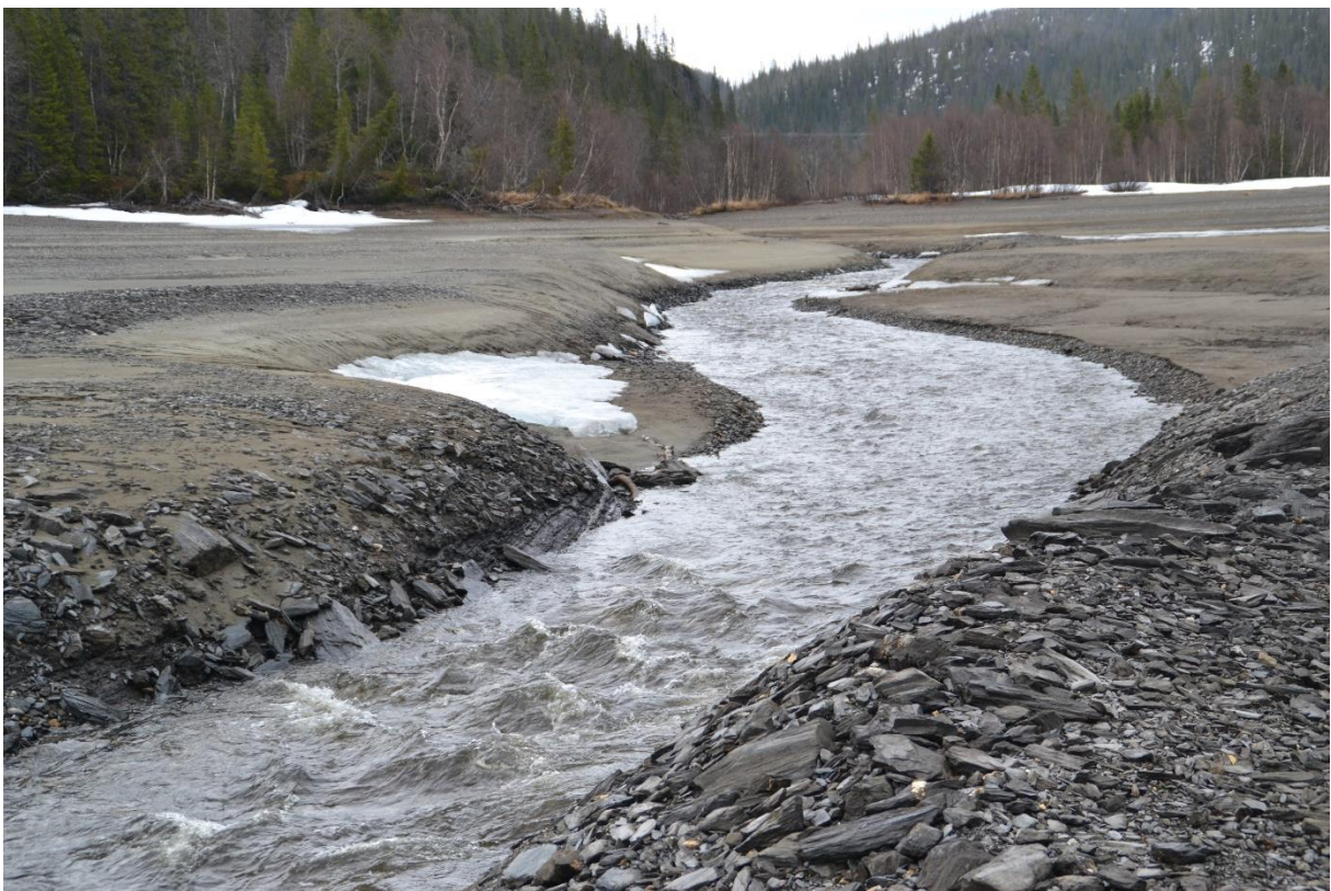
Hovdbekken sett mot der den løper ut i Limingen og Fylkesveg 7016.