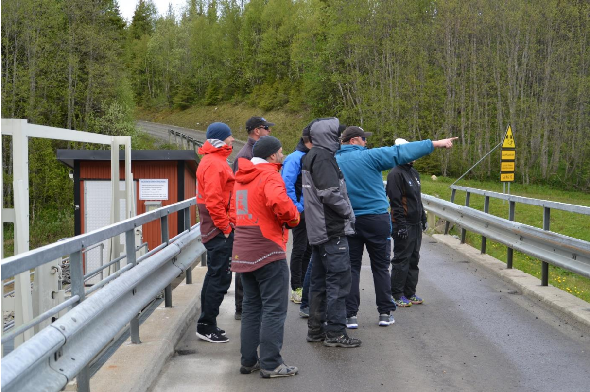
Samling på dammen ved utløpet av Limingen, 08.06.2016.