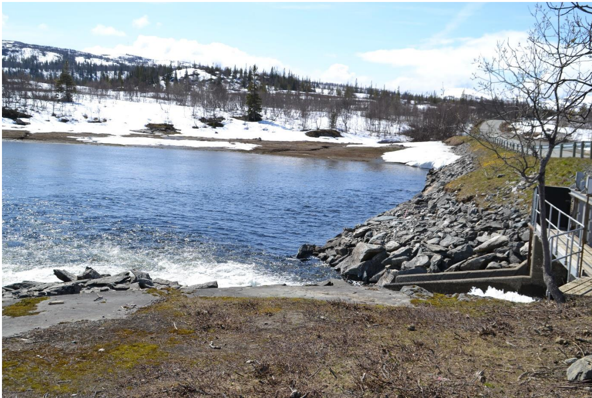
Dam med lukesystem som holder vannstanden i Gjersvika når Limingen senkes.

Gjersvikbukta ble ikke senket ved reguleringen av Limingen.