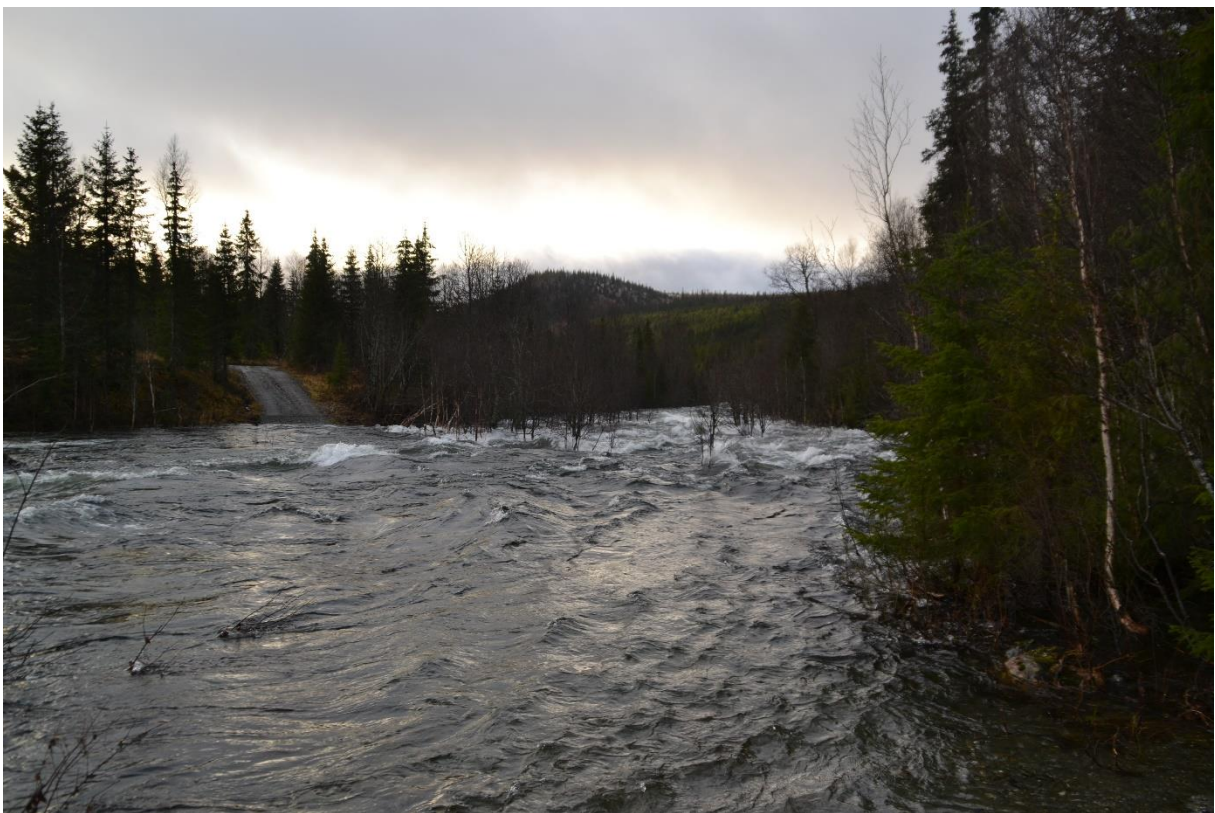
Her ser man forholdene noe lenger ned der en skogsveg krysser elveleiet.