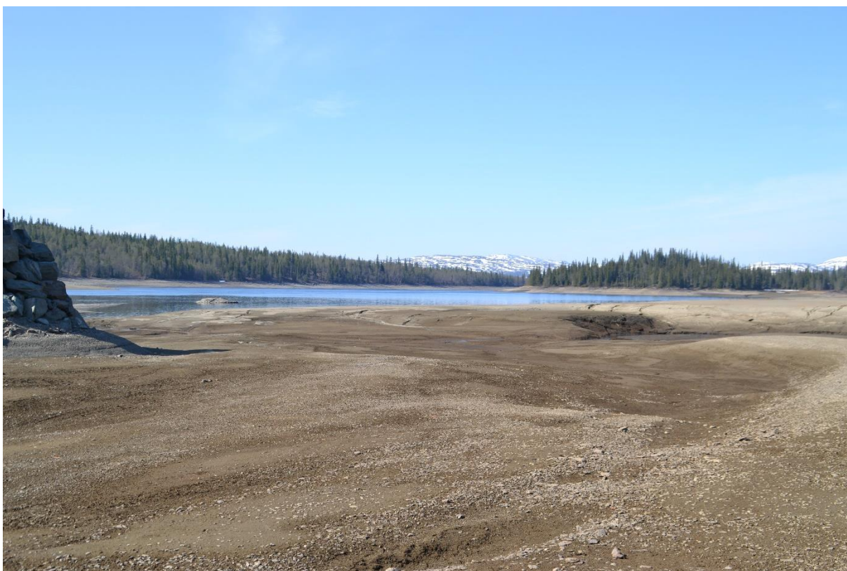
22.05.2018. Vannstand 411,39. Det er langt ut til stranden fra bryggen.