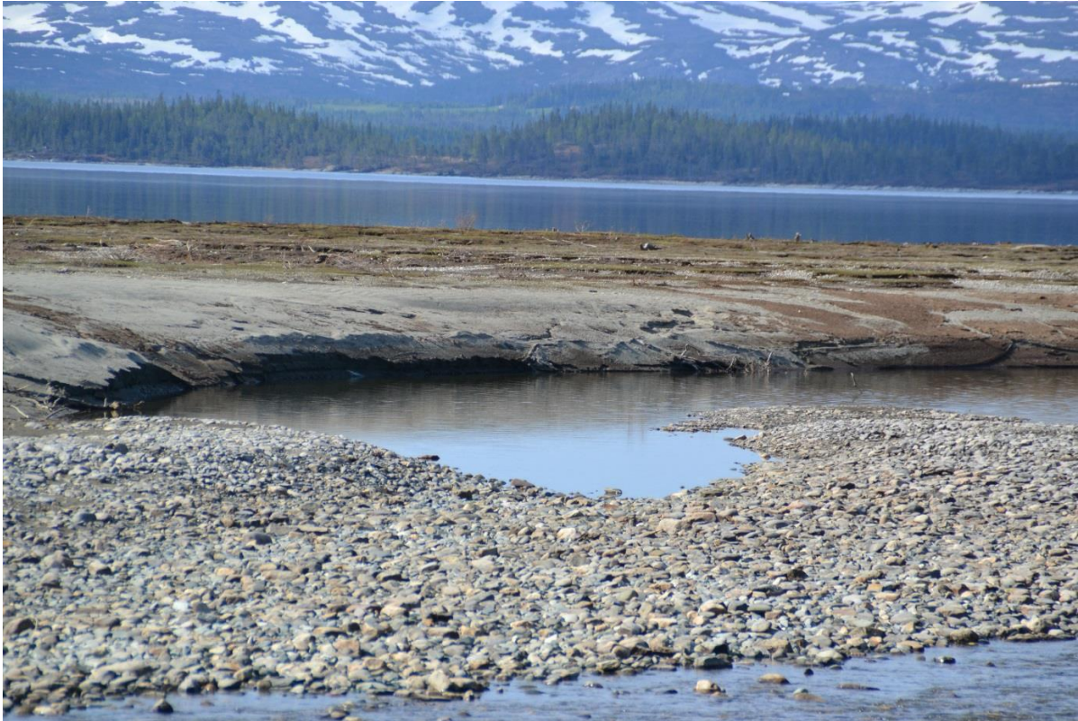
Områder ved utløpet av Mykkelvikelva 30.05.2013.