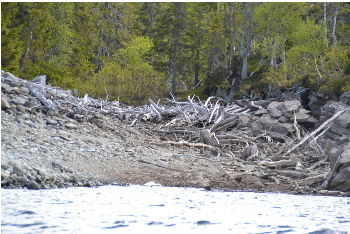
Det er ikke enkelt å ferdes langs denne stranden. HRV-3,80 06.06.2018.