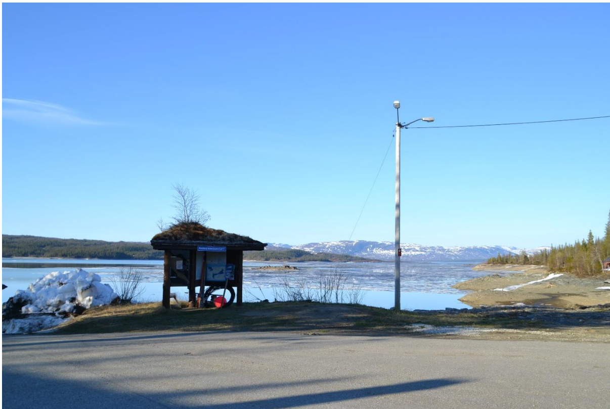
Parkeringsplassen ved enden av fylkesvegen den 24.05.2018. Vannstand 448 eller HRV – 6 m.

Namsvatn er den sjøen i Røyrvik som har den mest omfattende reguleringen. Ettersom hele reguleringssonen består av oppdemning i forhold til naturlig tilstand, har reguleringen svært store miljømessige konsekvenser. På grunn av beliggenheten blir også Namsvatn den sjøen som på mange måter berører det bredeste interessefeltet i forhold til både naturmiljø og bruk. Det er lite trolig at det i dag ville blitt gitt konsesjon til å gjennomføre en så omfattende vassdragsregulering i dette området mot Børgefjell. Den omfattende årlige manøvreringen av vannstanden som følger av oppdemningen, medfører miljømessige problemer med erosjon og neddemt dårlig ryddet utmark. Dette har skapt og skaper fortsatt en rekke praktiske og sikkerhetsmessige utfordringer for oppsitterne og allmennhetens adkomst til sjøen og bruken av denne til ferdsel, friluftsliv og næring,