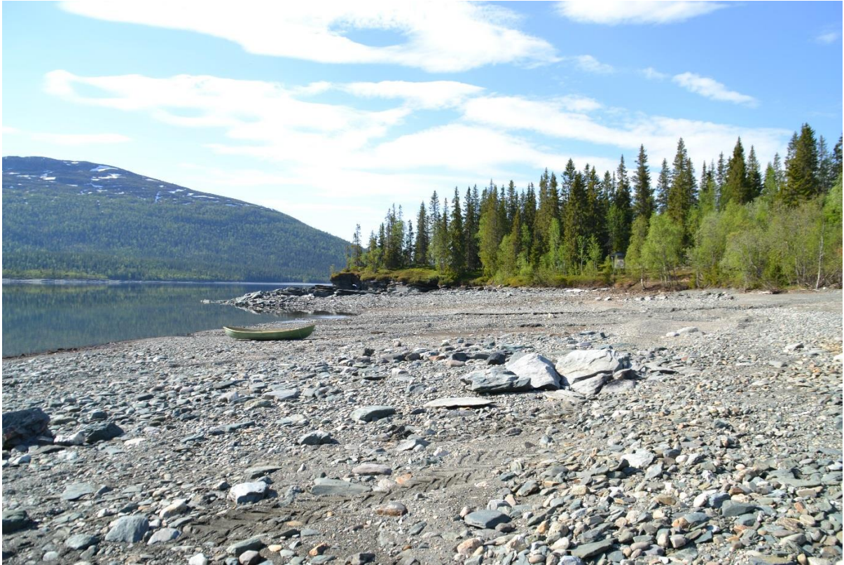
Situasjonsbilde fra Holmmoen 30.05.2013. Her er det ikke enkelt å behandle båter ved varierende vannstander.