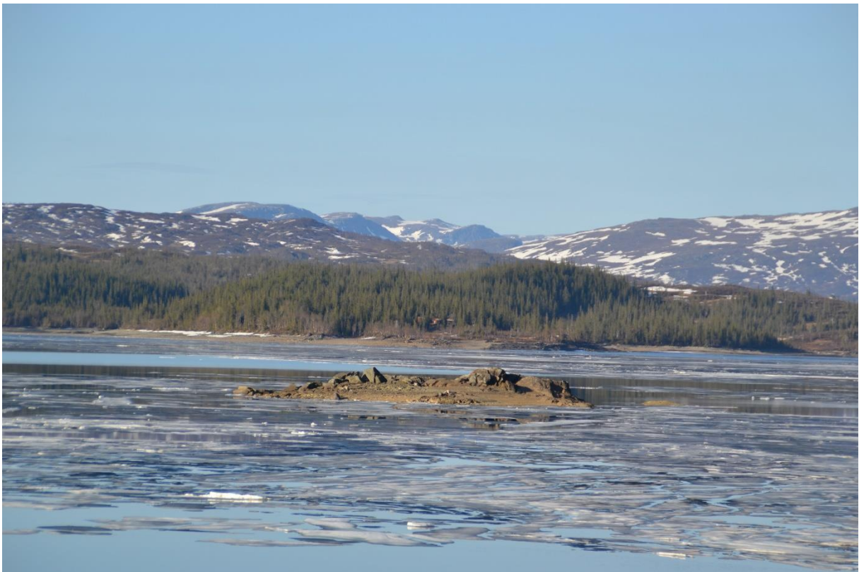
Det er mange farlige undervannsskjær ved ulike vannstander. HRV- 6,00 m den 24.05.2018.