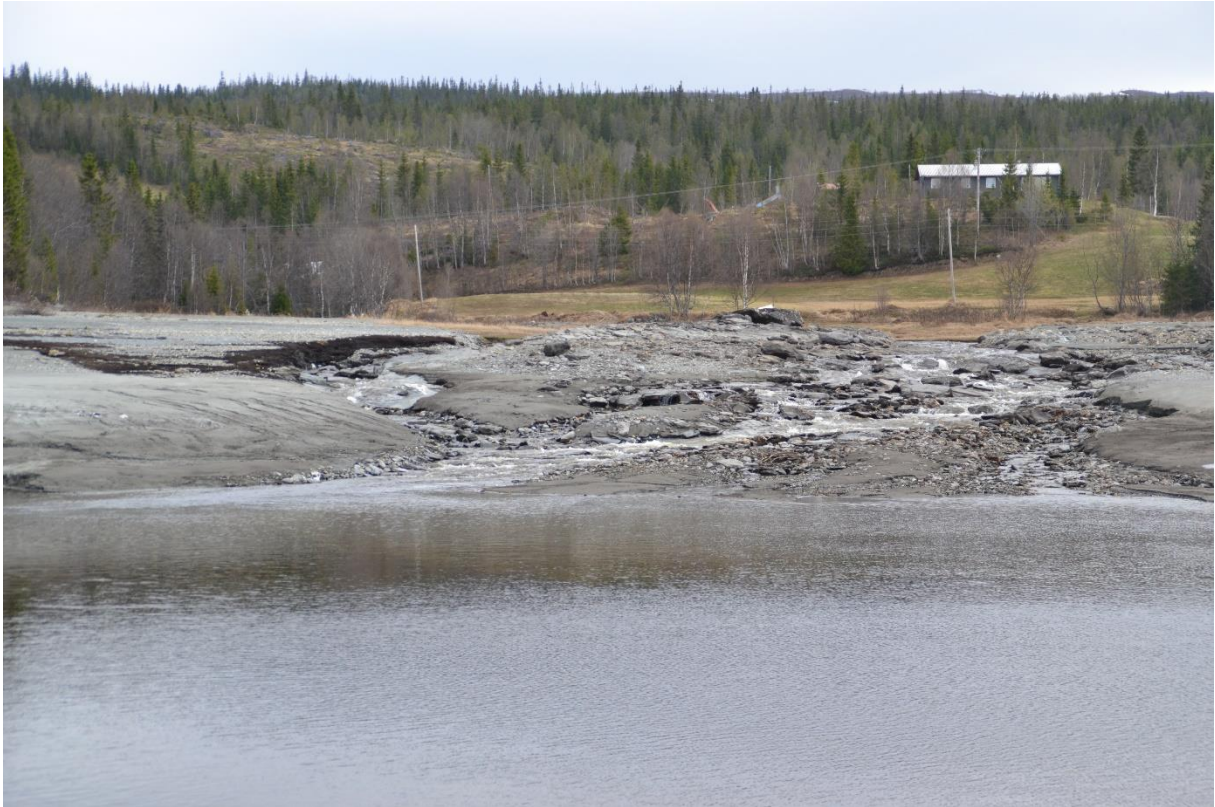
Forholdene i Slåttvika den 16.05.2018. Det er svært store endringer i løpet av få år.