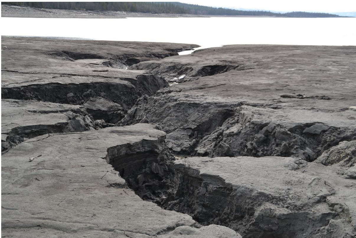
Ustabile nå lett påvirkelige masser i reguleringssonen. Slåttvika den 16.05.2018.