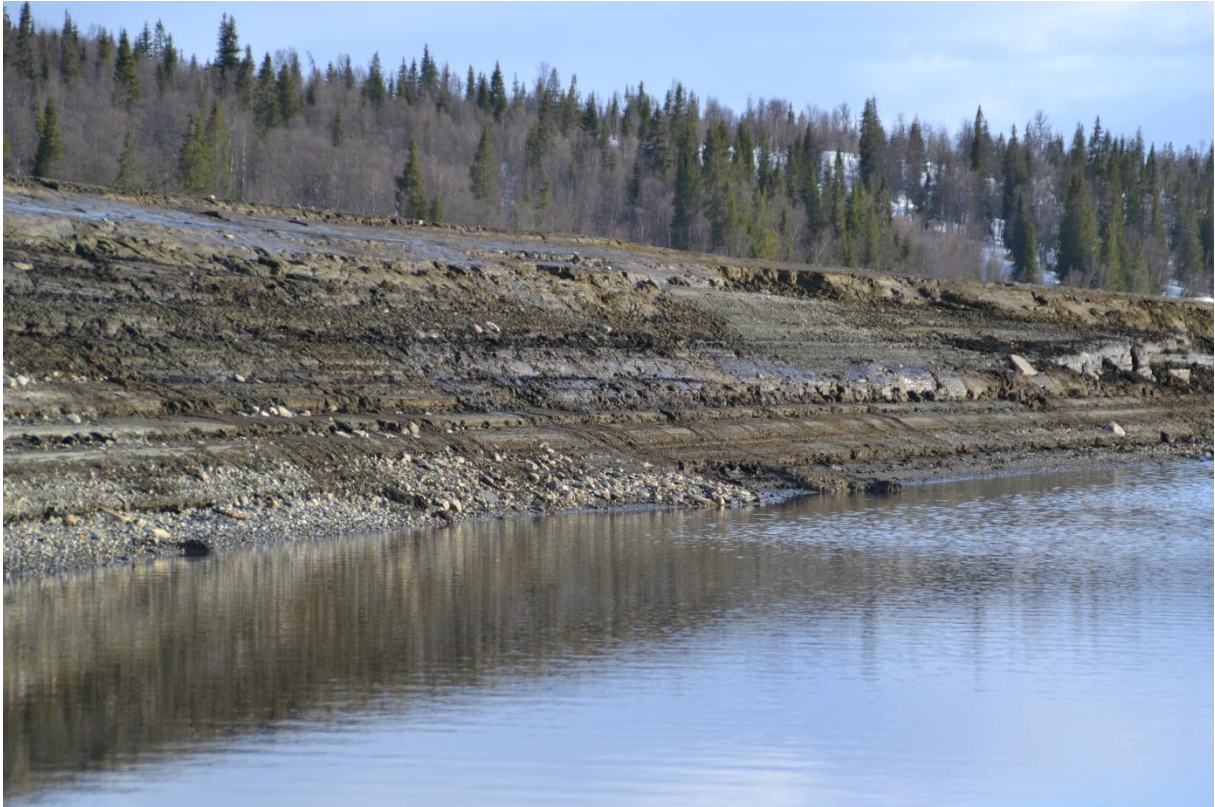
Vegetasjonen i strandsonen er utsatt ved fullt magasin om man overstiger HRV. Bilde av 11.05.2011.