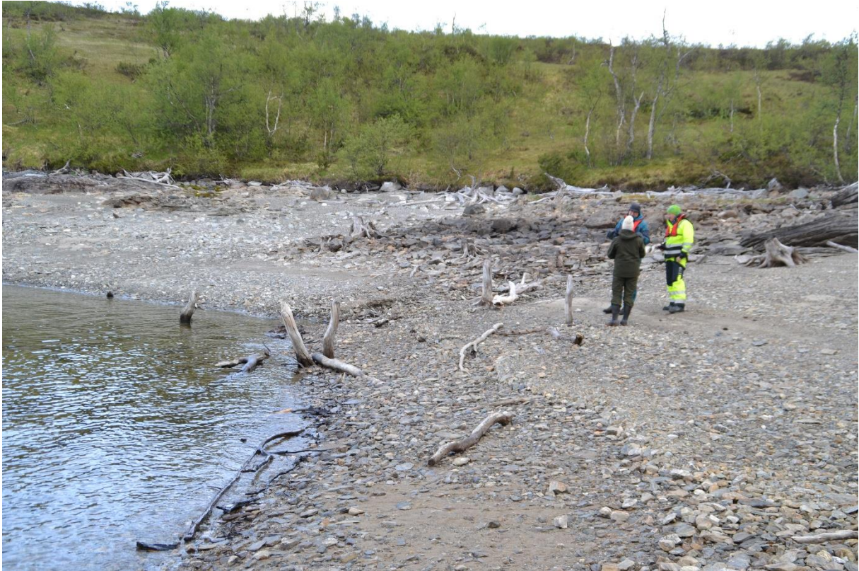
Etter 65 år med regulering, reker det fortsatt trevirke rundt i sjøen. 06.06.2018. LRV + 10,20 m.