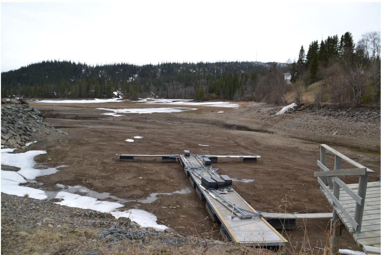
En vannstand på 411,10 = LRV + 3.10, er et forholdsvis høgt nivå på dette tidspunkt på våren.