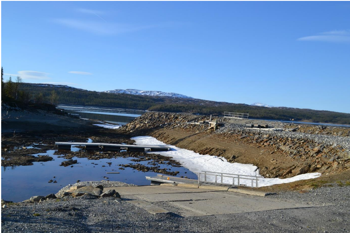
Båthavna ved parkeringsplassen 24.05.2018. Vannstand 448,00, eller HRV- 6,00 m.