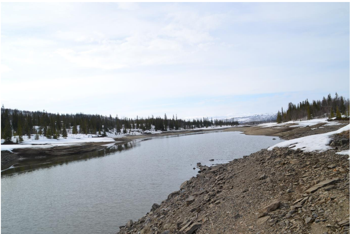
I en lengde på ca. 1 km ovenfor utløpet, er sjøen isfri på grunn av strømdraget. 07.05.2016.