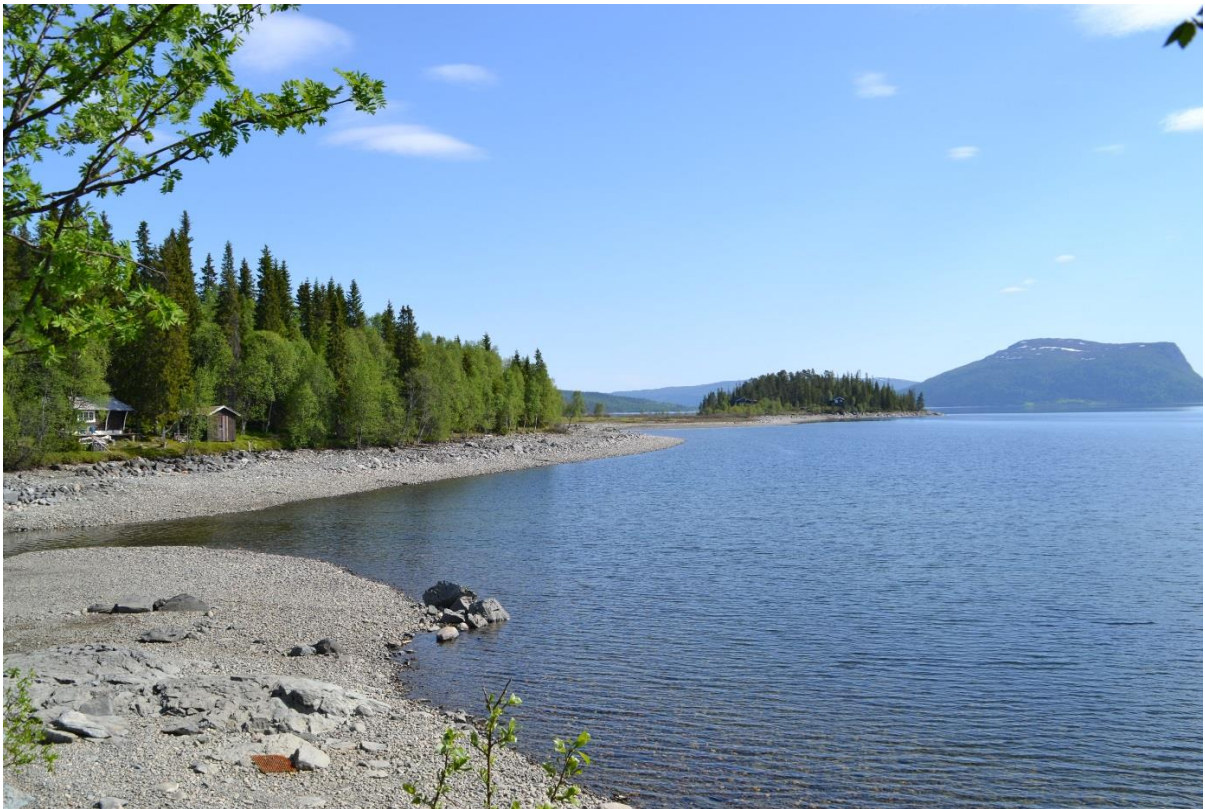
30.05.2013. Situasjonsbilde for en stor del av stredene rundt Tunnsjøen etter reguleringen.