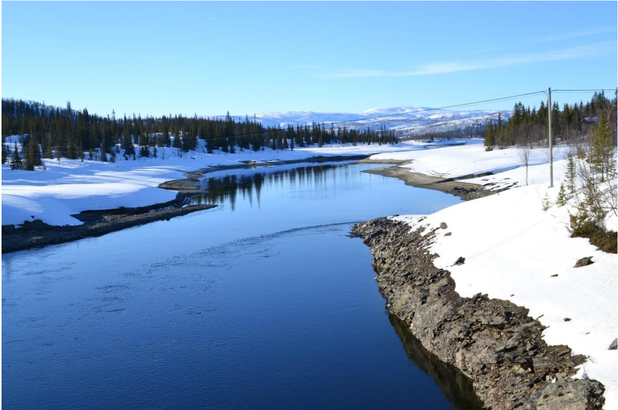
Situasjonsbilde fra Vekterhovden sett fra utløpskanalen og nordover, den 15.04.2019.