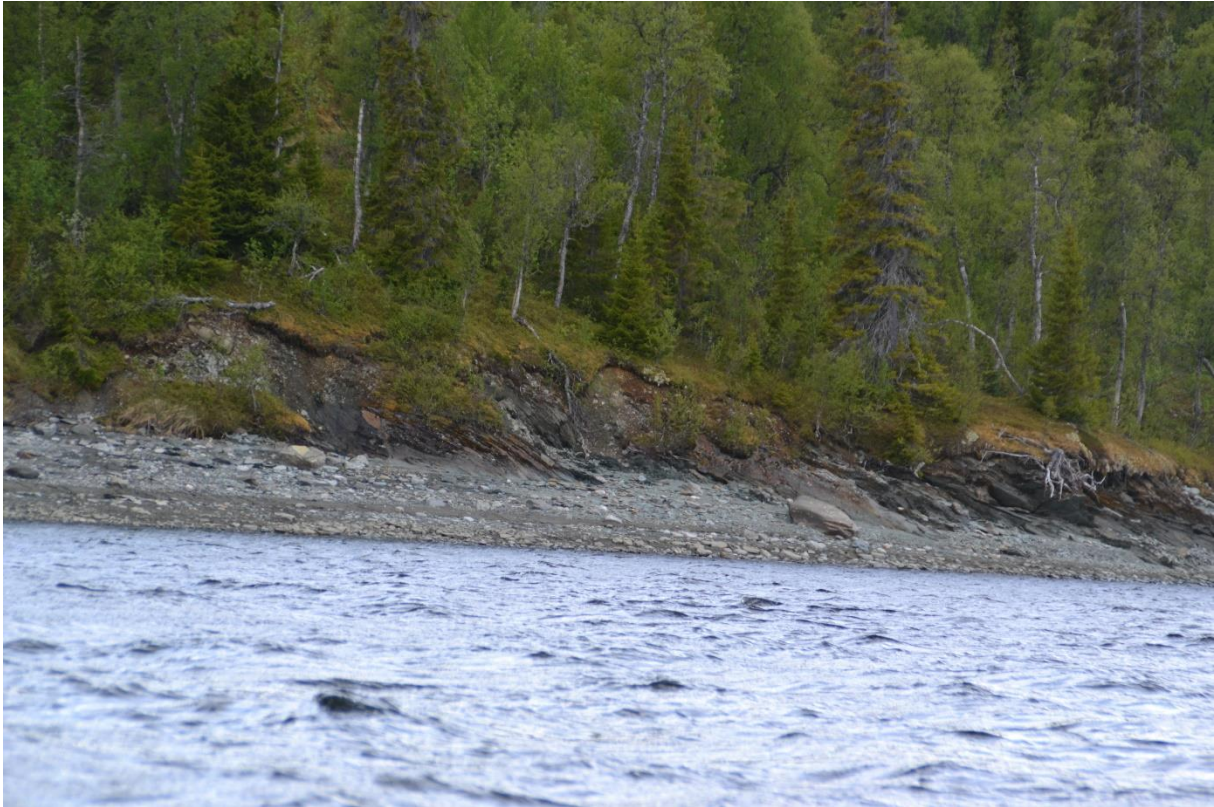
Erosjonen varierer mye etter terreng- og jordbunnsforhold. LRV + 10,20, eller HRV-3,80. 06.06.2018.