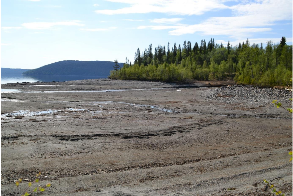
Situasjonen ved Mykkelvikelva og Mykkelmoen 30.05.2013. Adkomsten til sjøen er vanskelig.