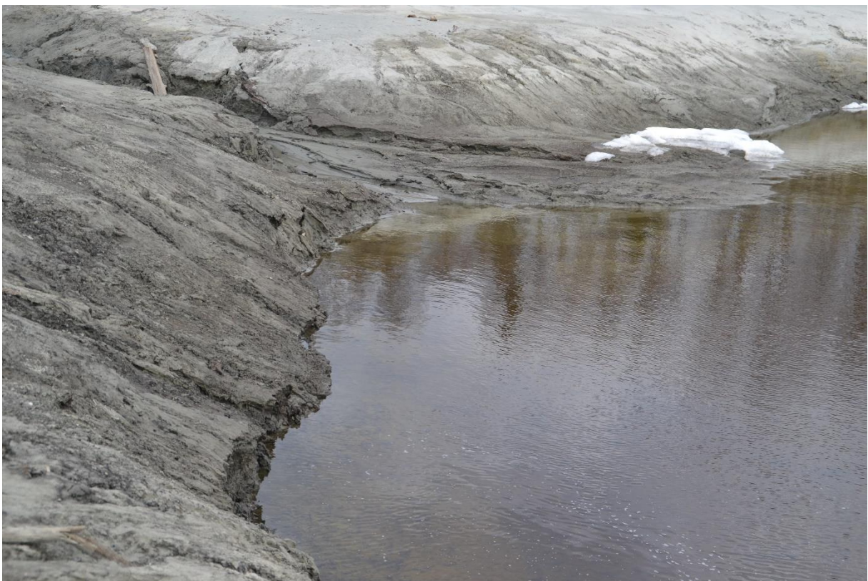
Det er ikke noe igjen av den opprinnelige strandsonen/sjøbunnen i Slåttvika, 16.05.2018.