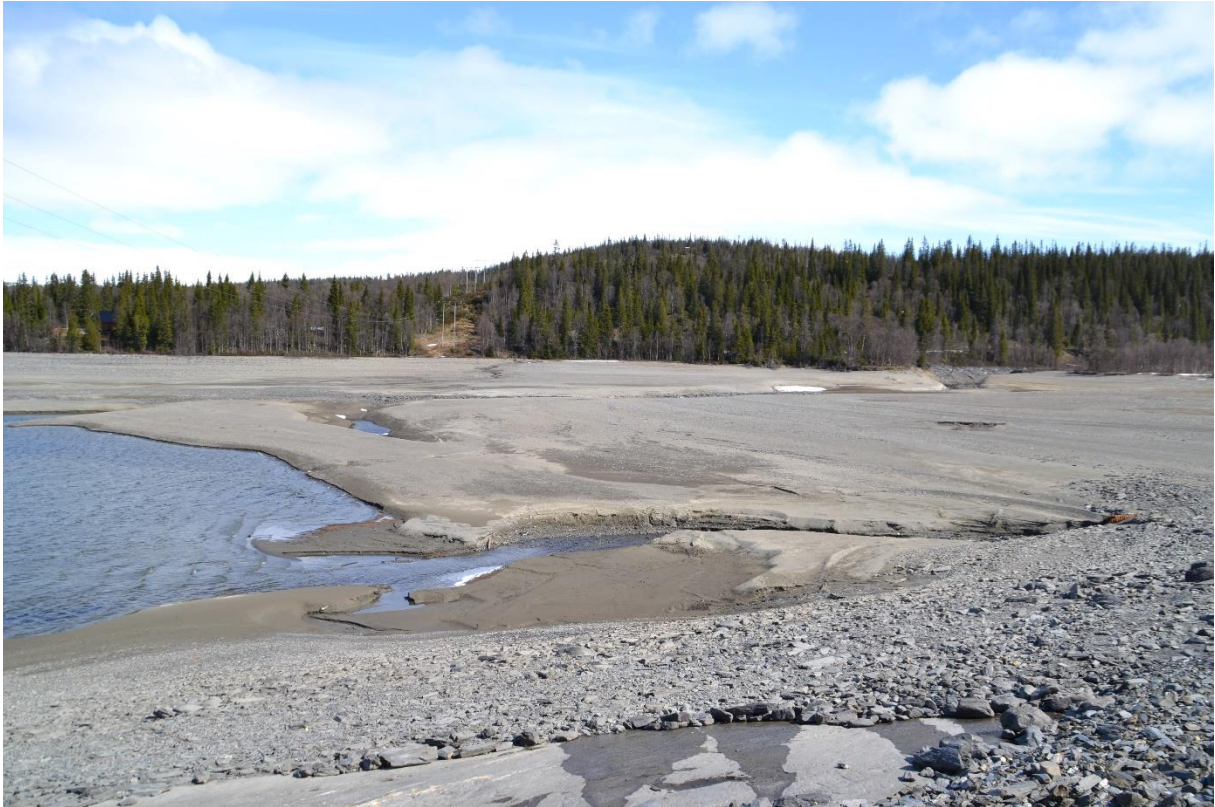
Området mellom utløpet til Hovdbekken i Limingen og inntaket for tunellen til Linnvasselv kraftverk.