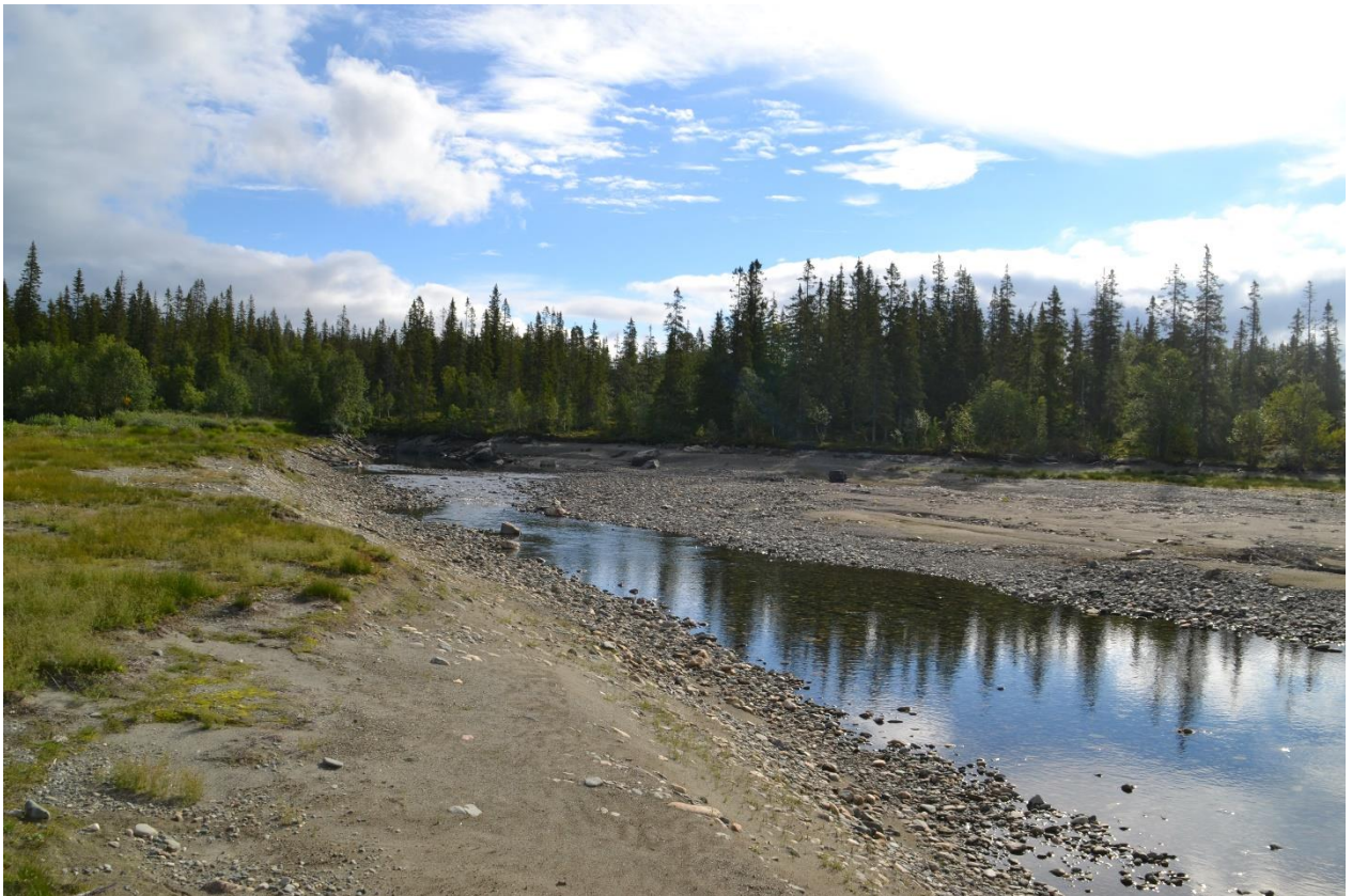
Mykkelvikelva. Vannstand rundt 255,00 eller HRV – 2,50.