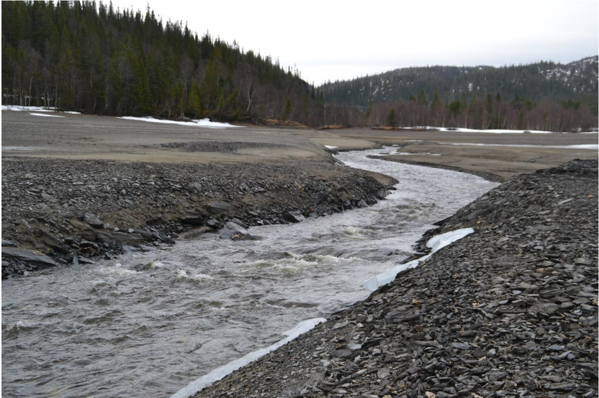
Det er en betydelig lengde på bekkeleiet ved nedtappet sjø. Vannstand 410,21, 121 cm over LRV.