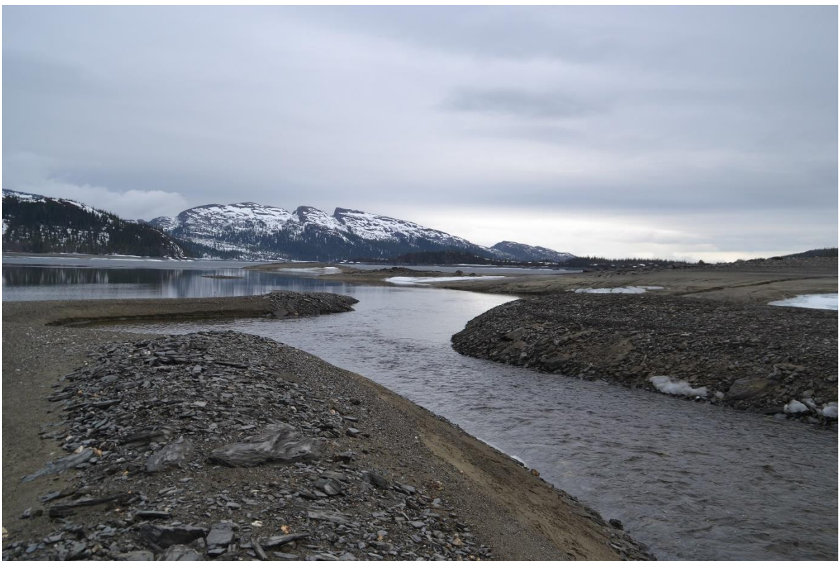
Hovdbekken sett mot Limingen ved lav sjø. Det er gjort en del forebyggende tiltak mot graving i sidene av bekken.