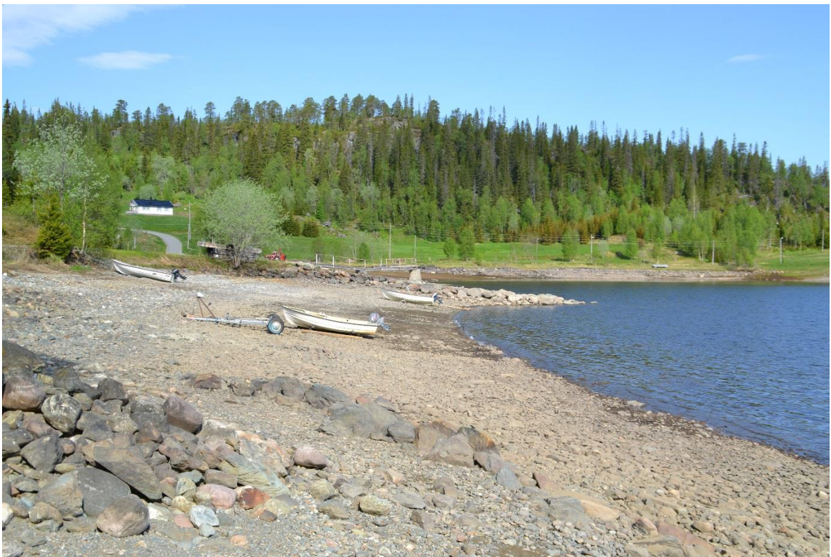
Staldvika 30.05.2013. Det er et svært stort behov for tilretteleggingstiltak for praktisk bruk av båter generelt i Tunnsjøen. Det må etableres tilrettelagte adkomst- bryggeanlegg på et tilstrekkelig antall