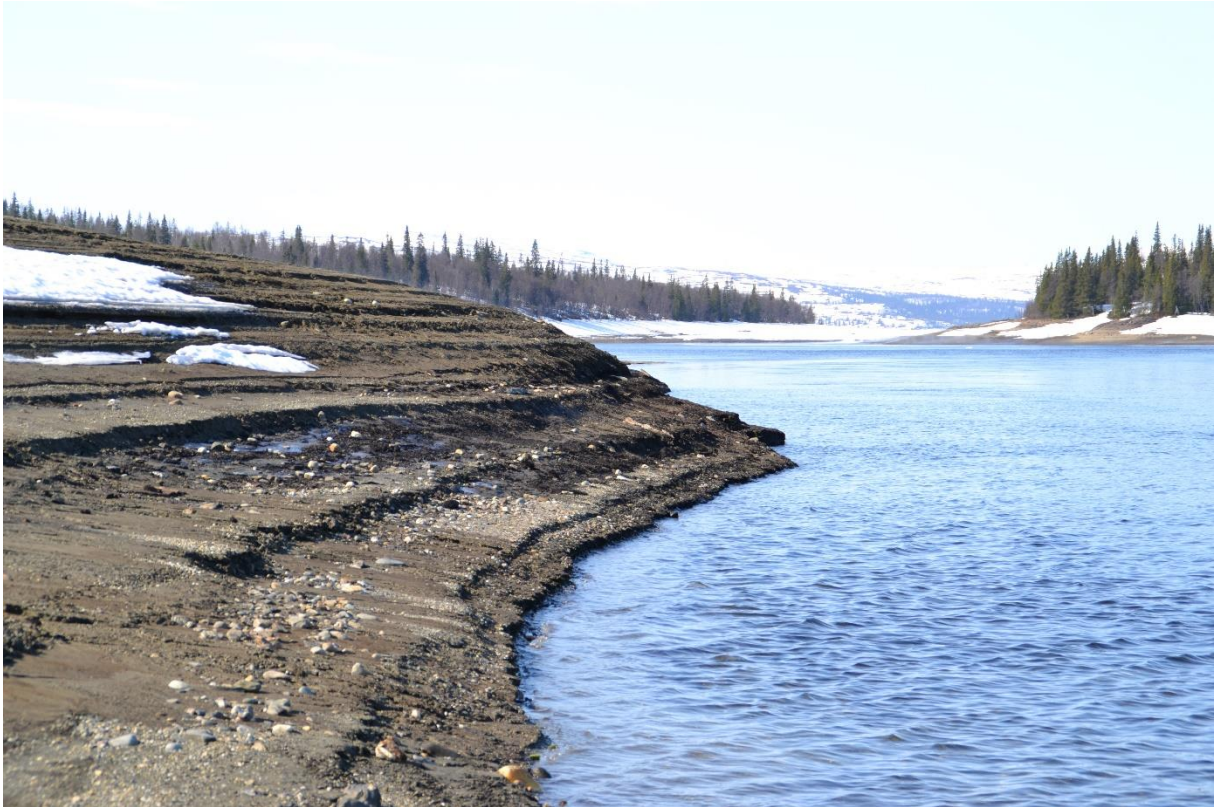
Rørvikbukta er et avskjernet område i forhold til vind om man sammenligner med resten av Limingen, men som bildet viser, får man også her en del bølgeerosjon. Bilde av 11.05.2011.