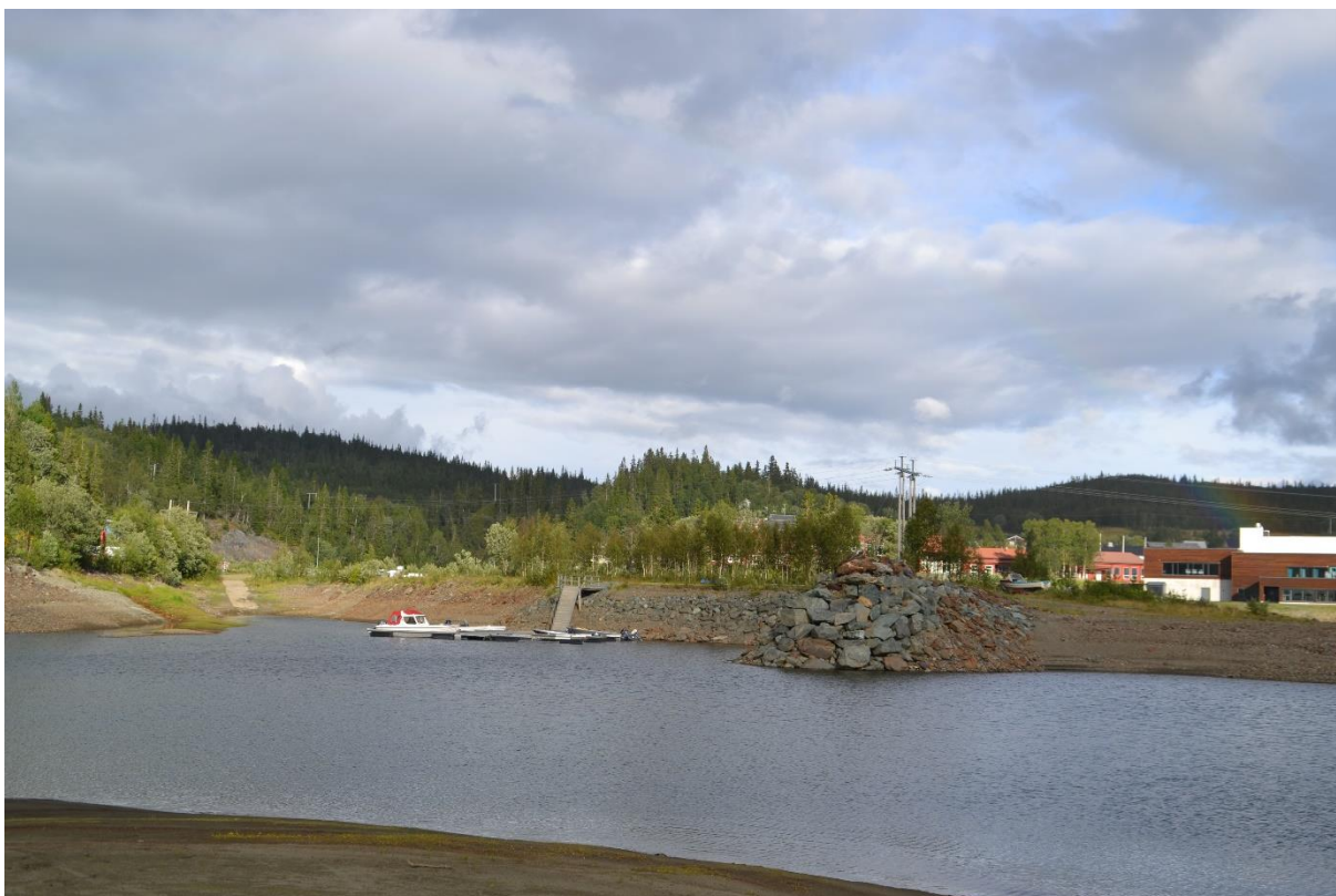
Båthavna 06.08.2018. Vannstand 413,74 = HRV – 3,96.