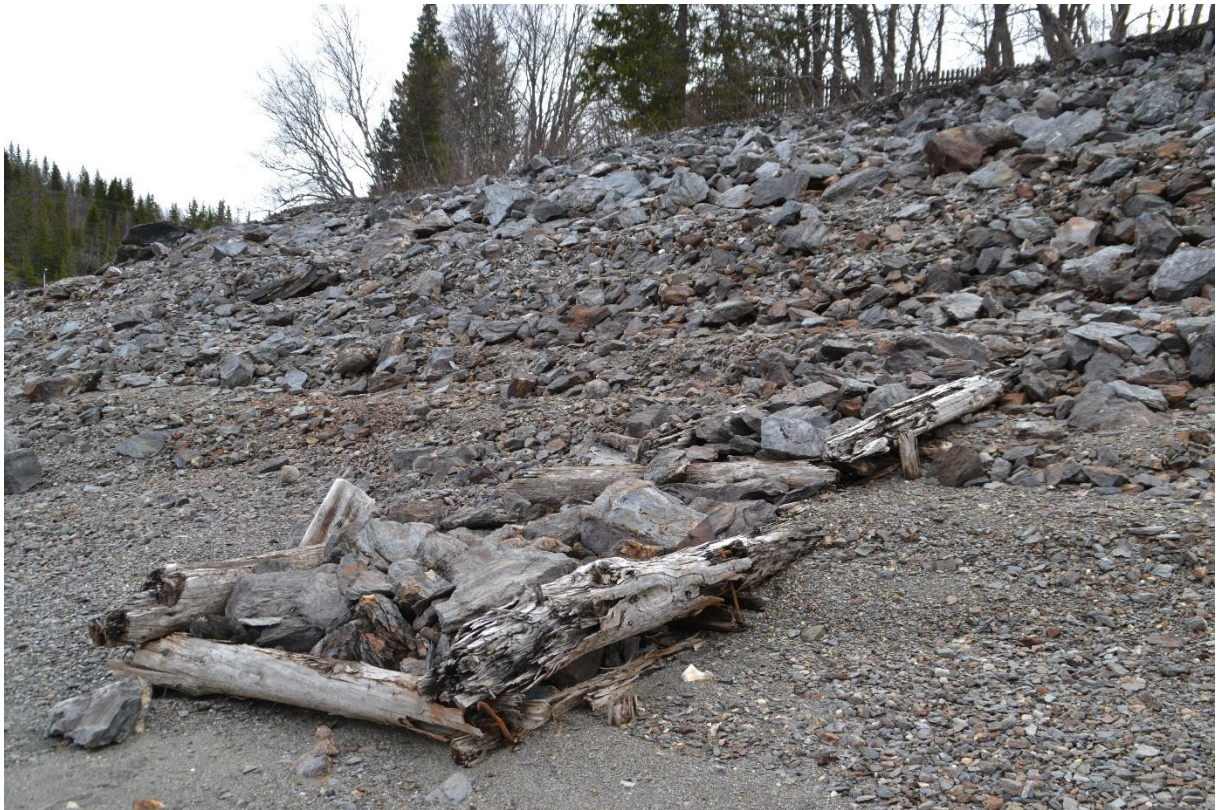
Rester av brygge/båtdrag på Røyrvik kommunes eiendom gnr. 71 bnr.12, den 26.05.2015.