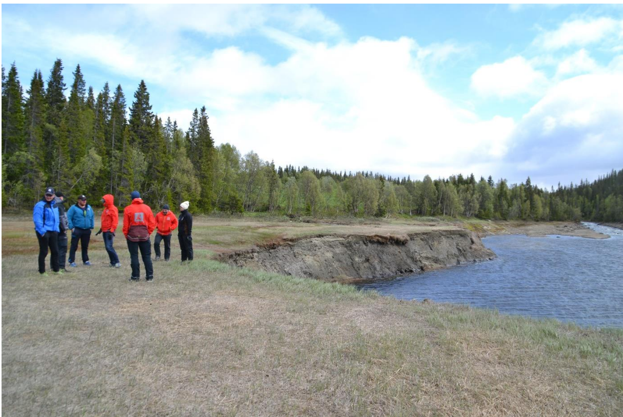
Her foregår diskusjonene på raskanten i Nyvika nedenfor Nyvikelva. Vannstand 413,34 = HRV - 4,34.