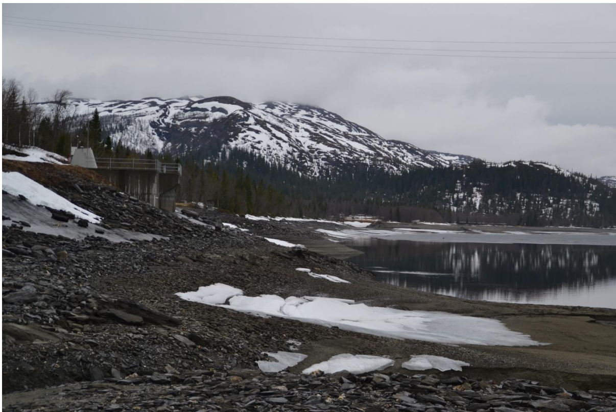
Tunnelinntaket til Linnvasselv kraftstasjon den 11.05.2018. Vannstand 410,21, eller 121 cm over LRV.