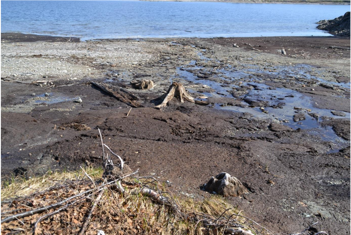
Oppryddingstiltak er nødvendig i den nye strandsonen.