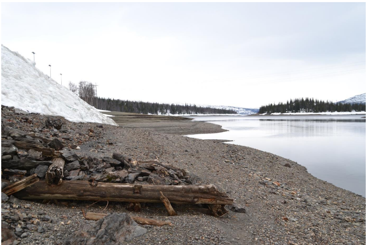
Bilde av bryggen den 07.05.2019. Vannstanden er 411,70, eller nøyaktig LRV for den svenske reguleringen. Forholdene på bildet viser godt hva som var de maksimale adkomstproblemene til