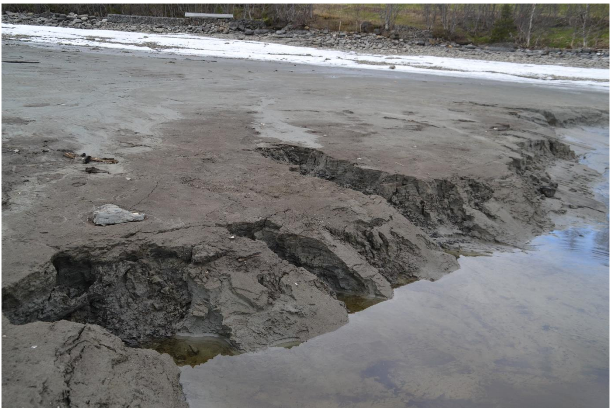
Slåttvika 25.05.2016. Massene glir ut mot dypere områder.