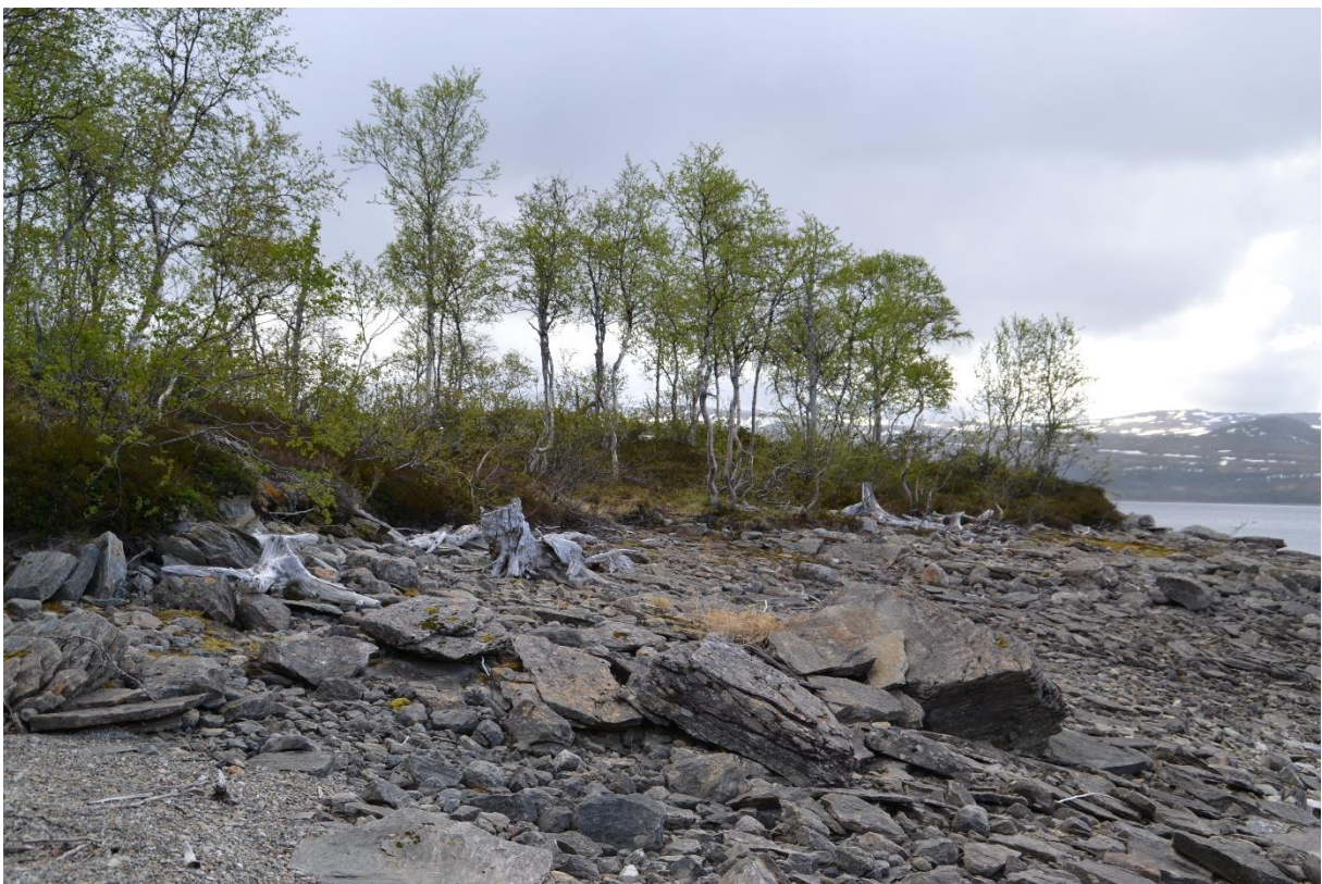
Det tar lang tid å vaske fram en ny stabil strand når vannstanden varierer mye.