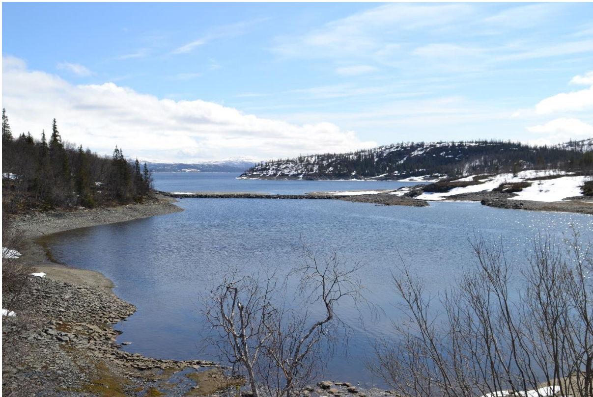
Utsikt mot Limingen som viser terskel anlagt for å holde vannstanden av hensyn til kloakkutslipp.