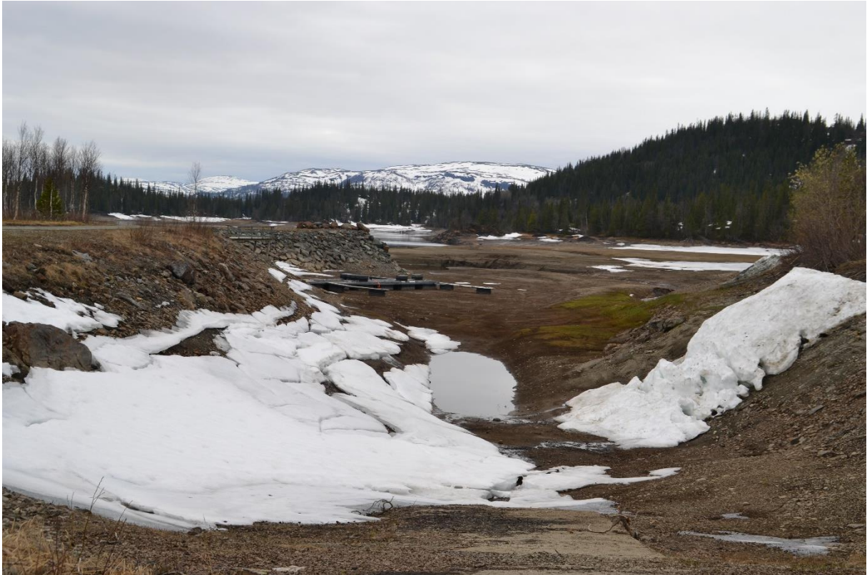
Nedfarten til havneanlegget i Rørvika den 20.05.2019. Vannstand 412,10 = LRV + 3,10