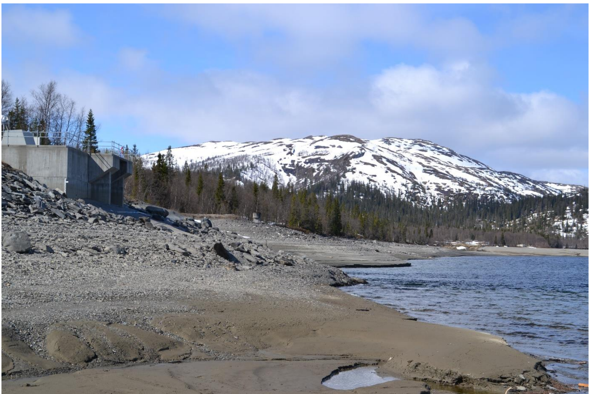
Tunellinntaket til Linnvasselv kraftverk ved lavt vannivå i Limingen. Inntaket er her ikke avskjermet.