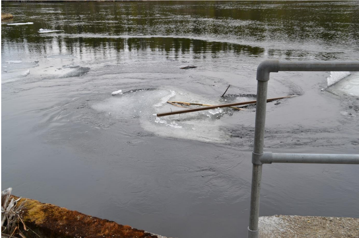
Det er ingen form for avskjerming mot terrenget til høyre for tunnelinntaket. Bilde av 22.05.2018.