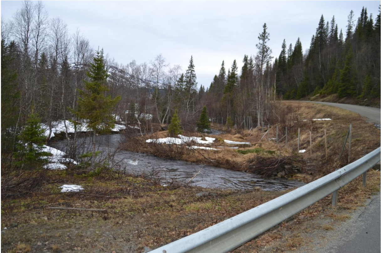
Her krysser Hovdbekken Fylkesveg 7016.