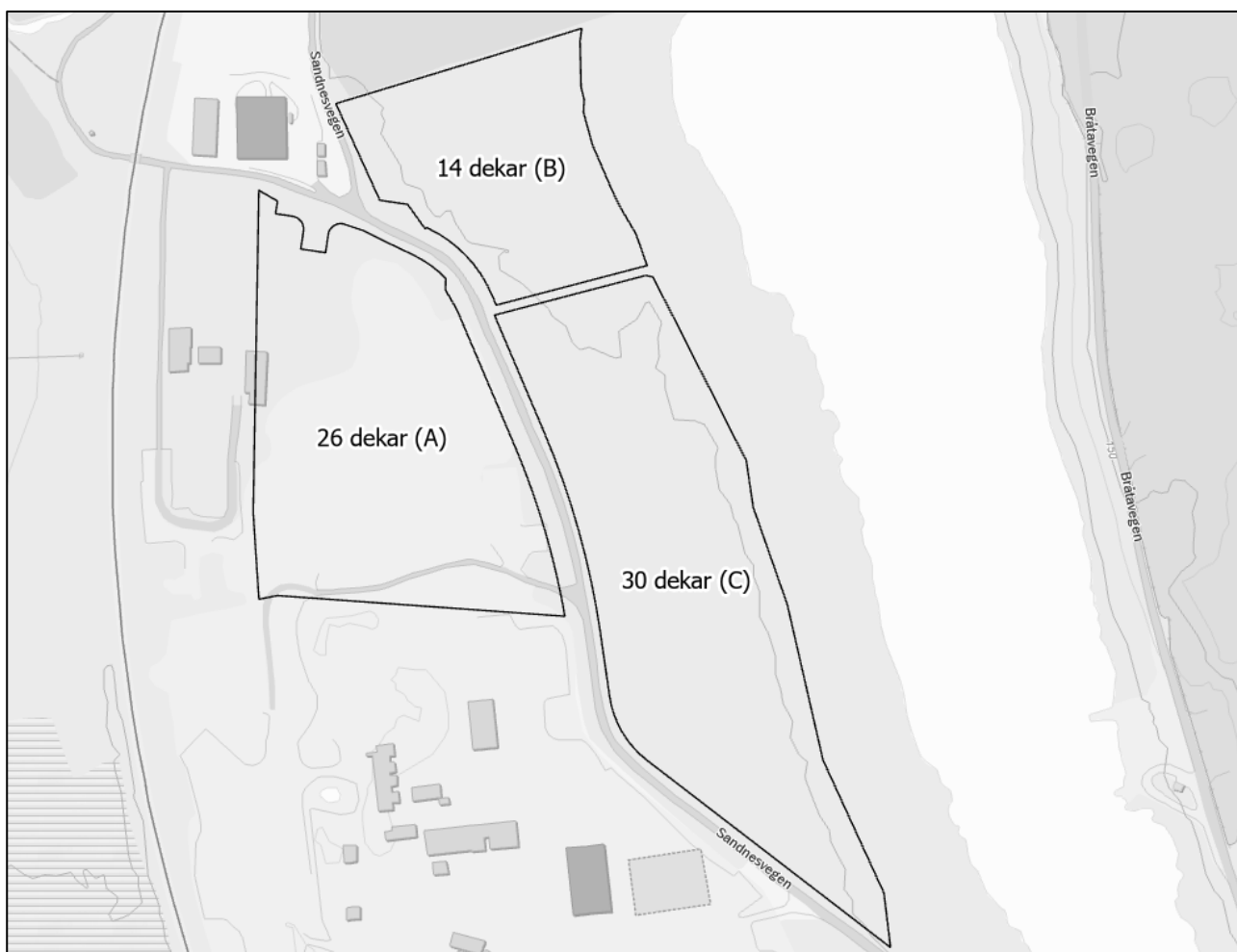
Figur 2-2. Planområdet er tredelt, og her fordelt på A, B, og C med areal.

Totalt areal for de tre delområdene av planområdet er på omtrent 70 dekar (Figur 2-2).