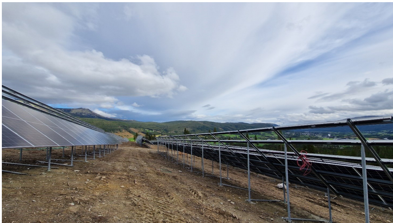
Figur 2-4. Et resultat som dette etter bakkearbeider vil være optimalt for fremtidig skjøtsel av arealet. Her fra Måna solkraftverk.

Problematikken med grunnbearbeiding og komprimering er mest aktuell i område B og C. I område A er grunnen allerede komprimert og ødelagt. Her vil det være mangel på toppjord å så engfrøene i som kan bli et problem. Her er også den fremmede arten hagelupin (SE) registrert, og denne må fjernes før man sår til med eng. Gjør man ikke dette vil trolig hagelupin dominere på arealet innen få år.