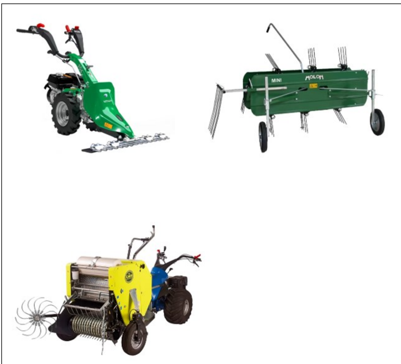
Figur 2-6. Aktuelle maskiner. Øverst fra venstre: Tohjuls slåmaskin, sidevenderrive, minirundballepresse.

Samlet gir dette kostnader til utstyr på 275 000 – 390 000 kr . I tillegg kommer driftskostnader. Innsatskostnader kan reduseres dersom utstyr kan leies. Overslaget gir er timeanslag på totalt 80 timer . Dette må trolig sees på som et minimum, og det avhenger av driftsforhold, vær og kompetanse. Det er ikke beregnet kostnader til frø eller såing. Dersom slåtten kan brukes til dyrefor vil dette kunne redusere kostnadene ved at man får noe av verdi tilbake.