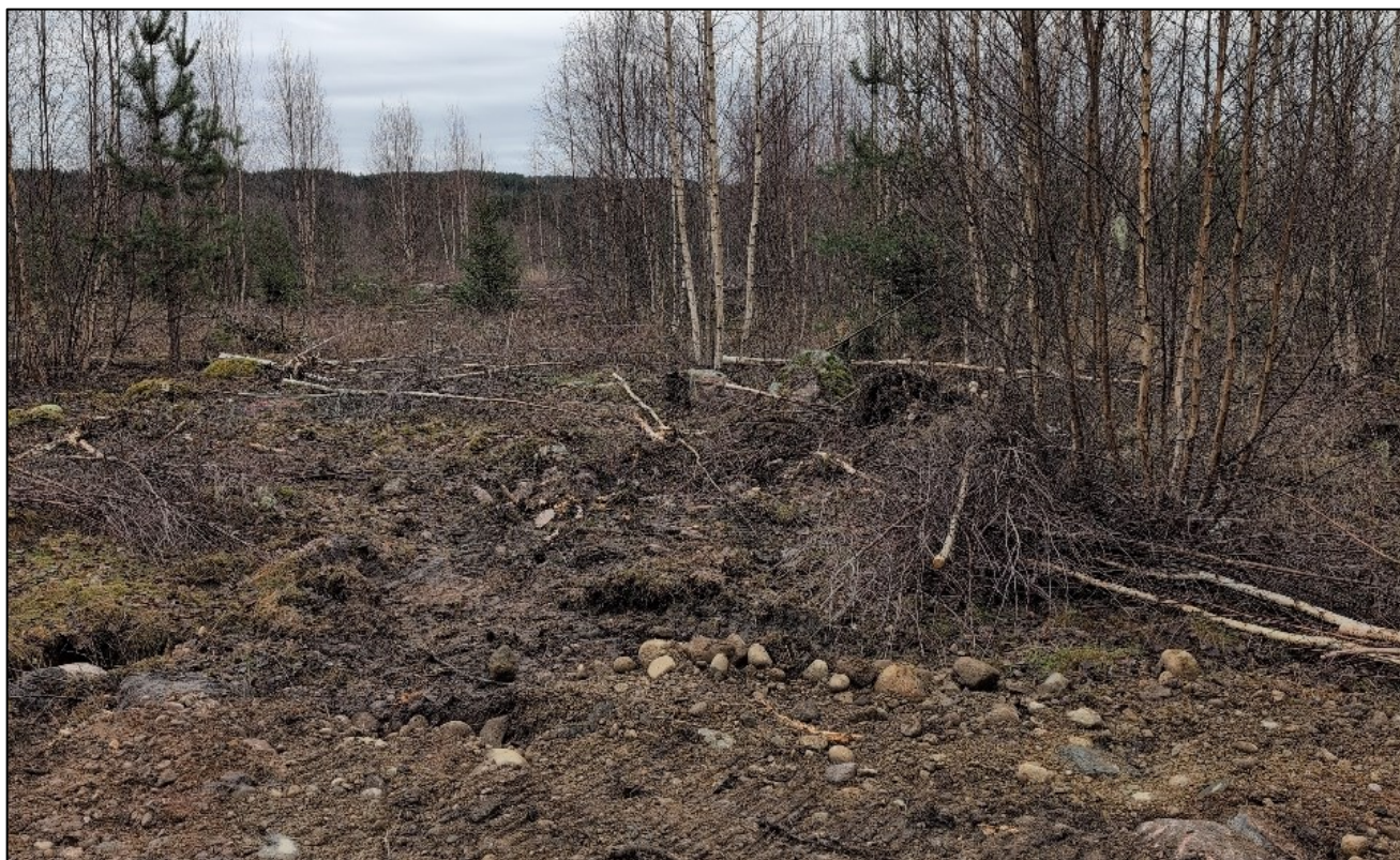
Figur 1-1. Bilde fra planområdet øst for veien, fra november 2025.

Ifølge konsekvensutredningen bærer planområdet og området rundt preg av å være benyttet til ulike arealformål over lang tid, foruten et smalt belte langs Vrangselva/Søndre Åklangen. Grunnen består stort sett av breelavsetninger med mye sand og grus. Grunnen er næringsfattig, og terrenget er relativt flatt. Det vestlige området er delvis asfaltert/har oljegrus i grunnen, og det vokser noe yngre bjørk på området. Store deler av dette området er infisert med fremmedarten hagelupin (SE – svært stor risiko). Området brukes i dag til mellomlagring av masser for pelletsfabrikken ArbaOne. Øvrige arealer består i dag av hogstflate, med oppslag av bjørk og boreale løvtrær.