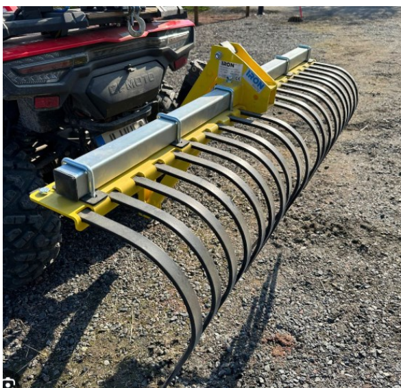
Figur 2-3. Grov rive bakpå ATV vil kunne brukes til å fjerne mindre stein og røtter, og jevne ut bakken.

Det forventes at det vil bli en del bakkearbeider på arealene før panelene skal oppføres. Differ ønsker å fjerne stein og røtter, og flekkvis jevne ut terrenget der det er større ujevnheter. Dette vil være fordelaktig for etablering av eng-aktig sterkt endret fastmark, og det vil gjøre området enklere å skjøtte i driftsfasen. For grunnens evne til å håndtere overvann og flom, og for å sikre god drenering, er det løftet bekymringer rundt mye kjøring med tunge maskiner som kan lede til jordpakking og komprimering av toppjordlaget. Slik komprimering vurderes ikke som kritisk å unngå for å etablere engarealet, men det vil klart være en fordel om man klarer å beholde et veldrenerende toppjordlag. Derfor bør man så langt det er mulig hensynta dette. Fjerning av stein, røtter og eksisterende vegetasjon vil være positivt for såing og senere slått av enga. Man kan se for seg at bearbeiding av området med en litt grov rive, for eksempel bakpå en ATV, vil kunne være optimalt å gjennomføre etter at stedvis planering og fjerning av stor stein er ferdig (Figur 2-3).