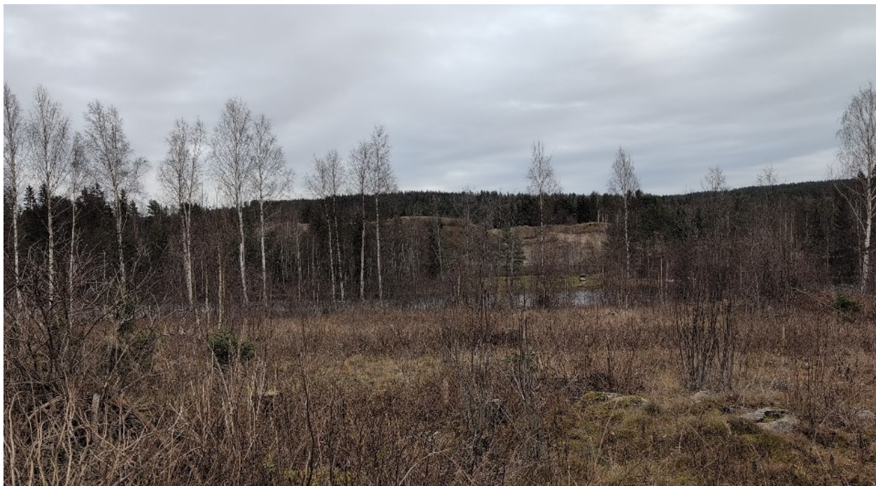
Figur 2-1. Det finnes enkeltstående bjørketrær som i dag utgjør et smalt belte med kantvegetasjon mot Søndre Åklangen.

Når det gjelder kantvegetasjon mot Søndre Åklangen, ser det ut til at denne i dag består av et tynt belte med bjørk, trolig med innslag av andre boreale løvtrær som selje og gråor. Det er satt av en sone på omtrent 50 meter fra solkraftverkets yttergrense i øst mot elva. Det anbefales at vegetasjonen her får utvikle seg i fritt i 5 – 10 år. Når trærne er omtrent 5 meter høye vil det være fordelaktig å foreta en tynning, for å gi mer lys til undervegetasjonen og få fart på veksten til de trærne som ikke tas ut. På den måten vil man fremskynde prosessen med å gjøre skogen mer variert og flersjiktet. Gran bør også ryddes under tynning, da dette er et treslag som skaper skygge og utkonkurrerer mye annen vegetasjon.