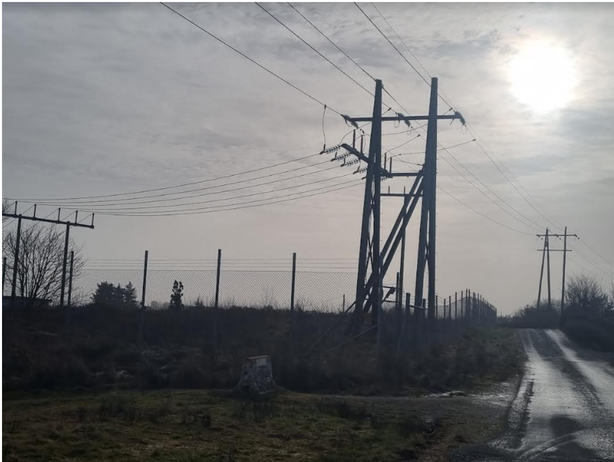
Figur 2 Oversikt over de tre nærmeste mastene.

Masten som er et knutepunkt for ledningene føles utrygg for oss per dags dato, og den bør ikke stå der den står nå. Dessuten føles det ekstra utrygt at dagens 66kv skal økes til 132kv uten at noen snakker om å flytte eller omlegge disse, som står så tett opp mot huset vårt. Vi stiller oss bak forslaget om å se muligheter om å legge disse i bakken. Dette har også Direktør for kommunikasjon og kundetjeneste ved Haugaland kraft uttrykket selv til Haugesund Avis følgende: «Nettselskapet vårt Fagne har planer om utskiftning av 66 kv ledninger i det aktuelle området. Samt Bø transformatorstasjon, [...] [...] Det vil da være naturlig å vurdere jordkabler på en kort strekning her». Videre viser vi oversiktsbilder at det står ingen hus i veien på dette inngjerdede området, som Haugaland Kraft eier selv. Samtidig er det en ungdomsskole som nest nærmeste nabo til dette området (se kart lengre ned). Vi er 3 barnefamilier langs denne veien, og alle har gitt inntrykk for bekymring for disse kraftledningene.