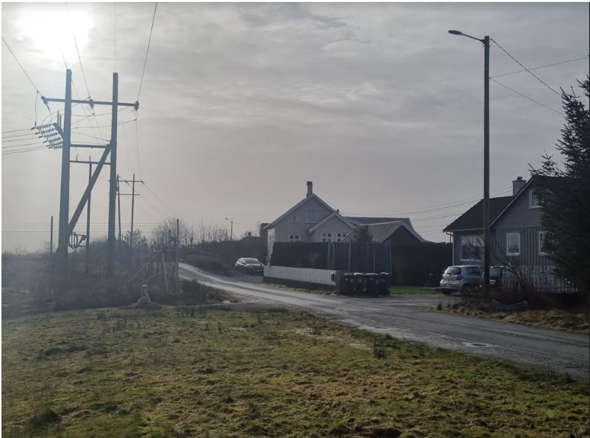
Figur 1 Oversikt av masten mot vårt hus og en annen nabo

Vi har allerede opplevd at transformormasten kortslettet og vi kjente trykket på kroppen igjennom stuevinduet. Dette har også resultert i en del reportasjer i Haugesund Avis. Etter møtet 7. februar hvor vi informerte Fagner om denne hendelsen, så gav de utrykk for at dette var ukjent for dem. Derfor legger vi med disse reportasjene i eget vedlegg, for å «tegne» et mest mulig korrekt bilde av hvor utrygg vi faktisk føler med å ha en slik mast så tett opp mot huset.