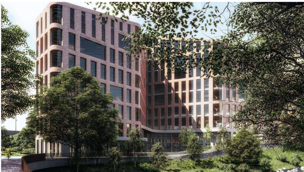
Figur 1: Illustrasjon av prosjektet [4]

Det er planlagt å rive eksisterende bygningsmasse og etablere et nytt kontor-/næringsbygg på tomten. Det nye bygget vil bestå av 1-3 kjelleretasjer, og etablering av kjelleren vil innebære etablering av en inntil 8 meter dyp byggegrop.