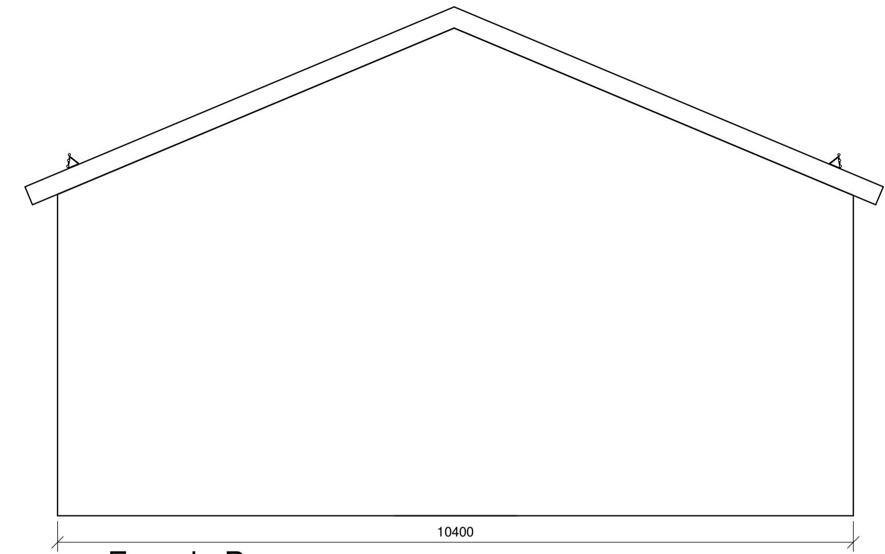
Fasade B 1 : 50