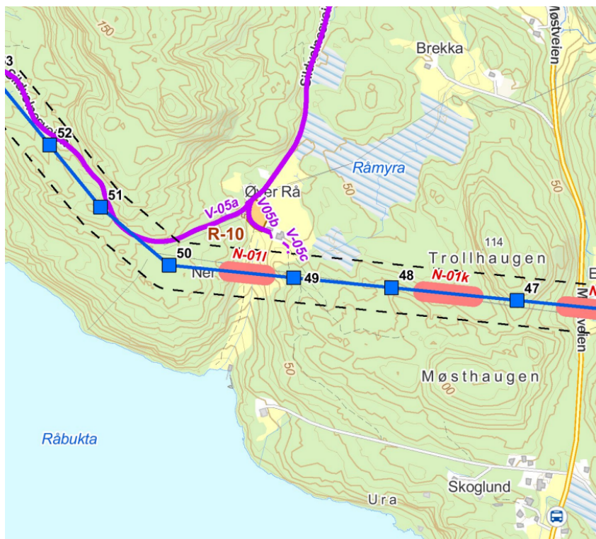
Bilde 2: Kart over plassering av riggplassen ved Øvre Rå (R-10, oransje område).