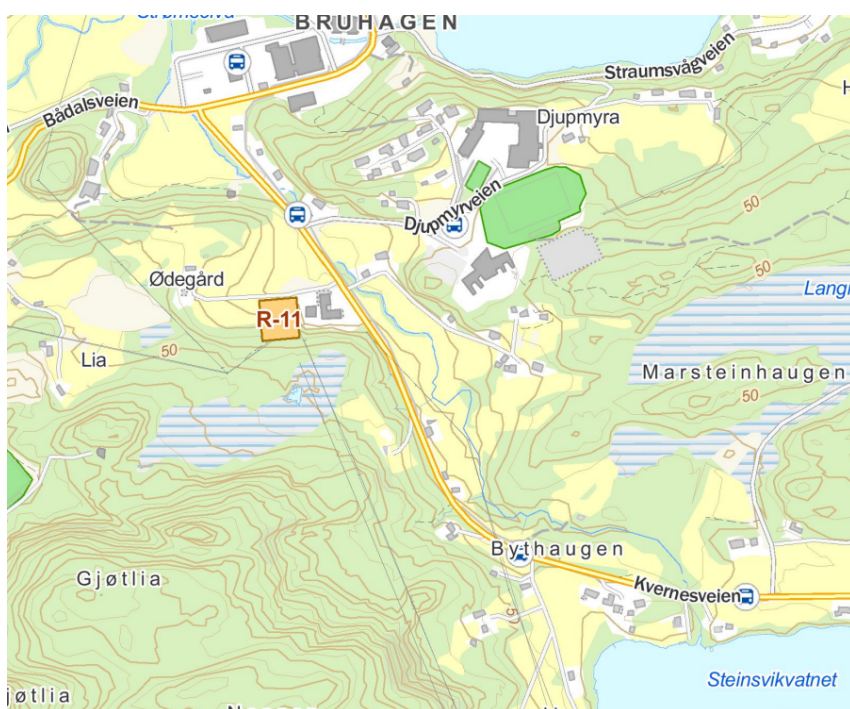
Bilde 3: Kart over plassering av riggplass ved Bruvoll transformatorstasjon (R-11, oransje område). Kilde: Mellom, 9. september 2024

Begge riggarealene ligger helt eller delvis på dyrket mark. Riggplassen ved Øvre Rå ligger i sin helhet på dyrket mark. Riggplassen ved Bruvoll transformatorstasjon er tidligere brukt som riggplass for nylig avsluttet prosjekt for ledning mellom Bruvoll og Engviklia, og er