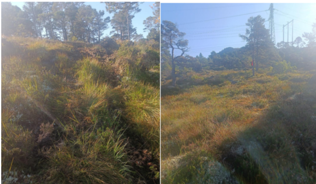
Bilde 5: terrenget utenfor inngrepsgrensen ved mast 11.