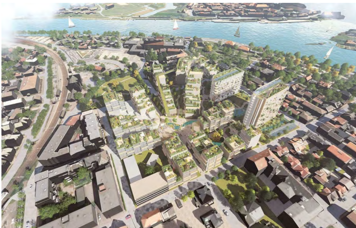
Figur 2: Illustrasjon av prosjektet (sett mot syd) [3]

Romerike Geoteknikk AS (RGT) har fått i oppdrag av NG Development AS å utføre uavhengig kvalitetssikring av områdestabilitetsvurdering som er utført av geoteknisk rådgiver Norges Geotekniske Institutt (NGI) ifm. planlagt utvikling av boligprosjektet Cicignon Park, gnr./bnr. 300/1494 m.fl. i Fredrikstad kommune, jf. situasjonskart i Figur 1 og illustrasjon i Figur 2. Prosjektet omfatter ombygging av det tidligere Sentralsykehuset i Østfold til boligformål. En geoteknisk vurdering av områdestabilitet har blitt utført av NGI på oppdrag for COWI AS i 2021.