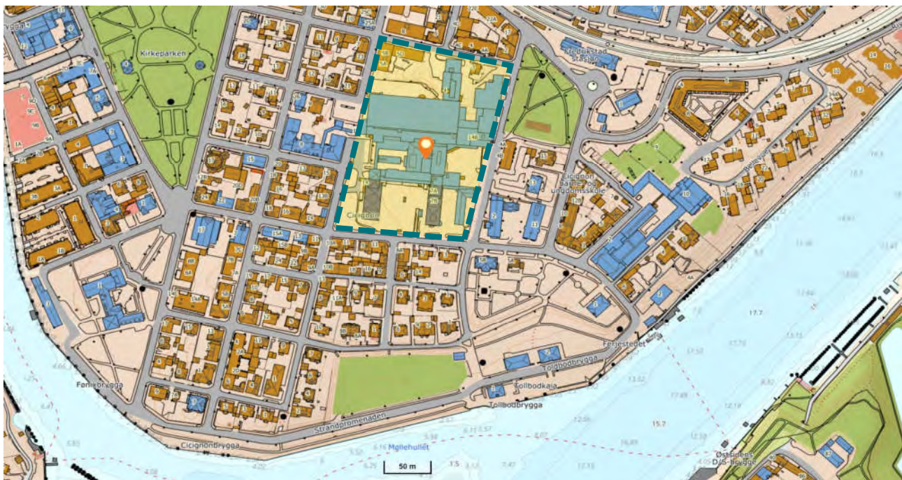
Figur 1: Topografi og bebyggelse rundt tiltaksområdet, gnr./bnr. 300/1494 m.fl. i Fredrikstad kommune. Tiltaksområdet er vist med markør.

Utført områdestabilitetsutredning er i tråd til NVE-veileder 1/2019, og anbefales godkjent.