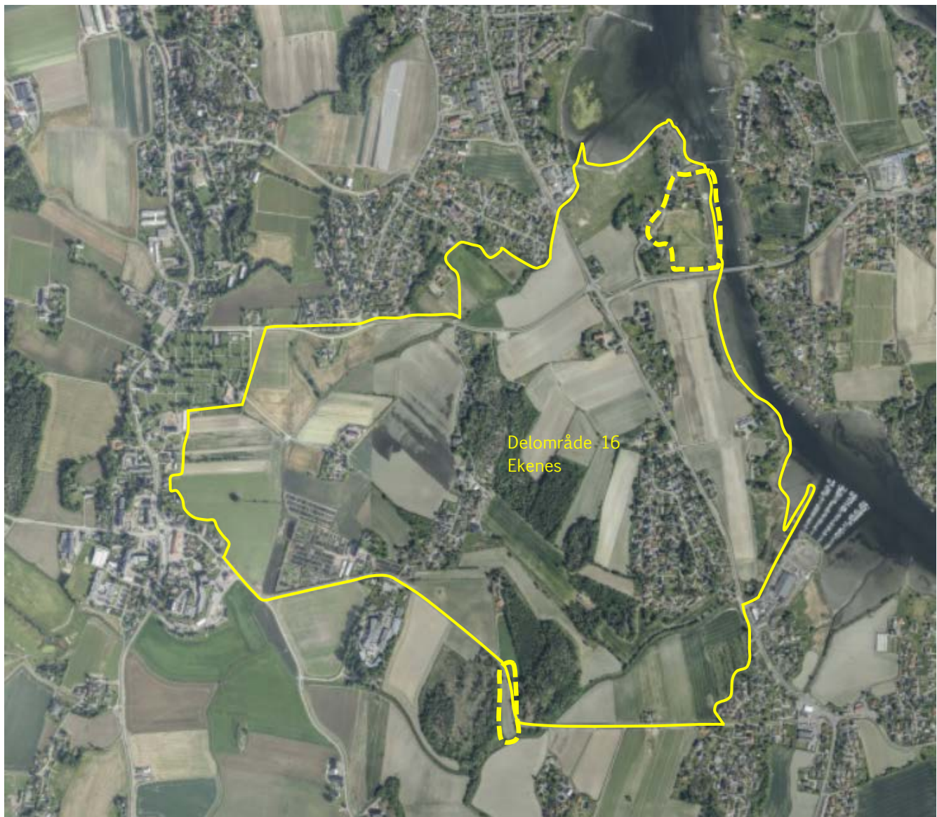
Figur 2. Flyfoto fra www.norgebilder.no tatt 01.04.2019 med delområde 16 skissemessig markert med heltrukken strek, og potensielle faresoner med stiplet strek.