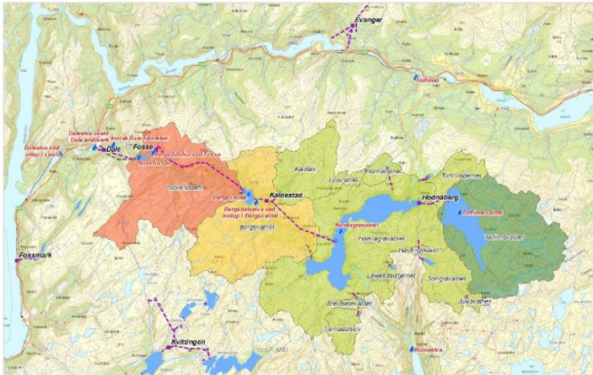
Figur 11 Referansepunkt for vannføring og magasin.