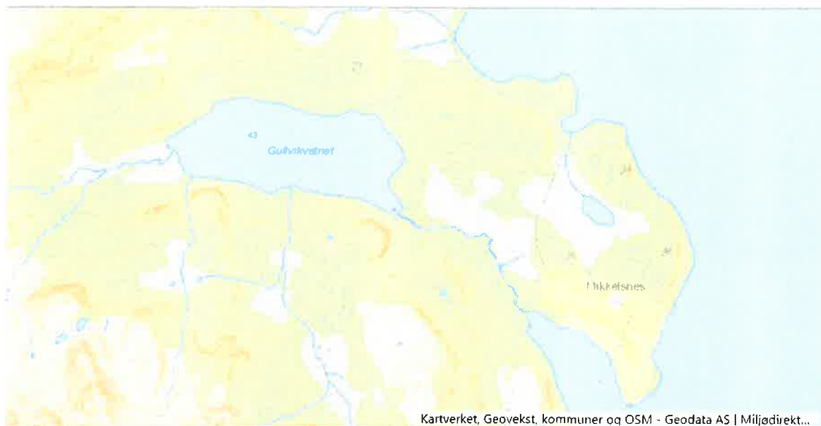
Figur 1. Kart.