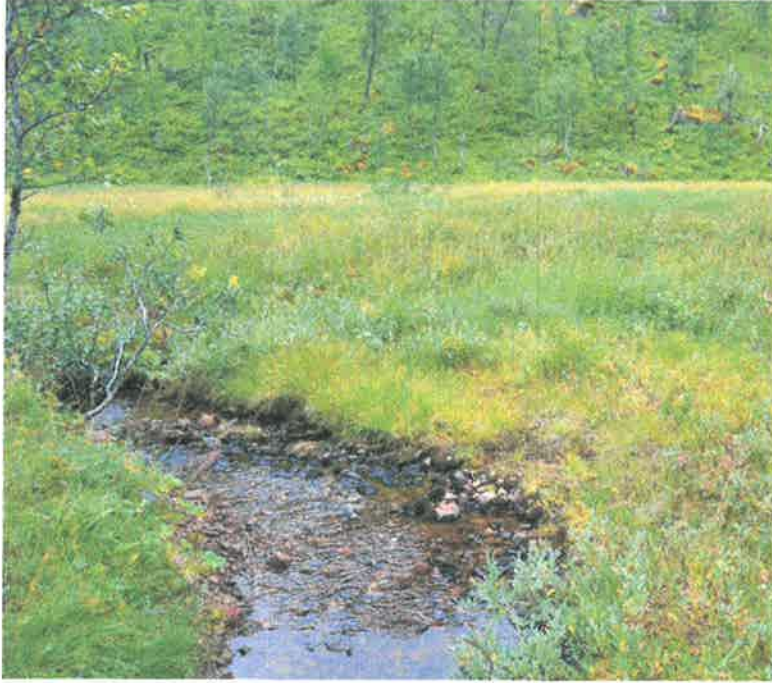
Bilde 2. Bekken som kommer fra nedslagsfeltet i fjellområdet og inn i myra og renner ut i vestre del av Gullvikvatnet.