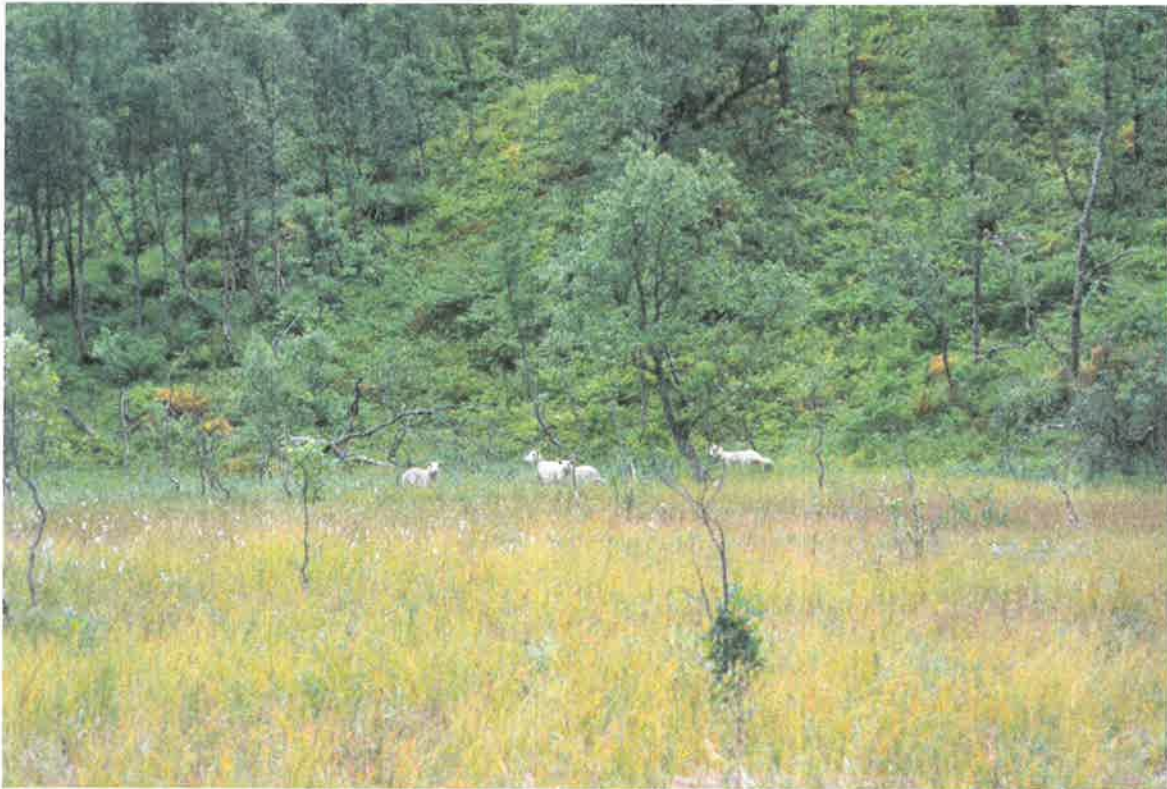
Bilde 3. Sau på beite ved Gullvikvatnet.