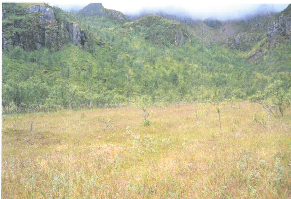
Bilde 1. Bildet viser det flate myrområdet i vestre del av Gullvikvatnet.