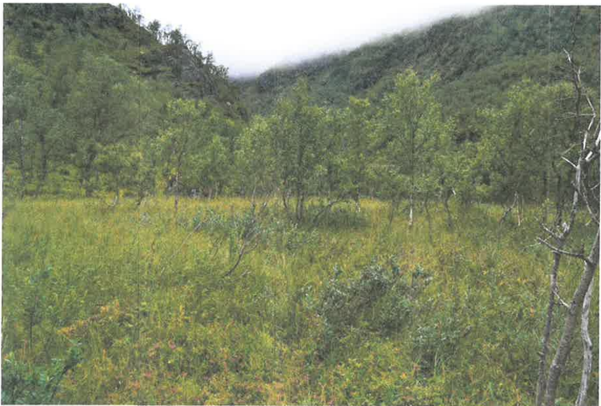
Bilde 4 og 5. Beitemark og mulig gammel slåttemark på sørsida av Gullvikvatnet.