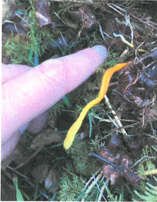
Bilde 6. Bildet viser sopp fra beitepåvirka utmark som ligger nær til naturbeitemarka. Arten er enten gul småkøllesopp ( Clavulinopsis helvola , mest på sur mark, relativt vanlig over hele landet) eller rødgul småkøllesopp ( Clavulinopsis laeticolor ). Arten kan bare bestemmes ved mikroskopering. Jordal, Jon Bjarne 2019.