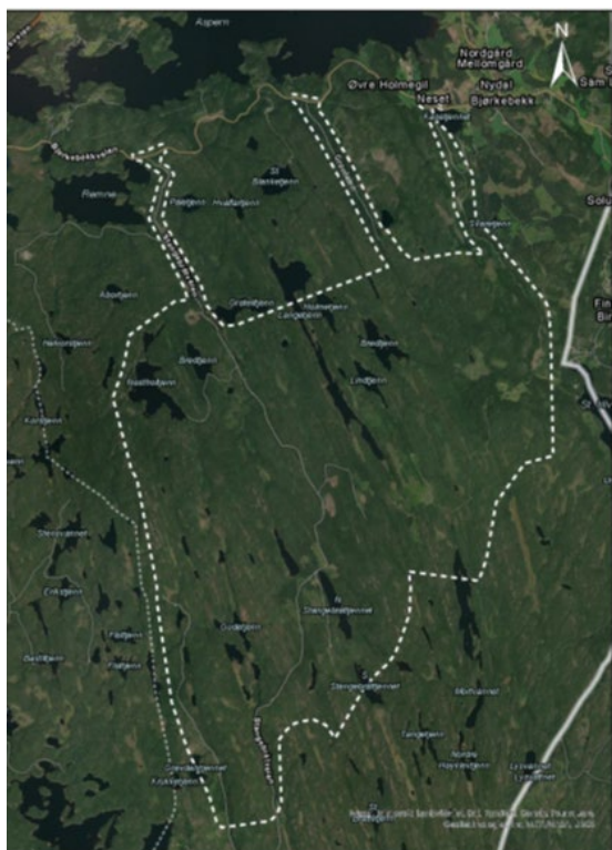
Planområde Aremark Sør (1)

Meldingene vil behandles etter energiloven av NVE og plansakene blir behandlet etter plan- og bygningsloven av Aremark kommune. Melding med forslag til plan- og utredningsprogram er utarbeidet for hvert av områdene av respektiv tiltakshaver.