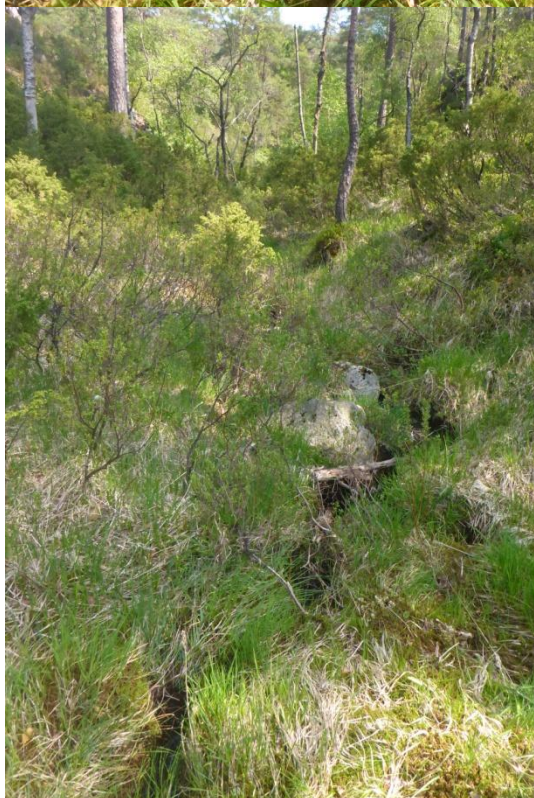
Foto til venstre viser bekken som passerer nord for planområdet og som bekkesig fra myr i planområdet drenerer til, jf foregående side.

Bekken er liten, undergrunnen steindominert men ofte overgrodd av blåtopp. Tross liten størrelse finner man variasjon i vannområder fra småfusser til stillevannsområder og med permanent vannføring og vannspeil, jf foto over. Tross sin begrensede størrelse vil bekken ha verdi for evertebrater, potensielt amfibier.