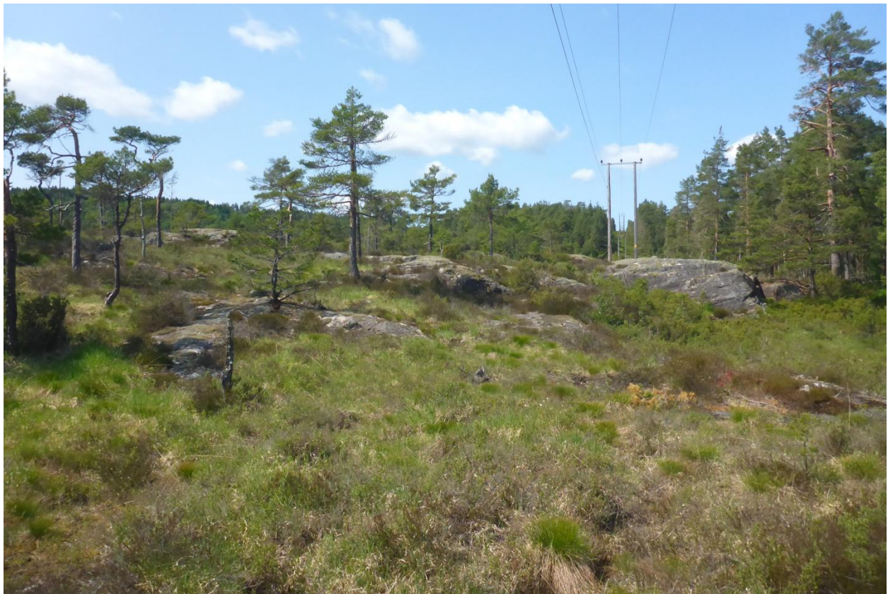
Foto under: En kraftlinje i regionalnettet passerer nord for planlagt solpark. Innsynet gir samtidig generell beskrivelse av forekommende vegetasjon og terrengformer i området.

Revehei solpark ønskes etablert på Revehei straks sørvest for Finsådal i Lindesnes kommune. Området er i dag et magert skogsområde – her forstått som begrenset skogdekke på grunn av mye berg i dagen og tynt til svært tynt jorddekke for øvrig. En kraftlinje passerer langs nordre periferi av planlagt park men for øvrig er området fritt for tekniske inngrep ut over kjørespor og provisorisk vei inn til området for skogavvirkning.