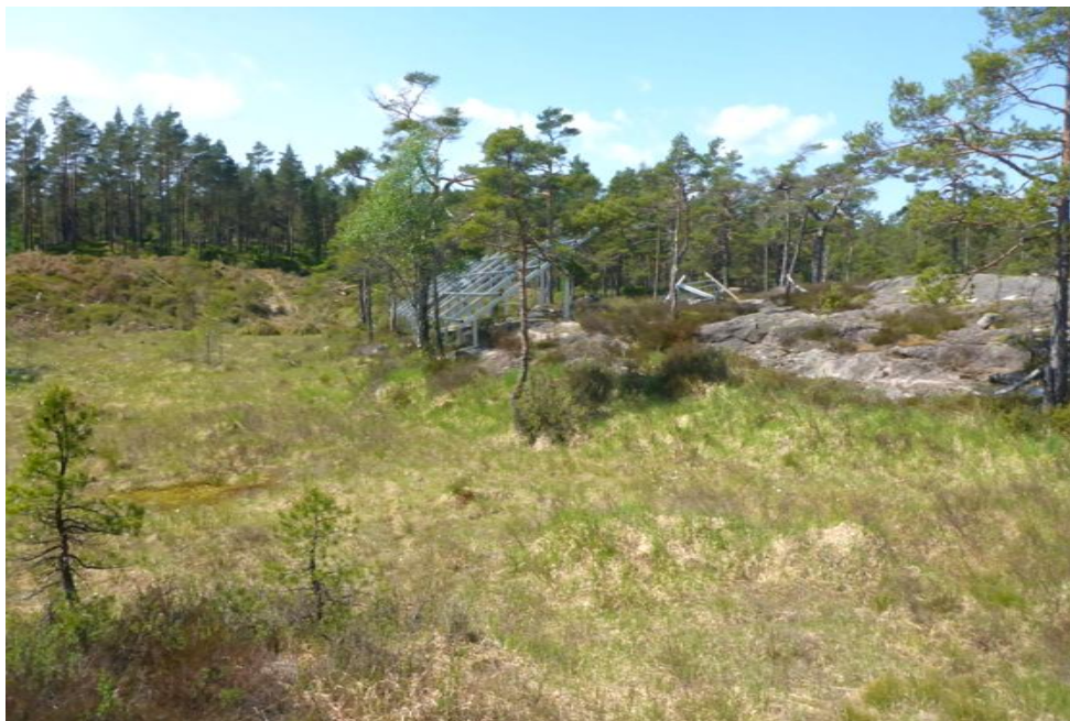
Foto over er fra panelstativet sentralt på området. Foto under viser befestigelse; det bores 2" hull i berget og festestål med 1" kamjern av galvanisert stål gyses (= faststøpes med sementmørtel) fast i hullet. Gysingen gjøres med spesialbetong/gysemasse fra Heydi. Denne er inert når herdet. Boringen produserer ca ½ liter steinmel – i denne sammenhengen mest sammenliknbart med mikropartikler fra naturlig forvitret berg.