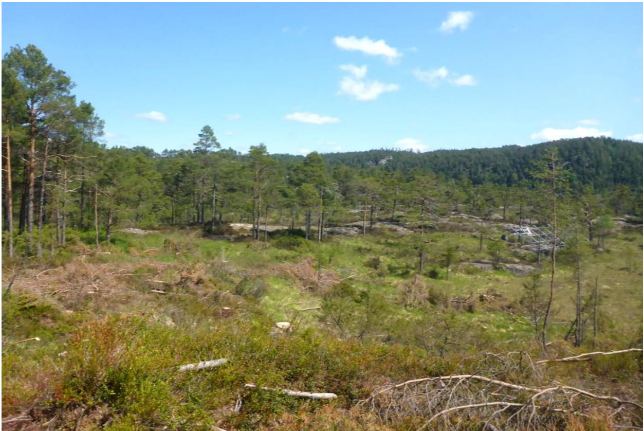
Foto under er fra sentrale deler av feltet og mot NØ. Dersom man zoomer litt inn vil man få øye på et stativ for solpaneler til høyre i bildet.

Tørkegraden forårsakes av at området er bergdominert – uten ytre tilsig/bekker (kun direkte nedbør til feltet bidrar), og uten grunnvannsmagasiner eller grunnvannstransport i løsmasser. Grunnfjellstrauene gir grunnlag for fukttålende vegetasjon men bare arter som også tåler lange perioder med sterkt fallende vannivå – følgene av å være helt prisgitt nedbør men samtidig sterkt tørkeutsatt; sol- og vindeksponert. Dette forklarer hvorfor robuste arter som pors og blåtopp dominerer som de gjør.