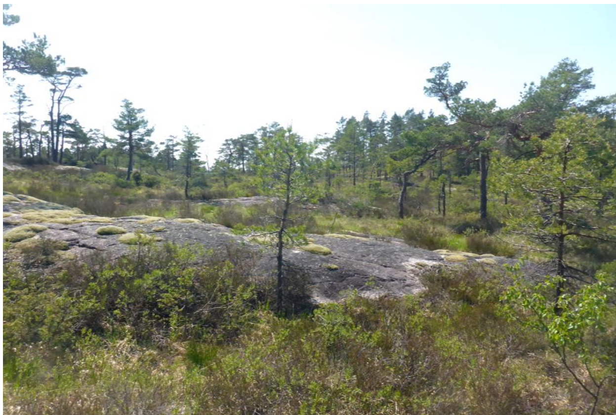
Foto fra nordgrense av tiltaksområdet og mot sør beskriver typisk vegetasjonsbilde og topografi; mye berg i dagen

Terrateknikk undersøkelse 10 – 2025 – versjon 060625