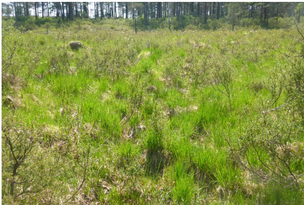
Foto over er fra posisjon "bekkesig fra myr" – jf GPS kartet side 7- og er tatt mot sør/mot planområdet. . Dette er eneste punktet i planområdet hvor det er vannløp av semipermanent karakter ut av tiltaksområdet, jf foto under som viser hvordan vannløpet fremtrer i/over marken. Forholdet er av forurensningsmessig interesse da vannløpet er lite og tilsigsområdet ikke er åpent vannspeil men tilsig over vegetert mark, noe som gir viktig sedimenterende og rensende effekt om vannet er partikkelholdig.