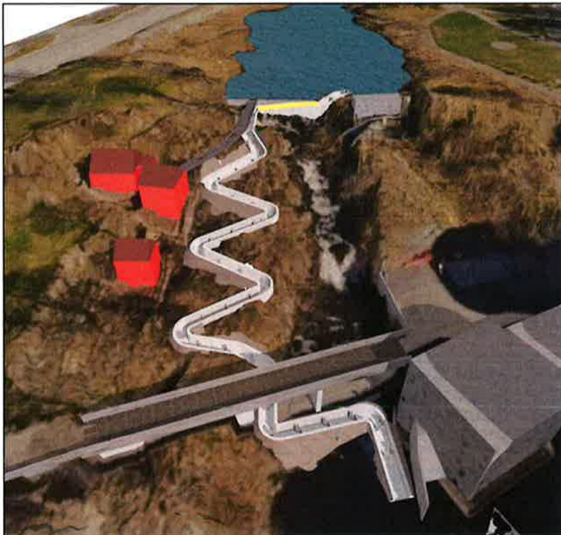
Figur 11: Planlagt fisketrappa alternativ 2, utsnitt fra 3D modell

I alternativ 2 er laksetrappa plassert på nordsida av Møllefossen, jf. Figur 11 henta frå konsesjonssøknad.