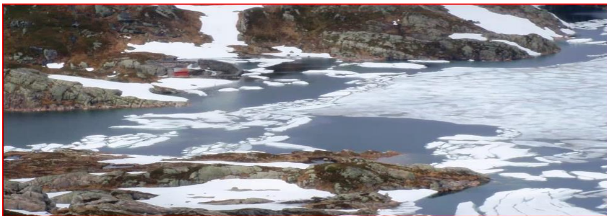
Figur 1 Øvre Dukevatnet med magasin vannstand nær HRV. Til venstre ligger dammen og Evinys naust

Det søkes om å senke vannstanden ned mot kote 803,5 (inntil 1,0 m under LRV) for å kunne etablere nødvendig og sikker grøft samt innfesting for måleutstyret som skal legges ut i magasinet. Magasinet forventes raskt gjenoppfylt til LRV ved naturlig tilsig og snøsmelting fra det ca. 7 km 2 store nedslagsfeltet.