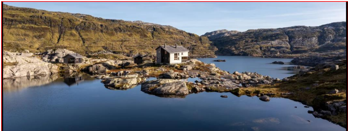
Figur 3 Turistforeningshytten Gullhorgabu på høyden øst for Øvre Dukevatnet

Turistforeningshytta Gullhorgabu ligger på en høyde øst for Øvre Dukevatnet og drives av Bergen og Hordaland Turlag. Bruken av området og hytta er erfaringsmessig størst i ettersommerperioden. Den omsøkte, kortvarige senkningen av magasinet i juni 2026 vurderes derfor å ha begrensede ulemper for friluftslivsinteressene i området.