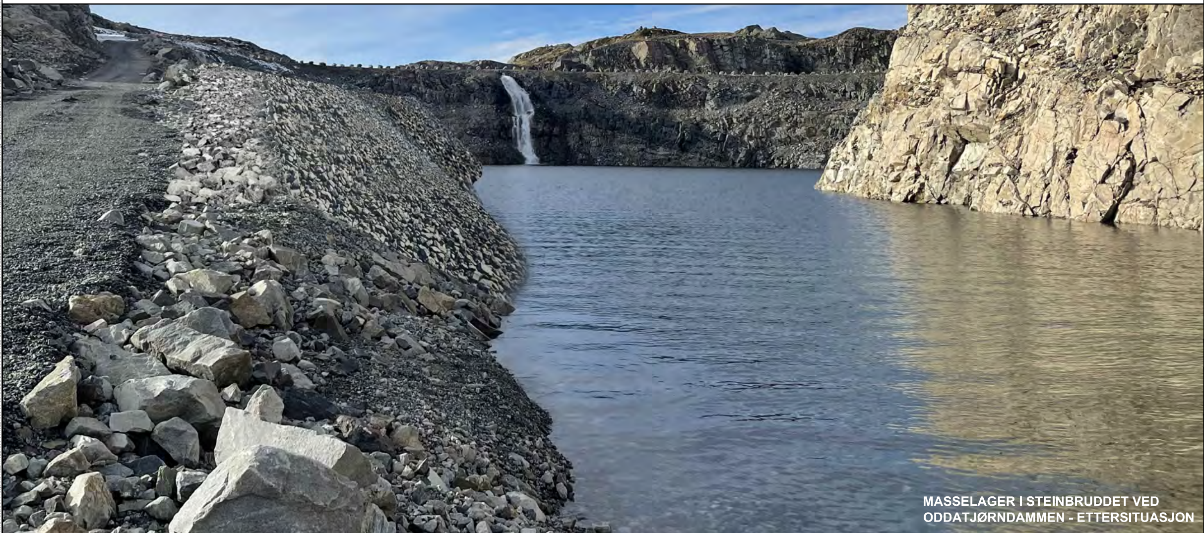
MASSELAGER I STEINBRUDET VED ODDATJØRNDAMMEN - ETTERSITUASJON

MERKNADER Visualiseringen er gjort på foto av området sett mot nordvest, tatt av Multiconsult i oktober 2022. Visualiseringen er basert på 3D modell av området. Ettersituasjon viser tilbakefylling med antatt volum. Endelig resultat vil avhenge noe av anleggsgjennomføringen.