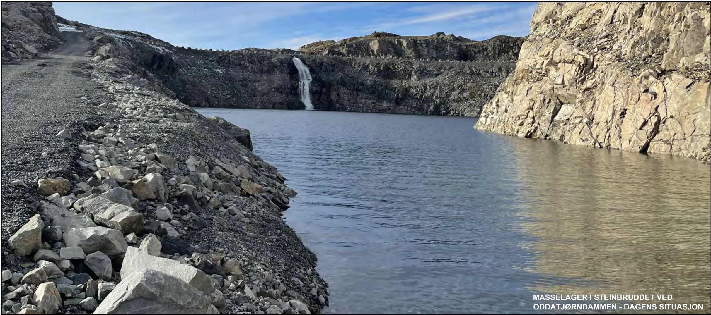
MASSELAGER I STEINBRUDET VED ODDATJØRNDAMMEN - DAGENS SITUASJON