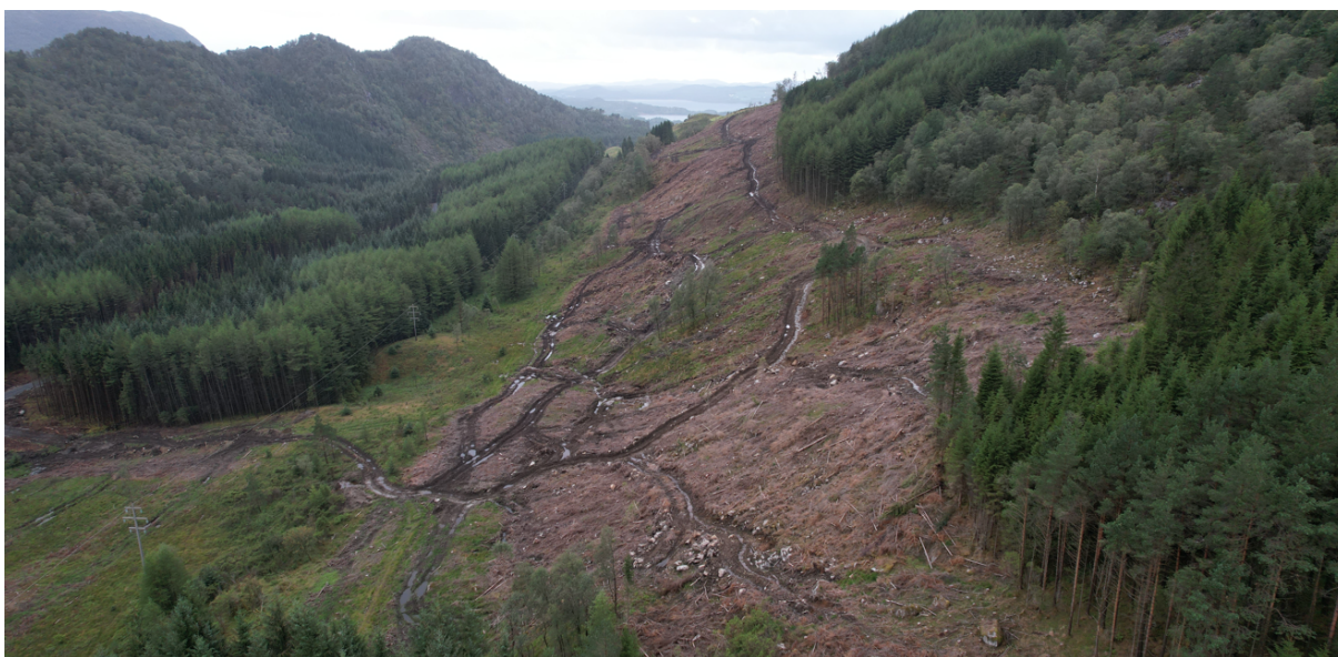
Figur 2 – viser området som det har vært hogst og Fagne søker om å ta i bruk kjørespor.