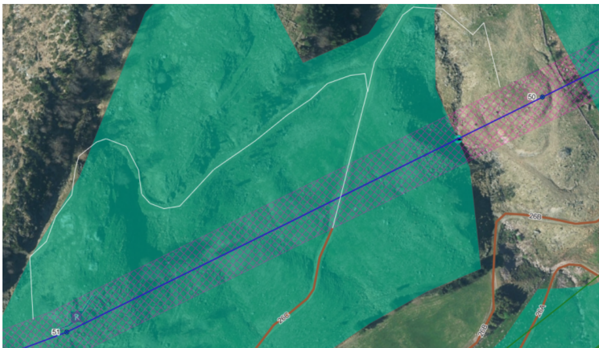
Figur 3 - viser eksisterende traktorvei som ønskes å ta i bruk med hvit strek.

Videre ønsker entreprenøren å ta i bruk eksisterende traktorveier vist med hvite streker i figur 3. Dette er for å unngå å lage nye kjørespor i ledningstraseen i den viktige naturtypen i området (markert i grønt). De skal belte frem en gravemaskin og kjøre ATV.