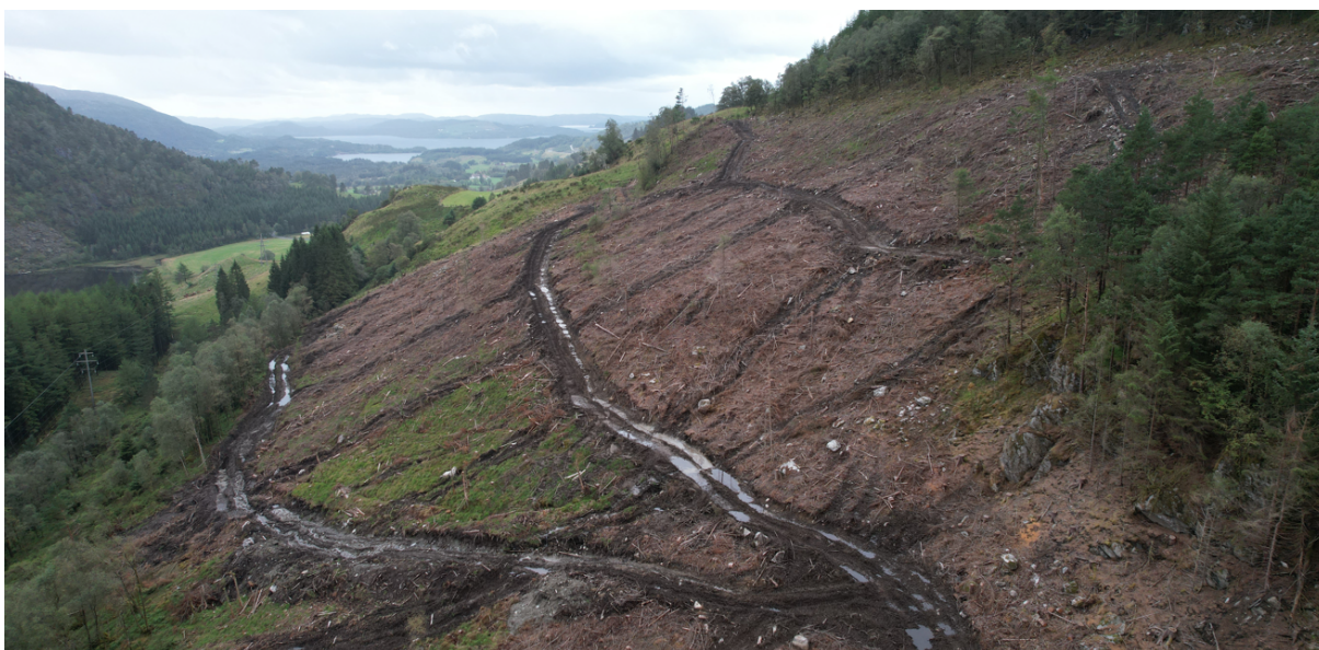
Figur 1 – viser området som det har vært hogst og Fagne søker om å ta i bruk kjørespor.

Fagne AS har justert detaljplanen fordi entreprenøren ønsker å ta i bruk noen kjørespor fra vei 23A og inn til ledningstraseen. De skriver at grunneierne har hatt en større hogst her, og at hogstmaskiner har kjørt på kryss og tvers. Kjøringen som skal gjøres i tilknytning til ledningen ligger innenfor området som er hugget, og vil være marginal i forhold til aktiviteten som har vært der i forbindelse med hogst. Området er vist i figur 1 og 2.